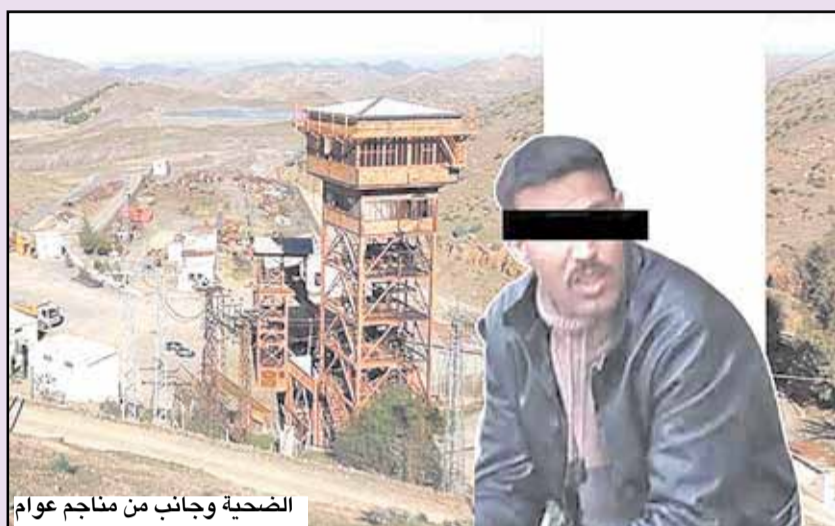
الضحية وجانب من مناجم عوام

ومعلوم، حسبما يقال دائما، أن عددا من «ضحايا لقمة العيش» قد تساقطوا، إما جرحى أو قتلى، بمناجم عوام التابعة للشركة المنجمية «تويسيت»، حيث عاشت هذه المناجم الكثير من الماسي والدماء، ولا تزال لعنة «حوادث أغوار الموت»، تتواصل بشكل مثير للآلام والجدل، وتتشد في كل مرة على تدخل الجهات المسؤولة والقضائية لأجل الحسم في الأوضاع القائمة بهذه المناجم، وتحديد المسؤوليات في مدى التزام الشركة المنجمية بشروط الصحة والسلامة، وبإعمال مبدأ عدم الإفلات من المساءلة والمحاسبة.