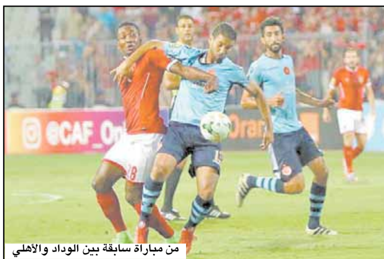
من مباراة سابقة بين الوداد والأهلي

وقال عبد الحفيظ في حديثه لموقع «في الجول» المصري عند سؤاله عن مستوى المنافسين على اللقب القاري: «نحن نتحدث عن نصف نهائي دوري أبطال أفريقيا، وكل الفرق وصلت إلى هذه المرحلة بعد معاناة كبيرة».