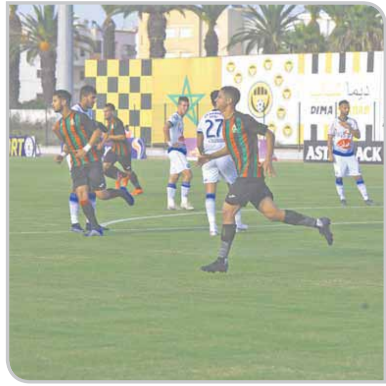
جمهور الجيش الملكي ينتظر تحقيق الإنجازات