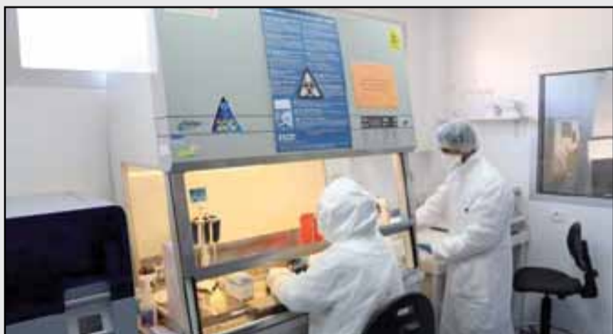
أكدت «الحرب» ضد كورونا استعجالية دعم تخصص الوبائيات الميدانية للاستجابة لحاجيات البلاد

النظم الصحية في جميع أنحاء العالم للرصد المبكر والاستجابة السريعة للأوبئة على وجه الخصوص، وحالات الطوارئ الصحية العامة الأخرى بشكل عام». وفي السياق ذاته سجلت الجمعية أن جائحة