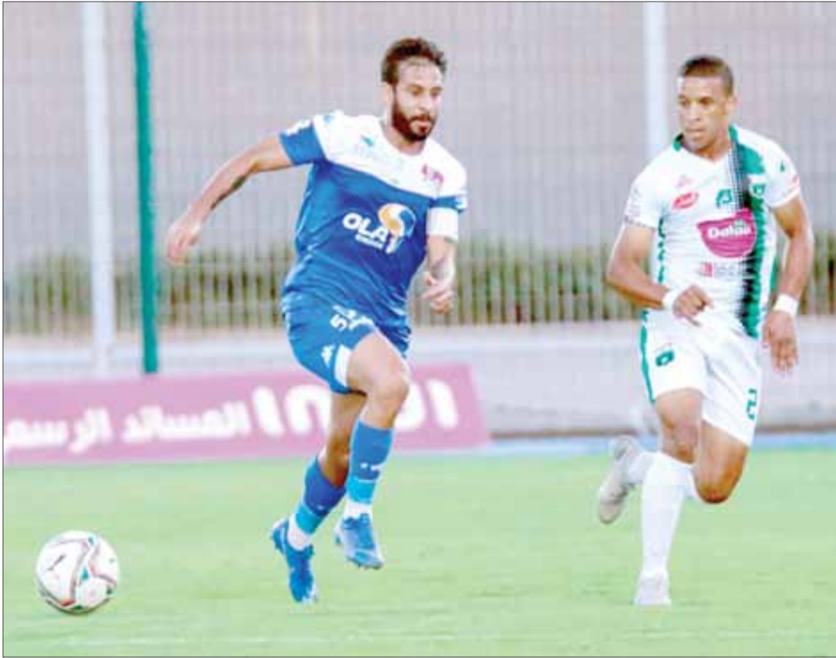
من لقاء الدورة الأولى بين اليوسفية والرجاء