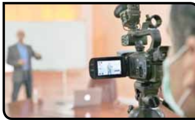
من الساعة 8 صباحاً إلى الساعة 6 مساءً، قناة الأمازيغية ستخصص لث دروس تهم المستوى التعليمي الثانوي الإعدادي من الساعة 8

بهدف الضغط على جهة معينة حتى تمول الكلفة لصالح جهة أخرى. ولذلك اتفقت مكونات التحالف الرباعي بناء على توقيع اتفاق شرف بين الكتابات والتنسيقات الجهوية لهذه الأحزاب الأربعة بجهة سوس ماسة على أن يكون التسيير جماعياً وتشاركياً للمجالس الجماعية والإقليمية والمجلس الجهوي، وسيكون التوزيع بناء على نتائج الانتخابات التي لحسن الحظ لم تمكن أي حزب من الهيمنة على عدد المقاعد إلا في بعض الجماعات التربوية القليلة كبلدية آيت إعره