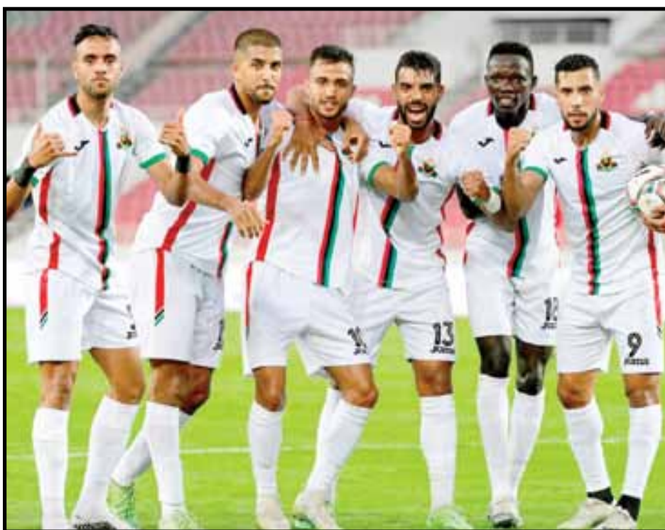
العسكريون يقتربون من العبور

وسيكون الجيش الملكي في حال عبوره على موعد فريق شبيبة القبائل، وهي المباراة التي تتطلب حسابات أخرى، خاصة وأن الفريق الجزائري له تجربة في الواجهة الإفريقية.