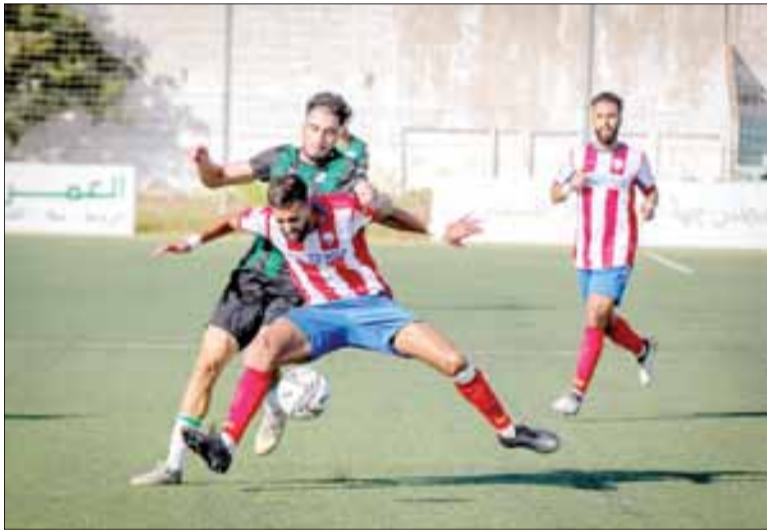
المغرب التطواني يخطئ الخروج