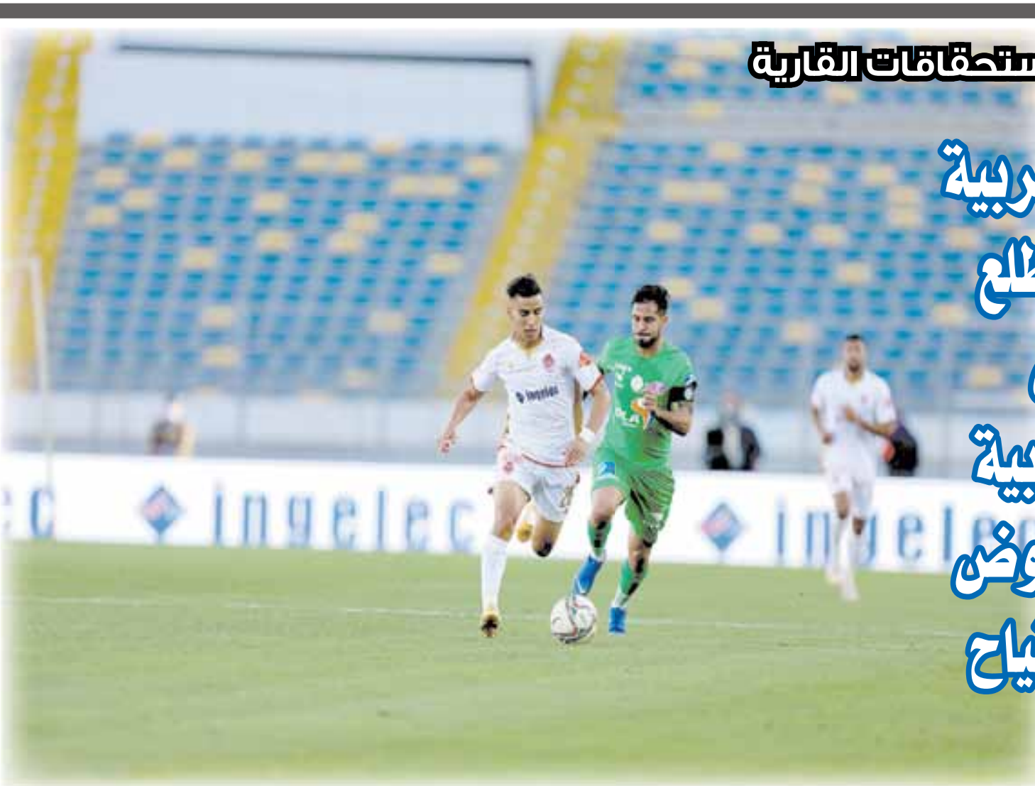
الرجاء والوداد مطالبان بتقليل هامش الخطأ لتأمين عبور سليم

علما بأنه سبق له أن توج باللقب القاري عامي 1992 و2017. وكانت بعثة الفريق البيضاوي قد حلت أمس الجمعة بالعاصمة أكرا، على متن طائرة خاصة، وفترتها إدارة الفريق لتفادي إرهاب اللاعبين، خاصة وأن منهم من شارك رفقة المنتخب الوطني الريف في مبارياته الإعدادية الأخيرة.