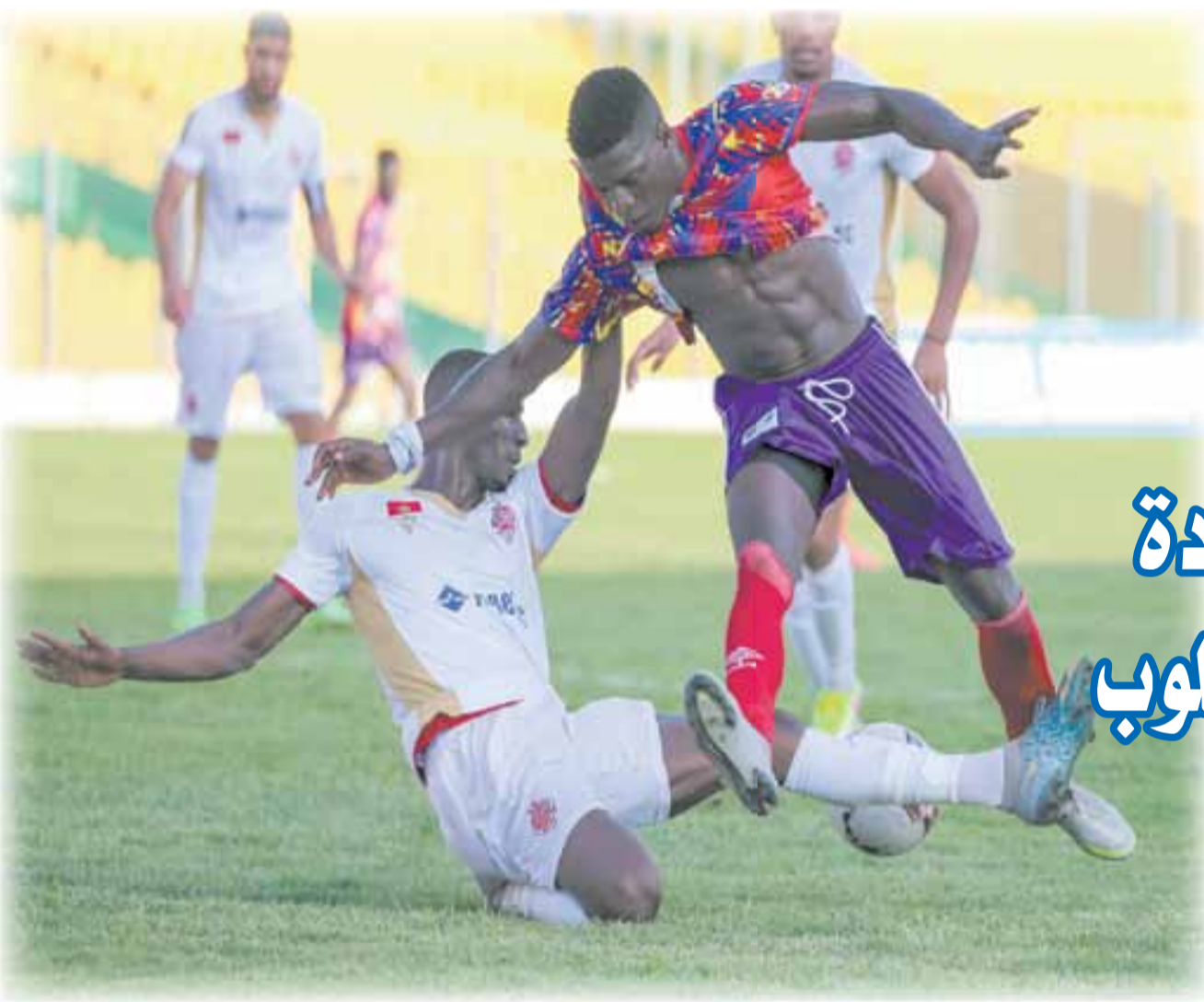
الوداد يتعثر باكرا