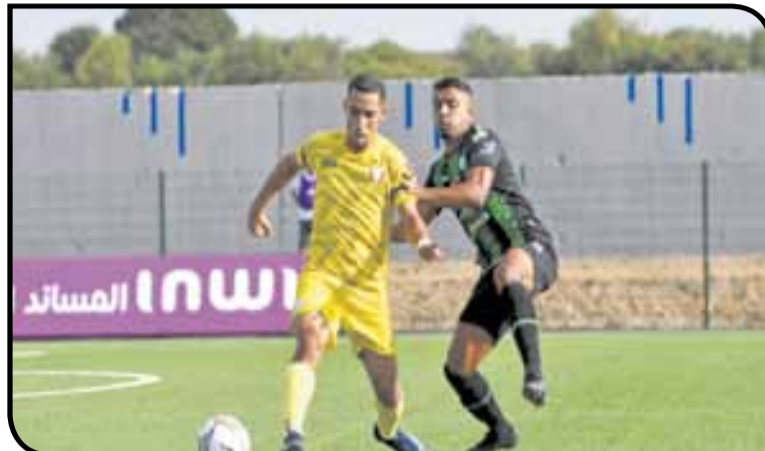
الفريق الحريزي يعثر أوراق الشباب