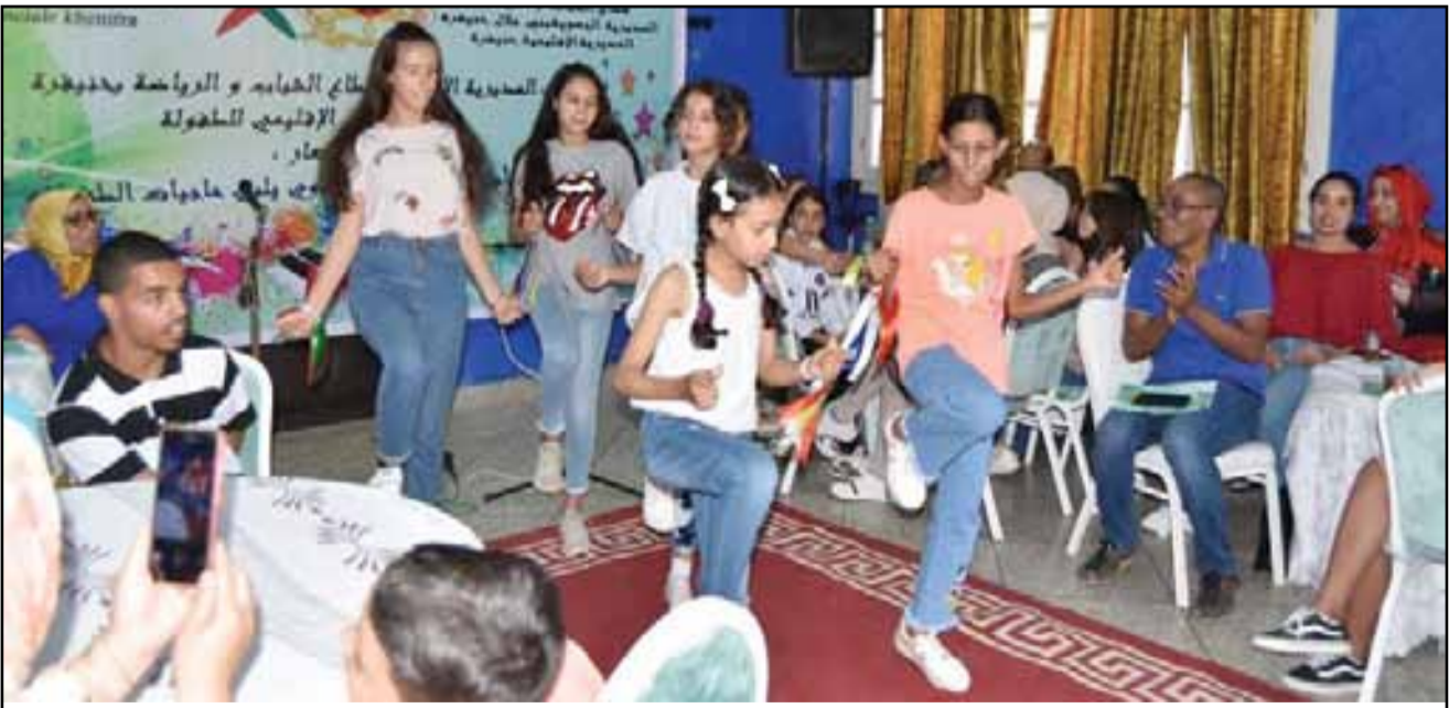
من فعاليات ملتقى الطفولة

المخيمات وأنشطتها تراوح بين الترفيه والتربية على قيم المواطنة والتعايش. من جهته أوضح المدير الإقليمي للشباب والرياضة محمد أحوزار «دور البرنامج التنشيطي في ضخ روح عالية من الحيوية والدينامية في دواليب دور الشباب، ومنحها عافيتها الثقافية والتربوية، وانفتاحها على الناشئة»، كاشفا عن عدد المستفيدين من مراحل برنامج «صيفيات 2021» على صعيد إقليم خنيفرة، والذي بلغ 2018 مستفيدا، مستفيدا،» ما يؤشر على تفاعل المعنيين بالأمر مع البرنامج، سواء حضريا أو قرويا، حيث كان للبرنامج وقعه الخاص على مستوى العالم القروي، مشيرا إلى «المراكز المخصصة لهذا البرنامج، وهي 4 مراكز بكل من كروش، آيت اسحاق، واومنة وأجلوس،