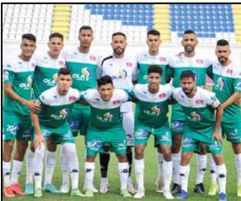
الرجاء يستفيد من درس الموسم الماضي