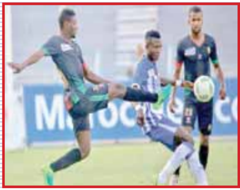
الجيش الملكي يأمل التعويض ببطنة

الثلاثاء اتحاد طنجة - الجيش الملكي (س 20.00) الأربعاء نهضة بركان - أولمبيك خريبكة (س 18.15) مولودية وجدة - الرجاء الرياضي (س 20.30) الخميس الوداد الرياضي - أولمبيك اسفي (س 20.30)