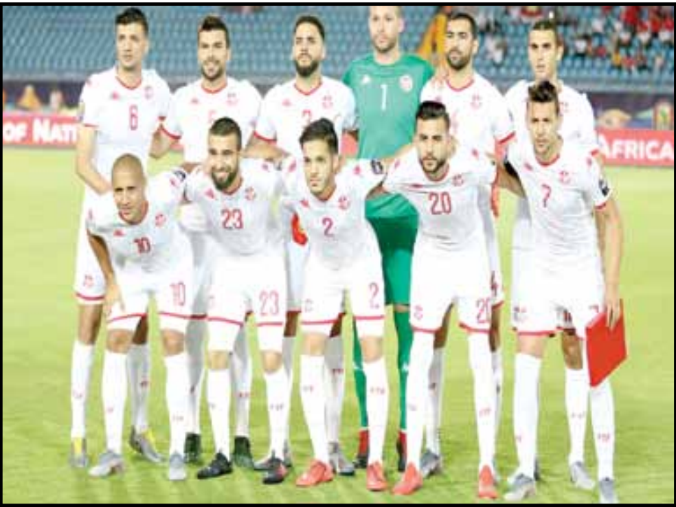
منتخب تونس توصل بتهديدات إرهابية

ولا شيء يؤكد أن الانفصاليين لن يحاولوا القيام بشيء في ياوندي أو دوالا، العاصمة الاقتصادية، حيث شنوا بالفعل هجمات صغيرة في الماضي. والجمعة، أشار الرئيس الكامبيروني بول بيا إلى «حالات استسلام عدة» ضمن الجماعات المسلحة، لكنه اضاف زيادة الهجمات بالعبوات النافسة وقتل المدنيين العزل». وفي مواجهة هذا التهديد، تصر الحكومة على أن «الامن سيكون مضمونا». وردا على سؤال لفرانس برس، لم ترغب السلطة ولا الاتحاد الإفريقي لكرة القدم («كاف») في تقديم تفاصيل عن النظام الأمني المخطط له. ففي العاصمة ياوندي، على بعد حوالي 250 كلم إلى شرق حدود المناطق الناطقة بالإنجليزية، كان الجو الاثنين أكثر استرخاء، ولم يشاهد سوى عدد قليل من رجال الأمن يراقبون آخر الاستعدادات في محيط الملعب الأولمبي الجديد، الذي بني لهذه البطولة وسيكون مقرا لمنتخب «الأسود غير المروضة». وتواجه الكامبيرون أيضا تهديدا آخر، في أقصى الشمال، مع هجمات لجهادي بوكو حرام التي تراجعت بشدة منذ مقتل زعيم التنظيم أبو بكر شيكاو في ماي الماضي. لكن في المقابل، عزز تنظيم الدولة الإسلامية في غرب إفريقيا سيطرته في منطقة بحيرة تشاد، ويقود توغلات متفرقة في الكامبيرون. وبالتالي، يمكن أن يستفيد التنظيمان من التأثير المفاجئ لكأس أمم إفريقيا في الأعمال التي من شأنها أن توهن النفسيات كما يخشى البعض في الشمال أو في ياوندي وبولا. ويقول مدير صحيفة «عين الساحل» النصف أسبوعية في شمال الكامبيرون غيباي غاتاما إن «لعب المنطقة الشمالية الذي سيستضيف المجموعة الرابعة (مصر وتيجيريا والسودان وغينيا بيساو) في غاروا، يقع على مسافة بعيدة جدا من محيط أنشطتهم»، على بعد أكثر من 300 كلم.