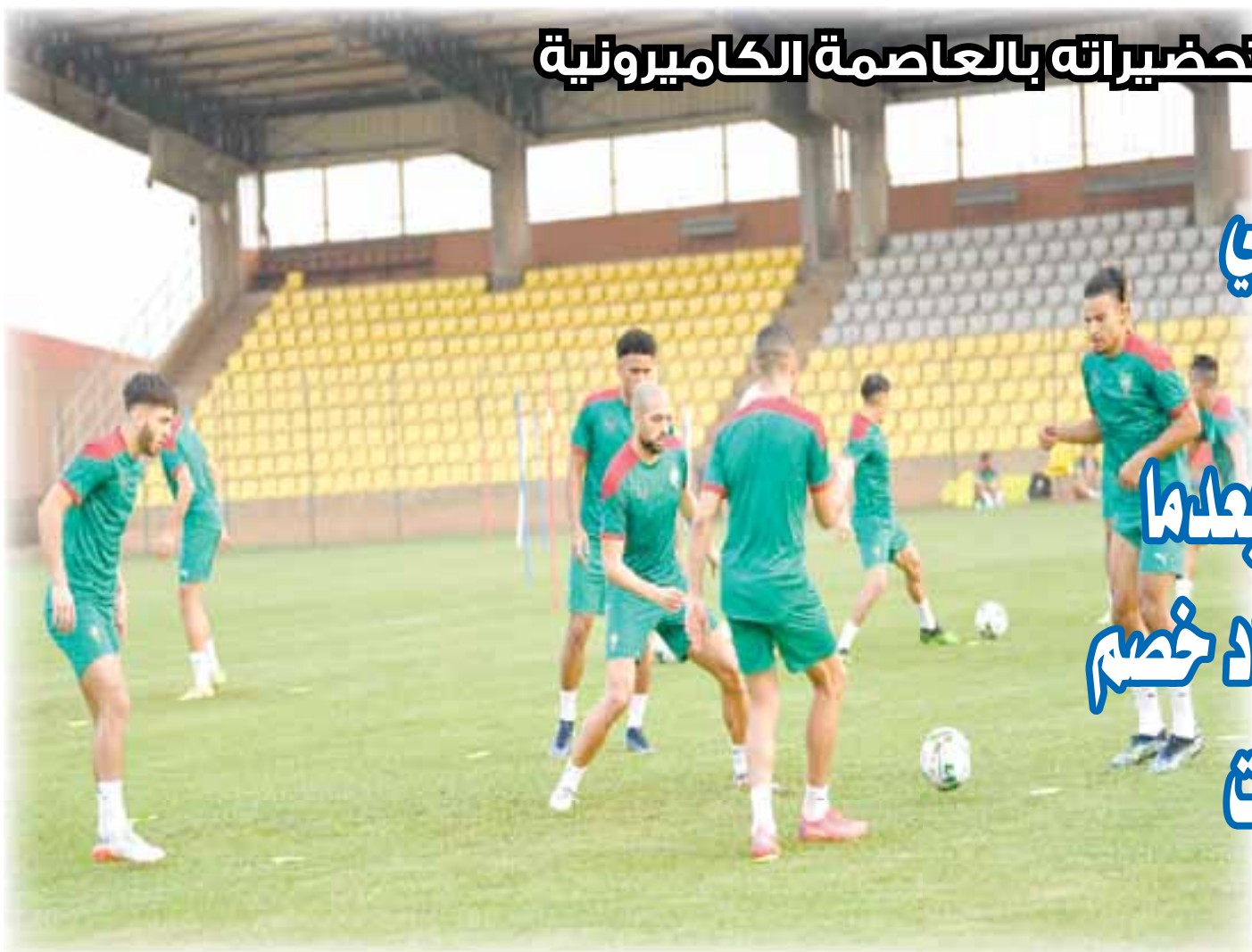
من الحصة التدريبية ليوم الثلاثاء

اصيب كل من النصيري ويدر بانون بالفيروس التاجي، قبل يستكما علاجهما ويلتحقان ببعثة المنتخب الوطني بياوندي.