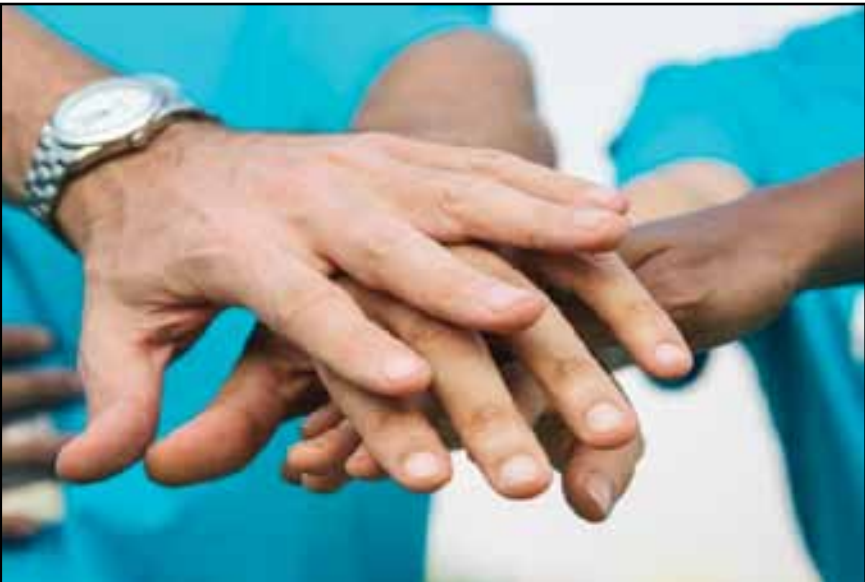
تجويد أداء الفعل الجماعي يحتاج إلى تنزيل مقاربة تشاركية ناجعة

بعيداً عن الولاء والمحابة - جعل الفضاءات العمومية رهن إشارة كل مكونات المجتمع المدني بعيدا عن الانتقائية والمزاجية - تاهيل مرافق المركز الثقافي بما يلزم ليكون صالحا للأنشطة الثقافية (المراحيض والقاعات وأجهزة الصوت والإنارة...) واعتماد برنامج شهري لأنشطة الجمعيات (يتم إعلانه) - الإسراع بفتح دار شباب جديدة بعد إغلاق دار الشباب أم الربيع - تنظيم العمل المشترك بين الاطارات الجمعوية - العمل على خلق أبنك المشاريع الثقافية والمعطيات والمعلومات والتشخيصات والمنجزات، والتعريف بها - العمل على خلق مناخ للتشبيك، من أجل التنسيق بين الاطارات الفاعلة لتنشيط الحياة الثقافية والفنية بالمنطقة - التفكير في آليات جديدة لاشتغال فيدرالية الجمعيات الثقافية بخنيفة - اعتماد المقاربة التشاركية وتجنب العمل الفردي في تقديم المشاريع - التفكير في تنظيم أسبوع ثقافي وسياحي للمدينة.