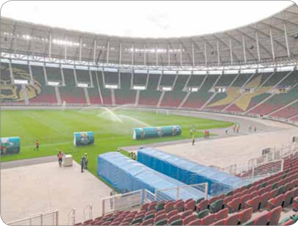
ملعب ياووندي يخضع لأخر التروشات قبل حفل الافتتاح