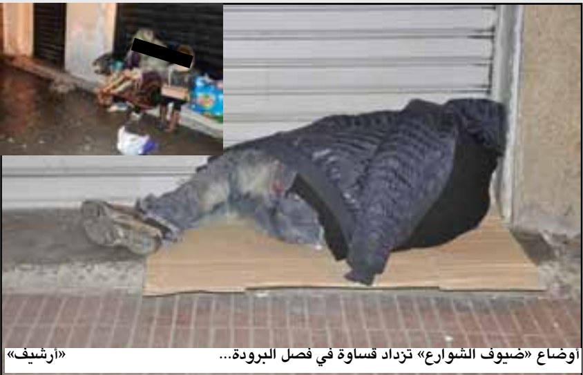
أوضاع «ضيوف الشوارع» تزداد قساوة في فصل البرودة...

تعرف بلادنا موجة برد شديدة القساوة، منذ أيام عديدة، يرافقها انتشار سريع للفيروسات التلغيفية، سواء تعلق الأمر بالأنفلونزا الموسمية أو متحورات كوفيد 19 من دلتا وأوميكرون وغيرهما، الأمر الذي يهدد صحة المواطنين ويعرضهم للإصابة بالعدوى، مع ما يعنيه ذلك من احتمال حدوث انتكاسة صحية، قد لا تقف عند حدود الأعراض البسيطة التي تتطلب الراحة بضعة أيام والانتقطاع عن العمل أو التدرس، بل قد ترسل الكثيرين إلى مصالح الإنعاش والعناية المركزة، لاسيما في ظل تشابه الأعراض المرضية المختلفة. ظرفية صعبة، يعاني منها بشكل كبير الأشخاص الذين بدون مأوى، الذين يفترشون الأرض ويلتحفون السماء، إذ في كل موسم شتاء يفارق الحياة عدد منهم، يتم العثور عليهم في هذا الركن أو الناصية عبارة عن جثث هامدة بعد أن غادرت أرواحهم أجسادهم المعتلة، لا سيما منهم الذين يستعينون بالكحول الحارقة وغيرها من المواد الضارة، لمحاولة انقاء قساوة الطقس، مما يعمق من أمراضهم ويزيدهم علا على علل. معاناة تتكرر كل سنة، تدفع بمصالح وزارة الداخلية، بتنسيق مع باقي الشركاء، إلى تنظيم حملات لجمع هذه الفئة من الشارع العام، وإيوائها بمراكز للاستقبال يتم تخصيصها لهذه الغاية، سعيا من المصالح المختصة لحمايتهم، إذ وجهت مؤخرا العديد من عمالات الأقاليم والمقاطعات في هذا الصدد، تعليمات لمسؤولي الإدارة الترابية محليا، لمباشرة هذه الحملات بشكل استباقي، والعمل على مصاحبة الفئات الهشة التي هي بدون مأوى، لنقلها إلى هذه المراكز، في حين لا يزال عدد كبير منهم،