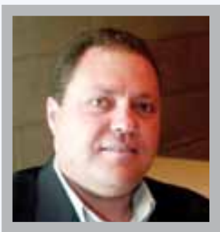
بقلم: سري القدوة

من شأن أي متتبع لطبيعة العمليات العسكرية الروسية في أوكرانيا أن يخلص باستنتاج طبيعي يؤكد أن تلك الحرب وما تنطوي عليه من خلفيات كانت ضرورية جدا لتأمين الأمن القومي الروسي، وهي وليدة لسلسلة من الأحداث الأمنية القصوى بالنسبة لروسيا، ومن الواضح أن العملية العسكرية كانت خيارا اضطراريا، والتي بدأت منذ 8 سنوات من الأزمة الموجودة بأوكرانيا بعد الانقلاب عام 2014، حيث كانت روسيا تحاول العمل على حل الأزمة بالحوار ومن خلال الاتفاقيات التي حدثت وأبرزها اتفاقية مينسك، ولكن لم تكن هناك استجابة في كيف لهذه الجهود دائما، حيث كانت هناك ماطلة وموضوع تهرب من الالتزامات، وكان هناك نهج قيادي في كيف في السنوات الماضية أدى إلى انفجار المسالة في الوقت الحالي .