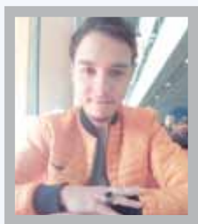
بقلم: عبدالرحمان رفيق

وفي سياق الامبالاة هذا، التي يترجمها البعض ب«عداء واضح» للمغرب، سمحت الجزائر لنفسها في غشت 2021 بقطع علاقاتها الدبلوماسية مع المغرب وتهديده عسكرياً، ولتكون، وبلا شك، كل هذه الأسباب مجتمعة، حجة قوية يدافع بها المغرب عن نفسه»، وتجعله يحدد موقفه الأسمى والدولي مستقبلاً حتى وإن كان يخالف رباح قرارات الأمم المتحدة.