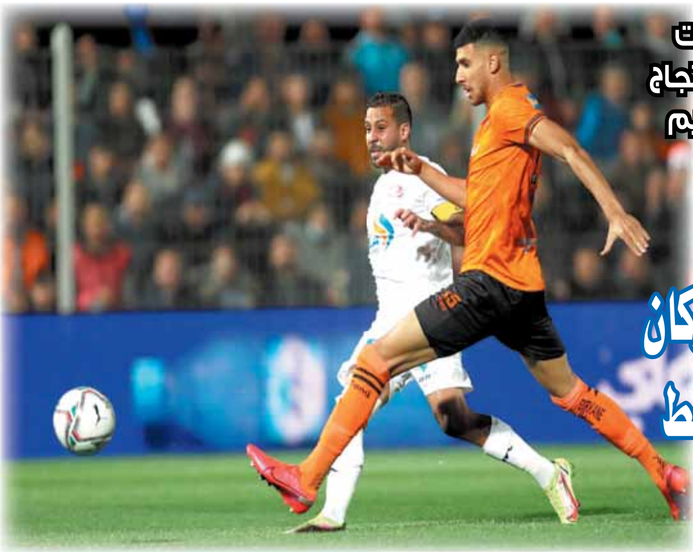
الرجاء يفلت من الكمين البركاني