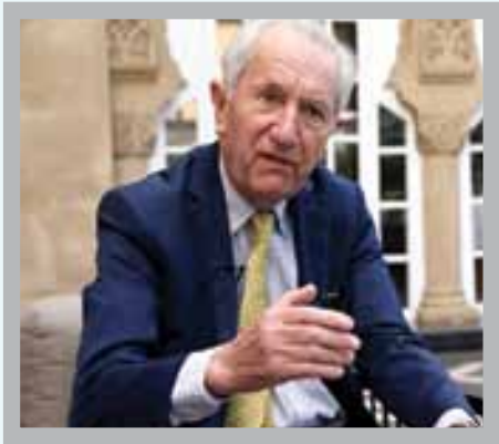
المحامي الفرنسي هوبرت سيلان