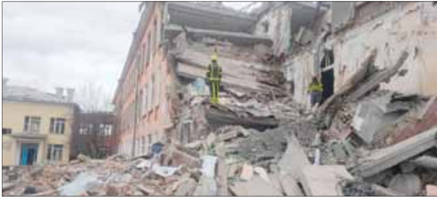
أن البلدين «بمعارضان إحياء عقلية الحرب الباردة وإثارة موجهاً إيديولوجية».