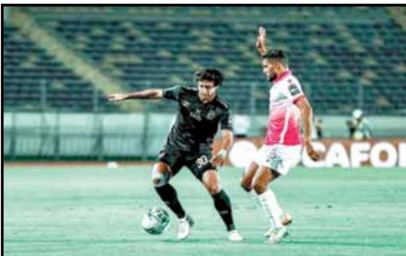
الوداد والأهل مرشحان بقوة لحضور النهائي