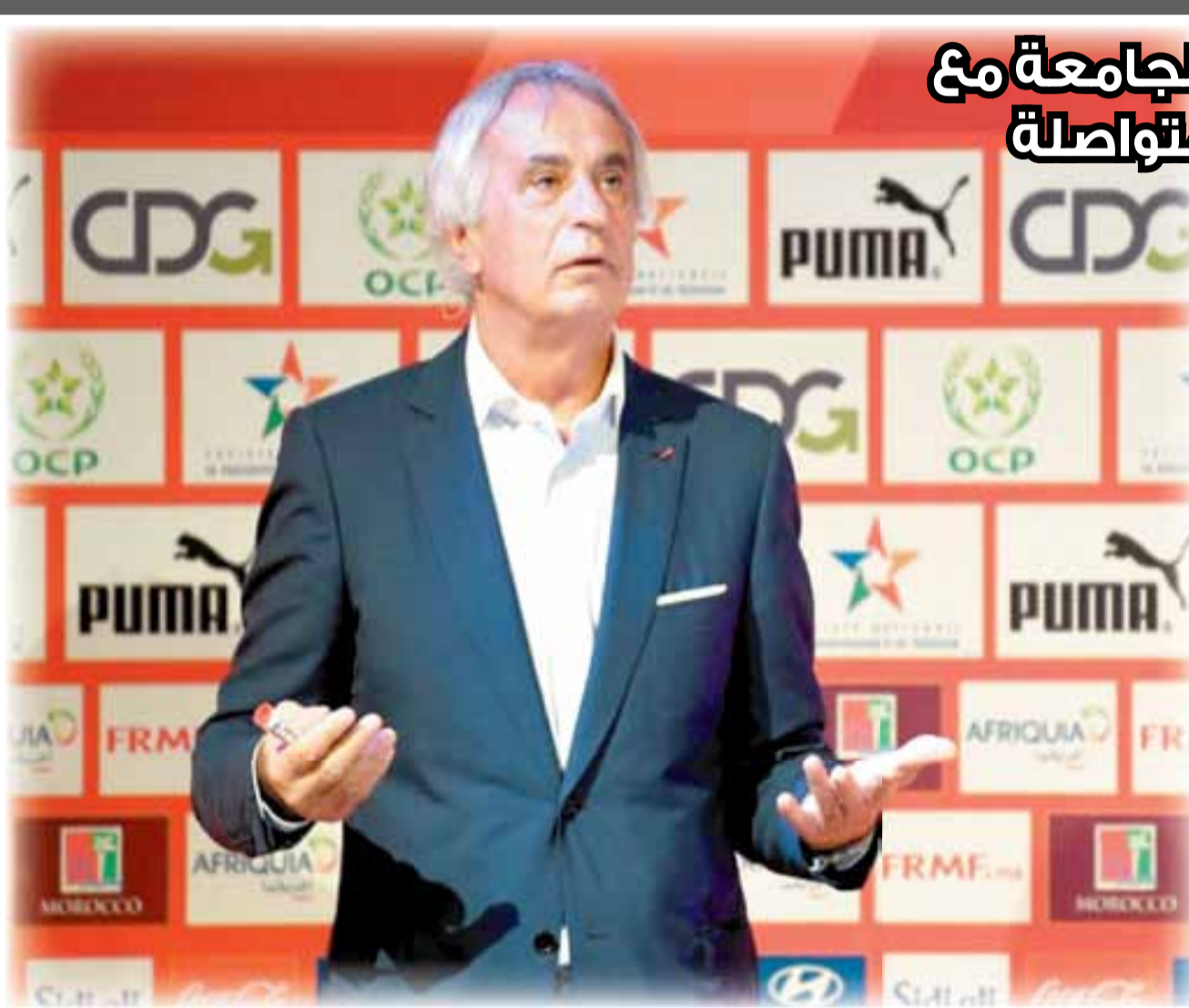
وحيد خاليلوزيتش «يتحدى» الجمع

صعوبة كبيرة في إيجاد صيغة لتك الارتباك وتساؤلات حول مصير قوة الناخب الوطني