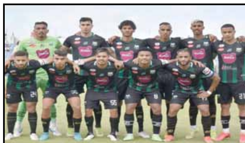
اليوسفية يؤدي ضربة أخطاء مسريه