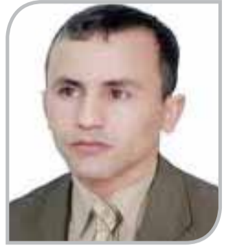
د. سعيد لبروزين

يرفض علي أحمد سعيد الملقب بادونيس (1930م) النمط التقليدي من النقد، وهذا ما دفعه إلى إعادة قراءة مراحل تطور الشعر العربي، قراءة جديدة على ضوء المعطيات النقدية الحديثة، وذلك من خلال ثلاثة مستويات، وهي: مستوى الرؤيا، ومستوى بنية التعبير، ومستوى اللغة الشعرية بشكل شمولي، وليس بفكرة من أفكار يجتزئها من نتاج الشعراء، لذلك يقوم مفهوم الشعرية عند أدونيس على مجموعة من المفاهيم التي تحدد ملامح شعرية، وهي: انفتاح النص، والغموض، والدهشة، والاختلاف، والرؤيا، والحركة، والزمن الشعري، وغيرها من المفاهيم الأخرى.