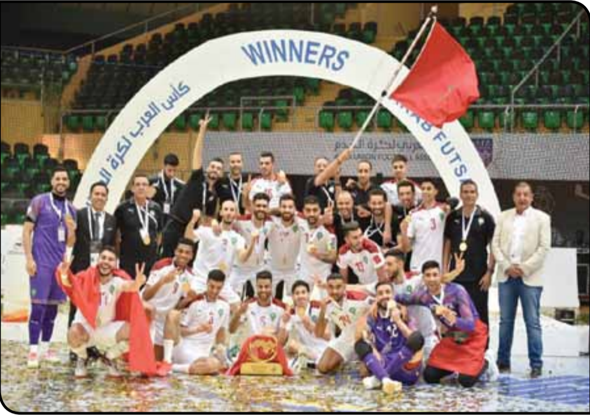
المنتخب الوطني يطوي صفحة التناقص العربي ويخطط لإهداف عالمية

عاد المنتخب الوطني المغربي لكرة القدم داخل القاعة إلى أرض الوطن، مساء الأربعاء، متوجا بلقب النسخة السادسة، والثاني له، من بطولة كأس العرب لكرة قدم داخل القاعة، الذي أحرزه يوم الثلاثاء في مدينة الدمام بالمملكة العربية السعودية على حساب نظيره العراقي بثلاثية نظيفة، ليرسخ بالتالي تربعه على كرسي الريادة إفريقيا وعربيا. وحظي المنتخب الوطني لكرة القدم داخل القاعة، لدى وصوله إلى مطار محمد الخامس الدولي بالدار البيضاء باستقبال من قبل بعض أعضاء الجامعة الملكية المغربية لكرة القدم.