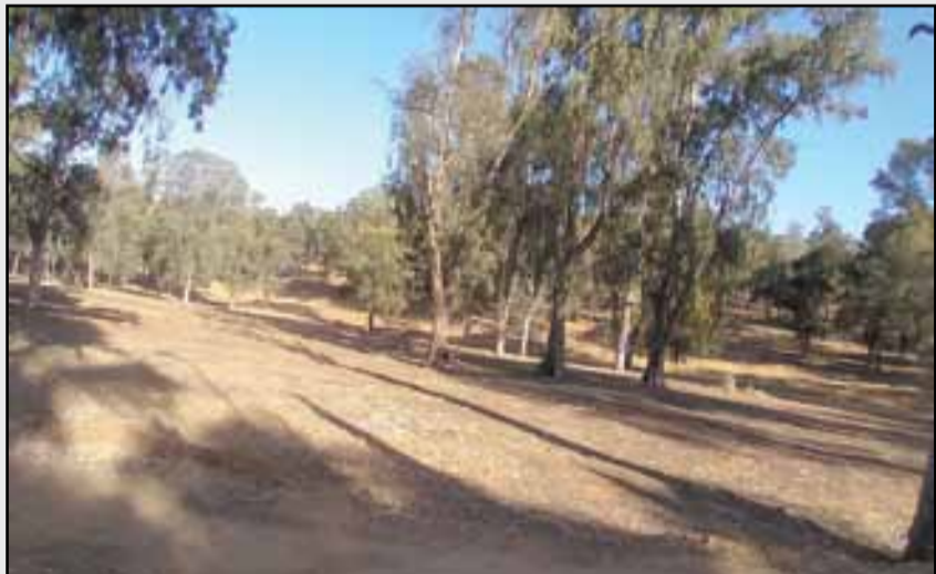
غابة المقاومة تحتاج لتهيئة شاملة باعتبارها فضاء إيكولوجيا مميزا

تجديد وإعادة ترميم غابة المعمورة، مشروع المحافظة وتأمين التنوع البيولوجي، مشروع الحفاظ وتأمين الموارد الوحشية والسكنية، تهيئة الغابات الحضرية والشبه حضرية». وتطرق العرض، أيضا، إلى «حصيلة المنجزات 2021، الإستثمارات، الإستغلال الغابوي، حصيلة موسم القنص»، وكذا «عدد حرائق الغابات، المساحات المحروقة، الإجراءات والتدابير المتخذة للوقاية ومكافحة الحرائق»، ثم «برنامج عمل سنة 2022، والذي يشمل مجموعة تدخلات»، «حصيلة الموروث الغابوي والتدبير التشاركي»، و«يتضمن مكافحة المخالفات الغابوية، الصعوبات والإكراهات، تنظيم ذوي الحقوق في إطار جمعيات رعوية، وتعاونيات غابوية أو مجموعات ذات النفع الاقتصادي».