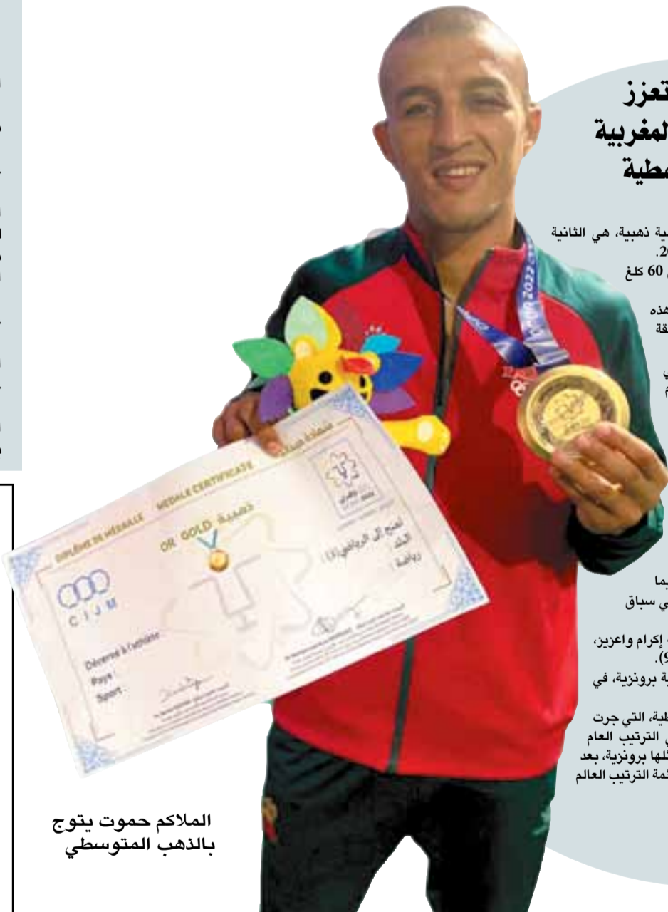
الملك حموت يتوج بالذهب المتوسطي