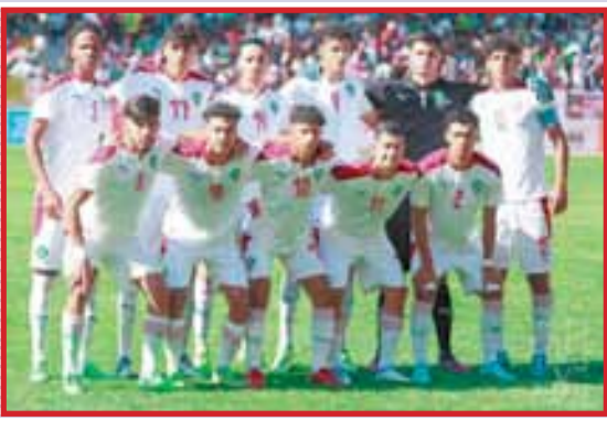
منتخب الشبان يبحث عن تكرار إنجاز الدورة الماضية