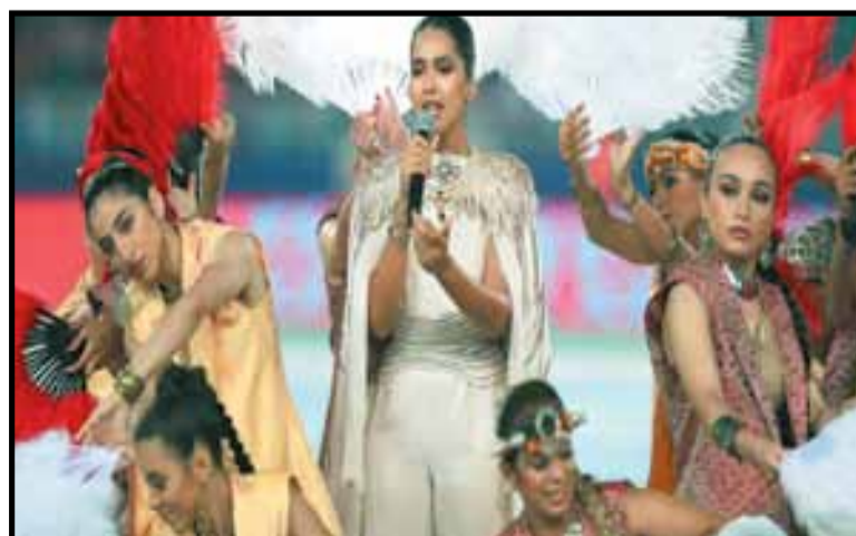
من حفل الافتتاح