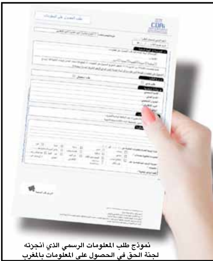
نموذج طلب المعلومات الرسمي الذي أنجزته لجنة الحق في الحصول على المعلومات بالمغرب

بالتالي، فإنه بالعودة إلى القانون رقم 31.13 المنظم للحق في الحصول على المعلومات بالمغرب (الصادر بالجريدة الرسمية عدد 6655، يوم 12 مارس 2018)، تجاوبا مع روح الفصل 27 من دستور 2011، فإنه يلزم مؤسسة دستورية مثل مجلس المنافسة، بصفتها مرفقا عموميا تسري عليه أحكام مواد الباب 12 من الدستور في كافة فصوله 17 (خاصة الفصل 166 منها)، بواجب تفعيل بنود هذا القانون، في كافة أبوابه السبعة ومواده 30، خاصة منها الباب الثالث المتعلق ب «تدابير النشر الاستباقي» في مواد 10 و 11 و 12 و 13، التي تقول بضرورة مبادرة كل مؤسسات المرفق العمومي بنشر المعلومات التي في حوزتها للعموم ضمن مجال تخصصها واشتغالها ما لم تتعارض مع مواد الباب الثاني من القانون المذكور المتعلقة ب «الاستثناءات من الحق في الحصول على المعلومات»، التي من ضمنها في ما يتعلق بمجلس المنافسة كل ما يرتبط بعدم الضرر بالسياسة النقدية أو الاقتصادية أو المالية للمغرب وبحقوق الملكية