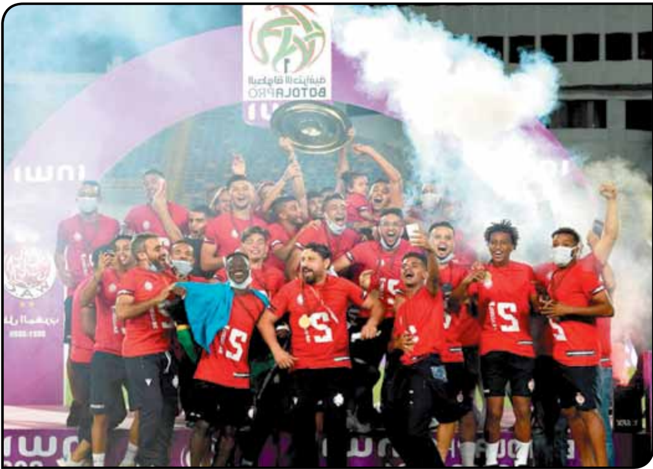
من مراسيم تتويج الفريق الأحمر بلقب الموسم الماضي