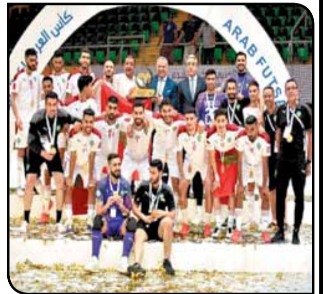
العناصر الوطنية مطالبة برفع سقف التحديات

لقبا جيدا «في مساره وإنجازا في تاريخهم الكروي، ووصف لقيح لاعبي واطر التقنية للمنتخب الوطني لكرة القدم داخل القاعة بالعائلة والنموذج الذي يجب أن يحتذى به، داعياً إياهم إلى مواصلة عملهم بكل جد وتفان، للحفاظ على المكتسبات والتطور أكثر، مشدداً على أن المنتخب الوطني لكرة القدم داخل القاعة، الذي وصل الآن إلى الرتبة التاسعة عالمياً، «غير سموح له بالعودة إلى الوراء»، مبرزا أن الجامعة ستوفر له جميع الإمكانيات المادية واللوجستية لتطوير مستواه أكثر. جدير ذكره أن المنتخب المغربي لكرة القدم داخل القاعة ارتقى إلى المركز التاسع عالمياً في الترتيب الذي أصدره، أول أمس الأربعاء، الموقع المتخصص في تصنيف منتخبات كرة القدم داخل القاعة، ويات رصيد المنتخب المغربي 1441 نقطة، علماً بأنه حل عاشرًا في التصنيف العالمي الصادر يوم السبت قبل الماضي.