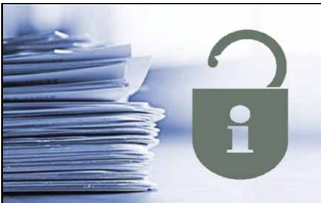
من الشعارات الدولية لرفع المنع عن حق تقديم المعلومات للعموم

مهم هنا التذكير على أن الفقرة الثانية من الفصل الأول من دستور