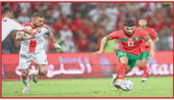
شاعر لن يكون متاحا في لقاء اليوم

ويستهل المنتخب الوطني المغربي مشواره في كأس العالم بمواجهة نظيره الكرواتي، يومه الأربعاء على أرضية ملعب «البيت» بالخور (الساعة 11 صباحا بالتوقيت المغربي). ويتواجد المنتخب المغربي في المجموعة السادسة إلى جانب كل من بلجيكا وكرواتيا وكندا.