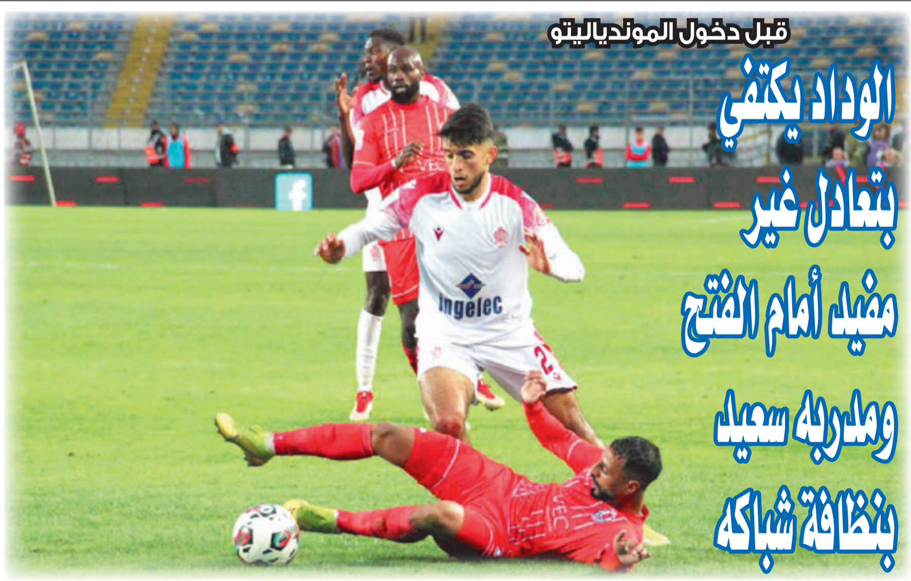
الوداد يكتفي بنقطة واحدة أمام جماهيره