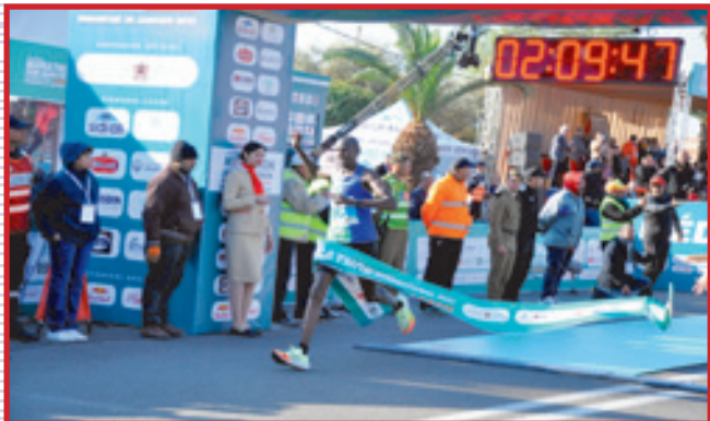
الكني كيببت جيلير يتفوق على الجميع