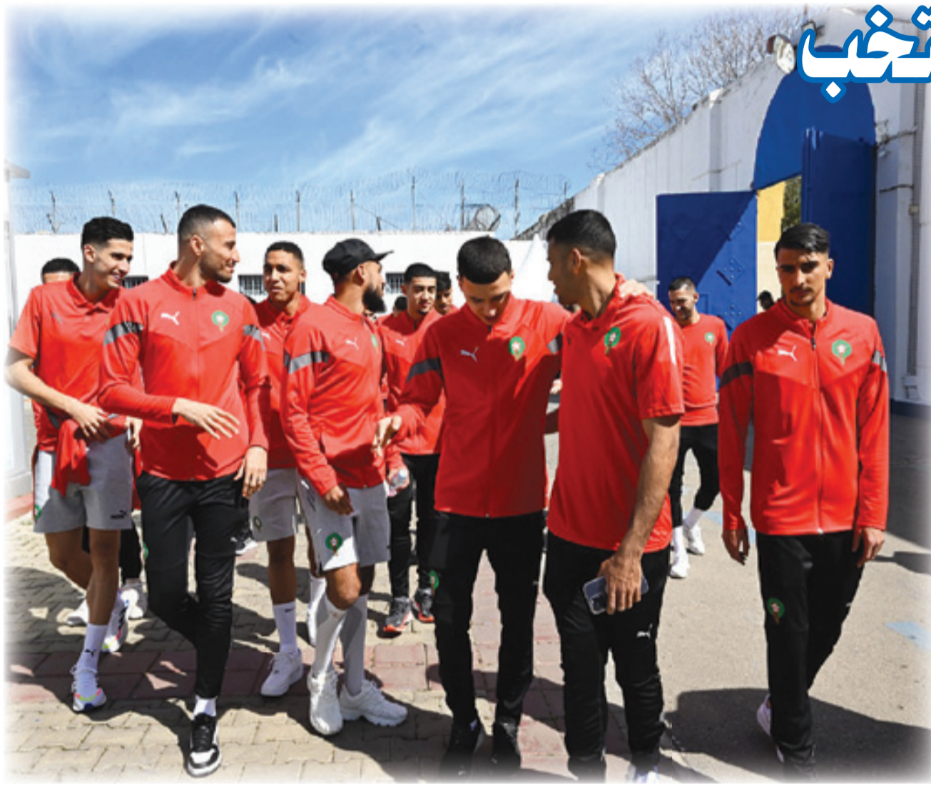
لاعبو المنتخب الوطني في جولة داخل سجن سلا