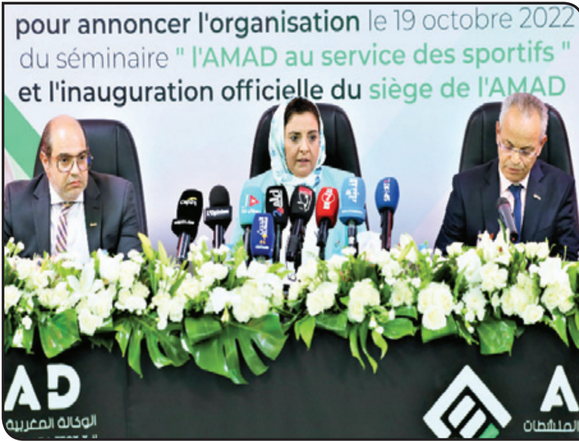
من أحد الأنشطة السابقة التي أطرتها رئيسة الوكالة الوطنية لمكافحة المنشطات

دعت الوكالة المغربية لمكافحة المنشطات، عقب اللقاء السنوي الثاني مع الجامعات الرياضية الوطنية، المنعقد أول أمس الثلاثاء ببولنجة، إلى وضع برامج تحسيسية وتوعوية لجعل الرياضي في قلب برنامج مكافحة هذه الأفة، والحد من العقوبات المترتبة على تعاطيها. وطالبت توصيات اللقاء بتطوير الشراكات بين الوكالة والجامعات الملكية المغربية وإطلاعها على البرامج الرياضية الوطنية والدولية وتحديثها بشكل منتظم بغية السماح للوكالة بوضع برامجها التحسيسية والتربوية، وكذا المراقبة الدورية. كما شددت على ضرورة دعم البرامج المدرسية لنشر الوعي بين المتدربين في سن مبكرة لممارسة رياضة نظيفة، والمشاركة في القافلة التي تدخل ضمن برامج الوكالة، وستهم عددا كبيرا من الرياضيين في مختلف مناطق المملكة. ومن جهة أخرى، ركزت التوصيات على أهمية توعية الرياضيين بمخاطر العلاج الذاتي وحققهم في المطالبة بإجراء فحص للكشف عن المواد المحظورة رياضيا والحث على تجنب استهلاك المكملات الغذائية. ودعت إلى حث الجامعات الملكية المغربية على المشاركة في الدراسات والبحوث العلمية، التي ترميها الوكالة المغربية لمكافحة المنشطات. وأكدت فاطمة أبو علي، رئيسة الوكالة المغربية لمكافحة المنشطات، في تصريح لوكالة المغرب العربي للأنباء، أن هذا اللقاء التواصلي السنوي، وهو الثاني مع الجامعات الرياضية الوطنية، يروم وضع تصور لبرنامج موحد و فرصة لإطلاع هذه الهيئات الوطنية على المستجدات التي تطرأ على مجال محاربة هذه الأفة، وحثها على الانخراط بجميع الآليات التي تتوفر عليها. كما يروم اللقاء، بحسب أبو علي، تحسيس بعض المسؤولين بالجامعات بأهمية بعض الإجراءات والتدابير التي