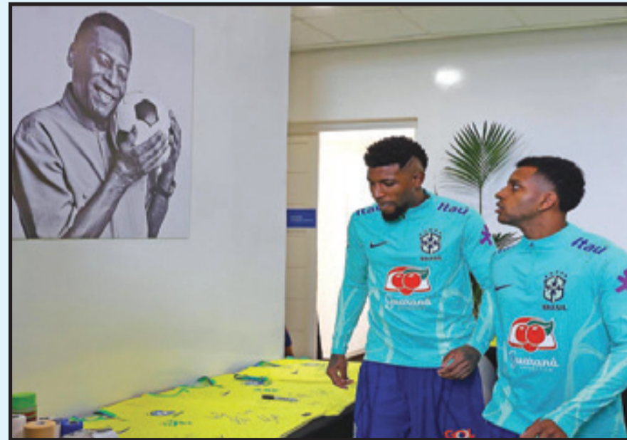
صورة بيلية تزين جدران مركب طنجة