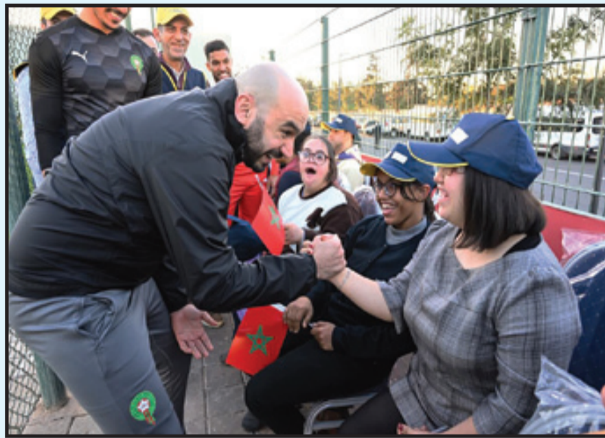
الركراكي في مشهد إنساني مع ذوي الهمم