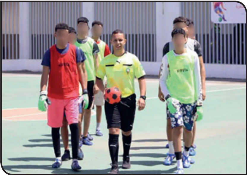
كرة القدم متنفس الأحداث في سجن العرجات2