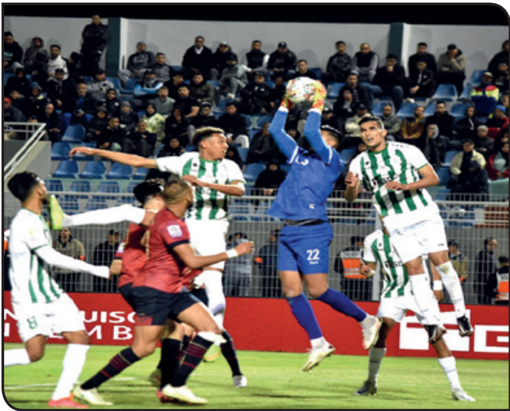
الدفاع الجديد يستمر في صنع الأصفار