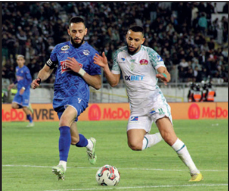
الرجاء يواصل إهدار النقط تصوير بحفيظ

ولم تتغير نتيجة المباراة في الشوط الثاني، رغم تسجيل تنافس حاد بين لاعبي الفريقين، حيث خلقوا عدة فرص سانحة للتهديف.