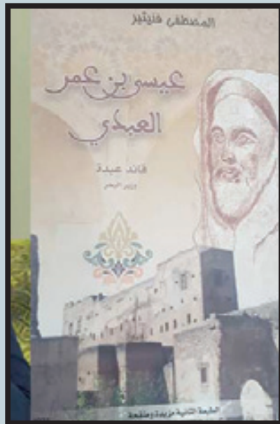
إعداد : محمد تامر