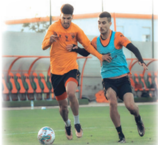
من تحضيرات الفريق البركاني لمواجهة الغد

مباراة الإياب إذا ما قرر نهضة بركان خوص اللقاء بقصص الخريطة. وكان الكاف قد طالب الاتحاد الجزائري لكرة القدم بالتدخل العاجل لدى السلطات الجزائرية من أجل تسليم الأقمصة لنهضة بركان أو خسارة المباراة بشكل رسمي، لكنه لم يمتثل للأمر، وعمد إلى التحايل من خلال توفير أقمصة مشوهة لا تتضمن خريطة المغرب واسم العلامة التجارية للشركة، التي يتعامل معها نهضة بركان بشأن المعدات الرياضية.