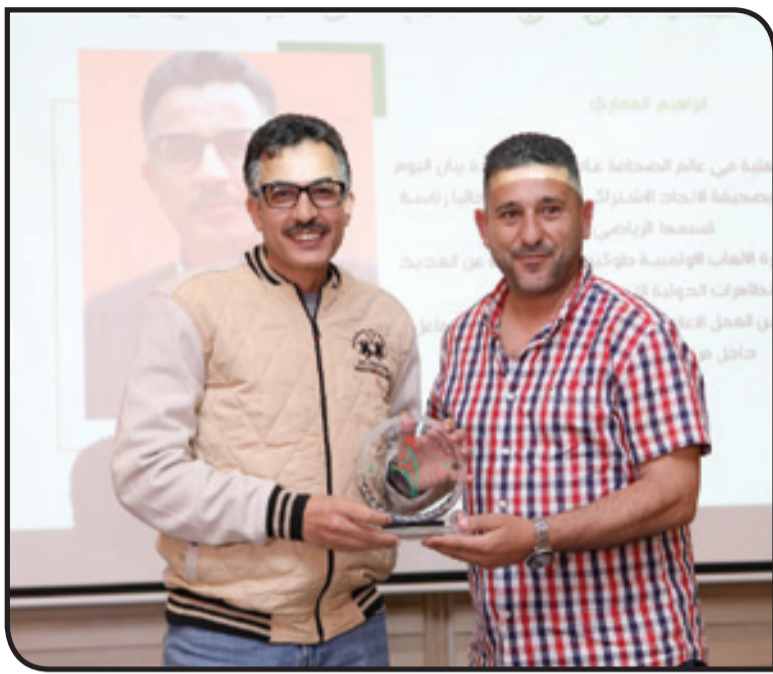
الرئيس العام للاتحاد الاشتراكي الرياضي محمد شوقي

واعتبرت الإعلام الرياضي الوطني على اختلاف مشاربه وأجناسه، شريكا ستراتيجيا لجامعة الرياضة للجميع، لحرصه دوما على إشراكه لمواكبة مختلف أنشطتها، سواء تعلق الأمر بالقوافل الوطنية أو الأيام الرياضية أو لدورات التكوينية أو الحملات التحسيسية، مساهمته بالتالي في تبليغ مفهوم الرياضة للجميع إلى كل بيت مغربي وإشاعة الثقافة لرياضة لدى مختلف شرائح المجتمع الفئات العمرية.