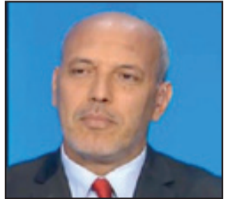
باريس يوسف لهلال

على المحيط الأطلسي. باريس بعد التردد والمشاكل السياسية والصعوبات التي تعرضت لها بالمنطقة، والاتجاه في الرؤية المغربية للتعاون الاقتصادي مع بلدان المنطقة والتي تحكمتها رؤية شراكة راجح رابع هي المقاربة الأفضل للجانبين ولباقي شركاء البلدين بالمنطقة. طبعاً إذا قمنا بتحليل الأرقام الاقتصادية والتجارية التي تتبادل بين البلدين سوف نرى أنها لم تتأثر كثيراً بالبرود الدبلوماسي الذي عاشته العلاقات بين البلدين، وهي أرقام تم تبادلها بمناسبة الزيارة الأخيرة لوزير التجارة الخارجية، ووصلت المبادلات بين باريس والرباط مستوى قياسي في 2023 بلغ 14 مليار يورو. وفرنسا هي أكبر مستثمر أجنبي في المغرب حيث تمثل غالبية الشركات المنضوية في سوق باريس للأشغال، كما أن المغرب هو أكبر مستثمر إفريقي في