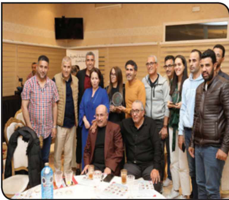
نجوم المنتخب الوطني سابقا في صورة جماعية مع بعض رجال الإعلام