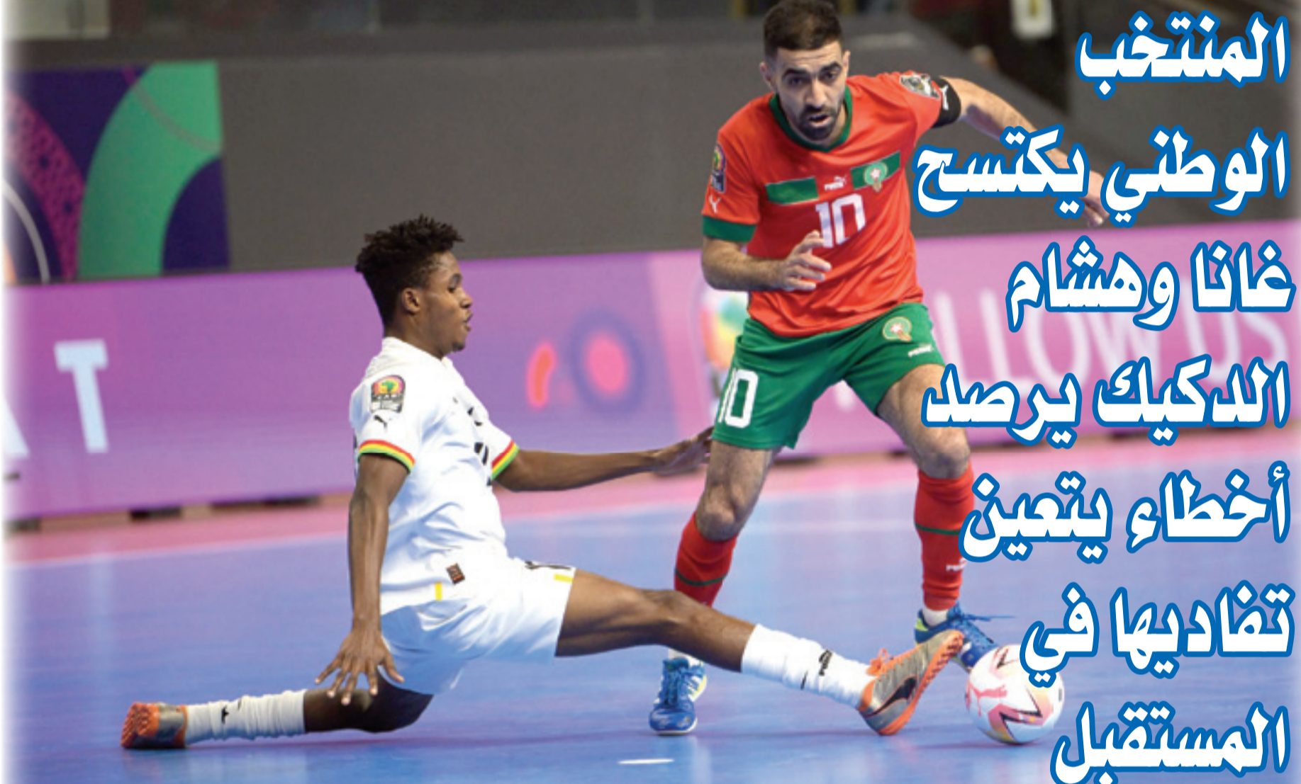
المسار ورفاقه يواصلون البحث عن لقبهم الثالث على التوالي

«واجهنا منافسا قويا مكتفيا في الدفاع، لكننا صححنا الوضع خلال مجريات الشوط الثاني». وبحسب المدرب الوطني، فإن «وضعنا كمرشحين للفوز باللقب يقتضي منا اللعب بشكل جيد ضد فرق تلعب ضدنا بحماس كبير»، مؤكدا «أننا نسعى للحفاظ على مستوانا لإسعاد المشجعين المغاربة، الذين لم ييخلو علينا بالتشجيع والدعم».