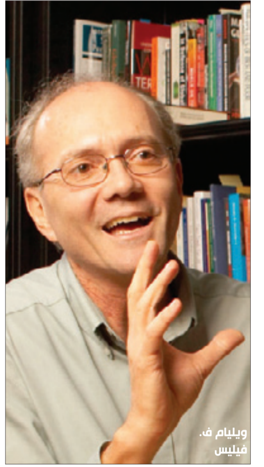
ويليام ف. فيليس

لا شك بأن الأولوية التي على المسؤول الحكومي أن يراعيها كممثل للمجتمع برتمته هي واجبه تجاه المصلحة القومية، فقيم أخلاقية مثل «التواضع» و «الصحافة» يمكن أن تساعد في حماية أمن الدولة ولكن لا يمكننا أن نقرز مقتضيات الوجود القومي من خلال مجهر التصنيف الأخلاقي ل «الخطأ» و«الصواب»، إذ تتطلب الإدارة الفعالة للدولة من المسؤولين أن يعملوا لحماية الجميع حتى ولو كان ذلك على حساب التضحية بالمبادئ الأخلاقية الفردية والجماعية، إذن فعلى المسؤول الحكومي أن يسعى وفوق كل شيء آخر على حماية مصالح المجتمع. بحسب ما أورده خبير العلاقات الدولية هانز مورغنثاو (1979: 13) فسوف تكون نتيجة ذلك «وجود فرق بين المبادئ الأخلاقية التي تنطبق على المواطن العادي في علاقاته مع المواطنين العاديين الآخرين وتلك التي تنطبق على الشخصيات العامة في تعاملها مع الشخصيات العامة الأخرى». فيبدو إذن أن الكثير من هؤلاء «الواقعيين السياسيين» و/أو «الواقعيين الأخلاقيين» يعتقدون التفرقة التي تقدم بها ميكافيلي في القيم الأخلاقية بين عالم الشؤون العامة وعالم الشؤون الخاصة.