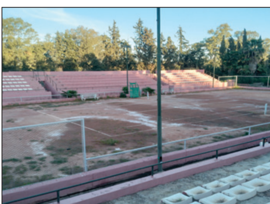
تنس الخميسات في حاجة إلى اهتمام أكبر