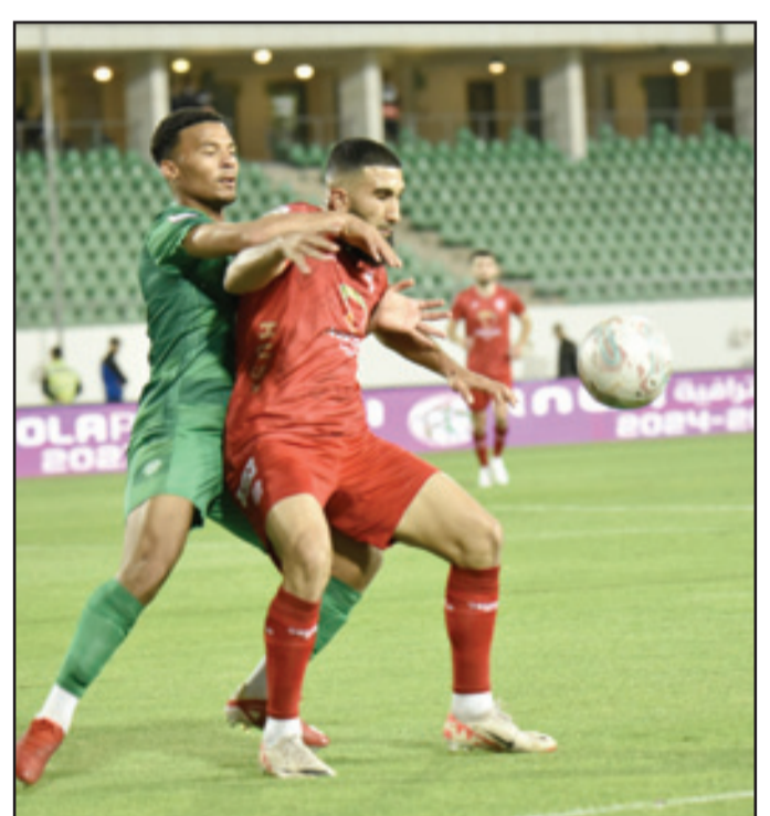
الفريق الأكاديري يكتفي بتعادل غير مفيد