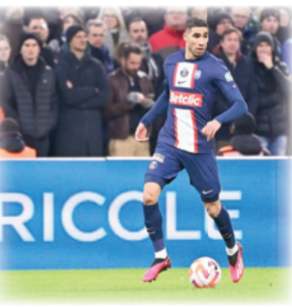
الفريق اللمبورغيسي يستعيد حكيمي أمام البارصا

وبعد الفوز في الذهاب، الذي اتبعه فريقه بانتصار خارج الديار أيضا لكن في الدوري على قاش 1 - 0، بتشكيلة رديفة إلى حد كبير، رأى تشافي أن برشلونة بات قادرا على منافسة الكبار مجددا و"نحن فخورون بالفريق".