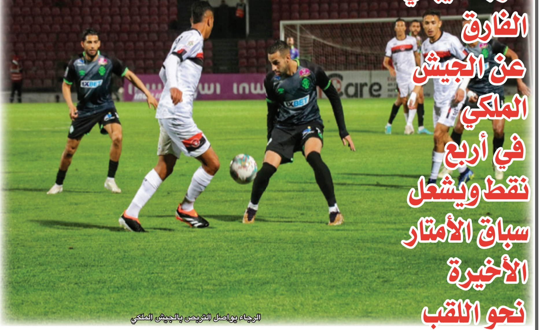
الرجاء يواصل التربعين بالجيش الملكي

الرجاء يقي الضارق عن الجيش الملكي في أربع نقاط ويشعل سباق الأمتار الأخيرة نحو اللقب