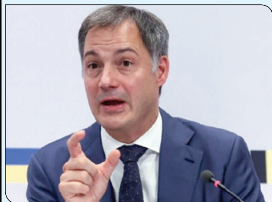
الكسندر دي كرو

ويرافق رئيس الوزراء البلجيكي خلال هذه الزيارة وفد هام يضم على الخصوص نائب رئيس الوزراء، وزير العدل، بول فان تيغشيلت، ووزيرة الداخلية، أنيليس فيرليندن، ووزيرة الشؤون الخارجية، حانج لحيب، وكاتبة الدولة لشؤون اللجوء والهجرة، نيكول دي مور، ورئيسة لجنة الإدارة بوزارة الشؤون الخارجية، ثيودورا غينتريس.