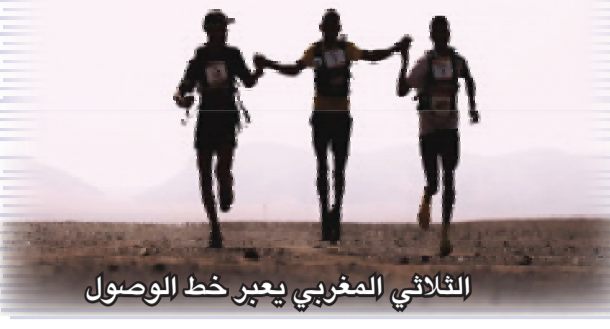
الثلاثي المغربي يعبر خط الوصول