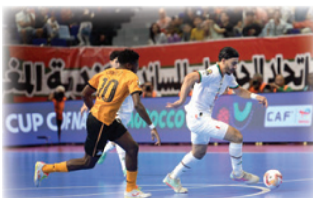
وقائع المصغرة بين المغرب وزامبيا