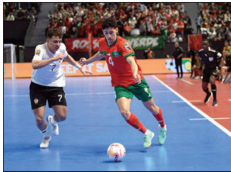
منتخب القاعة يفتح صفحة المونديال

يذكر أن الدورة 38 لماراطون الرمال، المنظمة تحت الرعاية السامية لجلالة الملك محمد السادس، عرفت مشاركة ما يناهز 900 عداء وعداءة من 58 دولة خاضوا مغامرة إنسانية ورياضية لاستكشاف حدود قدراتهم البدنية والذهنية.