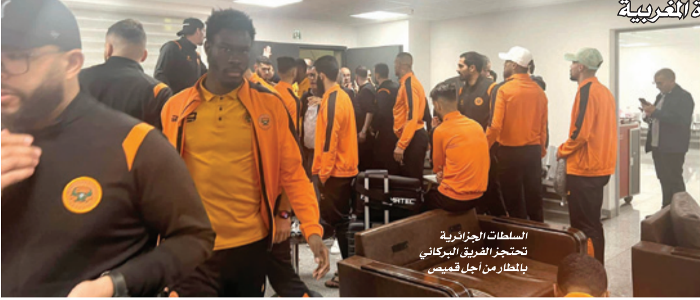
السلطات الجزائرية تحتجز الفريق البركاني بالمطار من أجل قميص

درأيت حالي (استعمال الاتصالات وحالي السيادة الجزائرية)