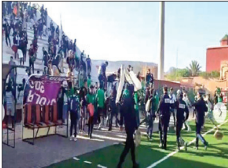
عن شجبه لما وصفه بـ «التصرفات المشينة» وقال المكتب المدير للنادي الجديد التي تسمى لسمعة كرة القدم الوطنية أيا كان إنه في «ليلة المباراة تعرضت حافلة النادي للتخريب وسرقة لوحة الترتيم المعدنية من مصدرا».

ولا تمت في مظهرها بأية بصلة للروح الرياضية وأخلاقها، سيما عقب فترة الاستراحة بين شوطي المباراة، التي استغرقت ما يقارب نصف ساعة، ما نجم عنه تاخر انطلاق الشوط الثاني بحوالي 20 دقيقة.