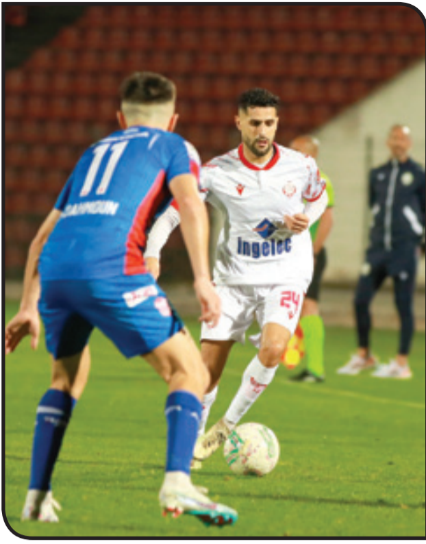
الوداد يحمو آثار الهزيمة أمام الجيش الملكي

على الأقل، لإنخراج الفريق من المنطقة المكهربة، لكن التسرع وعدم التركيز وكذا براعة الحارس الودادي المطيع حالتا دون ذلك. واستمر الفريقان خلال هذا الشوط في تبادل الهجمات، دون أن تتغير النتيجة لينتهي اللقاء بفوزي وادي، رفع به رصيده إلى 40 نقطة يحتل بها المركز الرابع، بينما تجرد رصيد الحسنية في 27 نقطة والمركز 12.