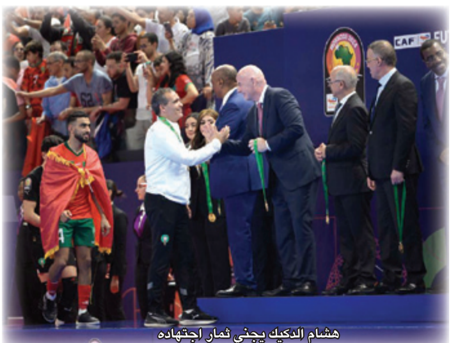
هشام الديك يحنى ثمار إحتفاده

قائلا «إننا كنا السابقين دائما لممارسة الضغط على منافسينا وأيضا بفضل عدد كبير من المعسكرات التدريبية والمقابلات الودية الدولية. تبقى الجهود المبذولة على مستوى المنتخب الوطني لكرة القدم داخل القاعة جسارة بهدف المحافظة على ريادتنا». وقال الديك «إننا جد راضين بهذا اللقب الثالث على التوالي والذي نهديه لجلالة الملك محمد السادس، الذي ينهج سياسة متبصرة في مجال الرياضة بشكل عام. اللاعب المغربي موهوب ويتوفر على بنيات تحتية من أعلى مستوى تخول له إظهار موهبته»، مسجلا «أننا رائدون في هذا الصنف الرياضي على المستوى الإفريقي والعربي ونلعب على المستوى الدولي، وهو ما يعتبر ثمرة سياسة حكيمه لجلالة الملك محمد السادس والتزام الجامعة الملكية المغربية لكرة القدم». ويرى الناخب الوطني أن «كرة القدم داخل القاعة تتمتع بسعة طيبة في العالم أجمع، وأصبحت لها شعبية على غرار كرة القدم»، مشيرا إلى أن النسخة الحالية من كأس إفريقيا لكرة القدم تشكل قاعدة للإعداد الجيد لكأس العالم. وفي تعليقه على المباراة النهائية، أشاد مدرب المنتخب الوطني بالمستوى الذي أظهره منتخب