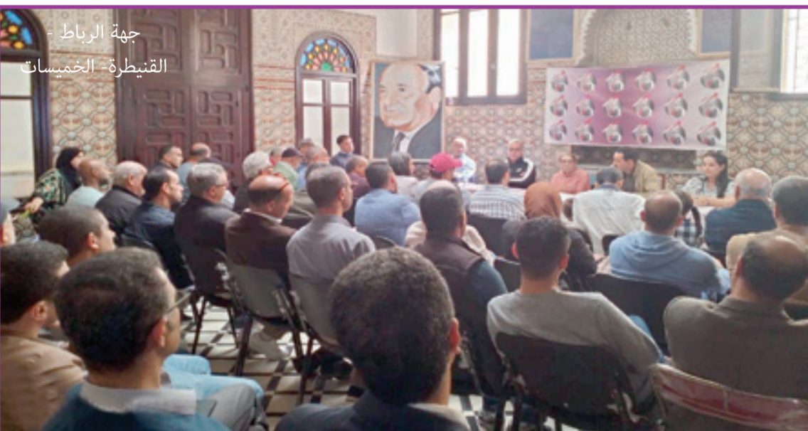
جهة الرباط - القنيطرة - الخميسات