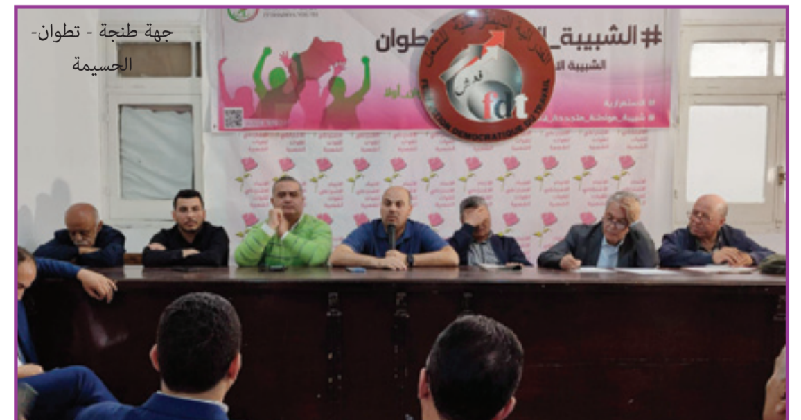
جهة طنجة - تطوان - الحصيمة