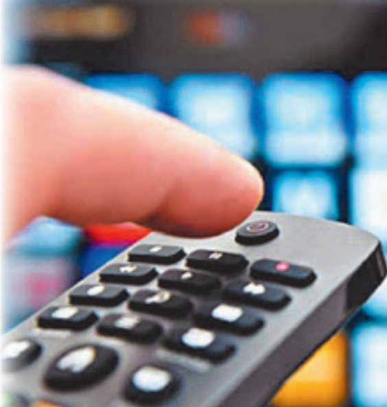
الإعلام الجزائري يقفن على أخلاقيات مهنة الصحافة

مهنة الصحافة، وبعيدة كل البعد عن كل أدوار الصحافة الرياضية وأهميتها البالغة في حياة المجتمعات، والتي من المفروض أن تكون لها مساهمات هامة في بناء راي عام واعي ومتحضر.