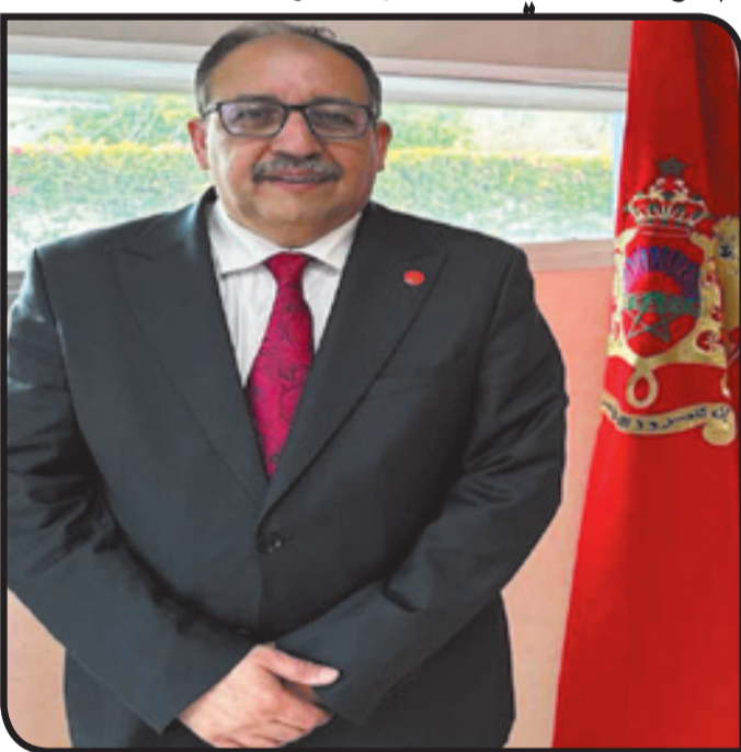
المغربية للعلوم الطبية بشراكة مع وزارة الصحة والحماية الاجتماعية والمرصد الوطني لحقوق الطفل والوكالة الوطنية للتأمين الصحي