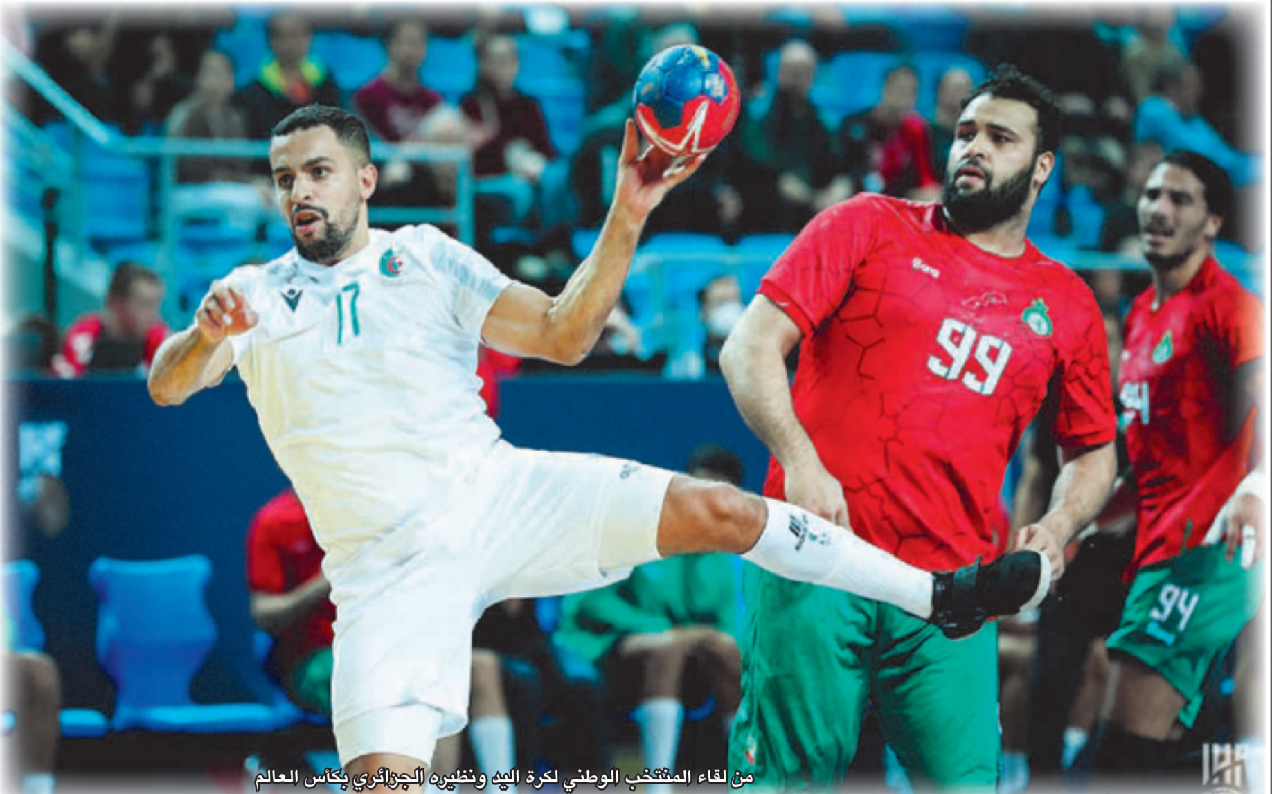
من لقاء المنتخب الوطني لكرة اليد وتظيره الجزائري بكأس العالم

واعتمادها رسميا للمشاركة في الاستحقاقات المقبلة. وحسب بلاغ للجامعة، فإن هذا القرار "يتماشى مع ما صنعه فريق نهضة بركان من موقف تاريخي عند التثبيت بالسيادة المغربية وبالاحقية في وضع الراية الوطنية معززة بالخريطة الوطنية الرسمية التي تشمل كل الأقاليم من طنجة إلى الكويرة"، مضيفا أنه تمت مكتاتة "الجهاز الدولي الوصي قصد اعتماد ذات الراية والخريطة في السنات الرياضية خلال التباري سواء بواسطة مصارعنا المؤهل إلى أولمبياد باريس 2024 أو بطولة إفريقيا 2025 أو البطولات والمنافسات 2024 - 2028. وقد توصلنا برد من الاتحاد الدولي، بقر بالمصادقة على اعتماد الراية والخريطة المغربية في السنات الرياضية كما هو معمول به في كل المنافسات وداخل القارات الخمس، وبذلك يصبح العمل بهاته الألبسة مستشهرة براءة الوطن ومعززة بالخريطة المغربية خلال المنافسات القادمة وأي تحرش من أي كان للمساس بهذا الاختيار السيادة، لن نرضخ له مهما تكن الضغوطات".