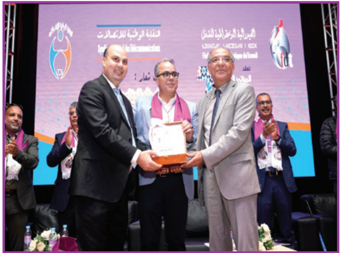
تكريم فاتحي الكاتب العام السابق للفيدرالية الديمقراطية للشغل