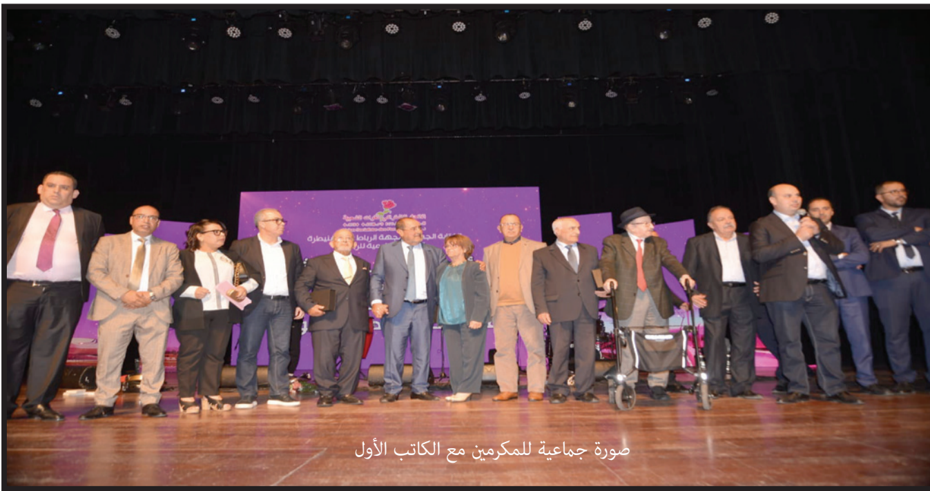
صورة جماعية للمكرمين مع الكاتب الأول

ومن جهته، وجه السفير الفلسطيني جمال الشوبكي التحية للمملكة المغربية ملكاً وحكومة وشعباً، على الدعم المادي والمعنوي والتضامن اللامشروط الذي ما فتئت تقدمه المملكة المغربية للشعب الفلسطيني، كما وجه تحية تقدير للمجهودات التي يقوم بها جلالة الملك بصفته رئيس لجنة القدس عبر كل المبادرات والمجهودات المبذولة في هذا الإطار إزاء الشعب الفلسطيني والقدس الشريف والمقدسين عبر كل الأنشطة والمبادرات التي تقوم بها وكالة بيت مال القدس.