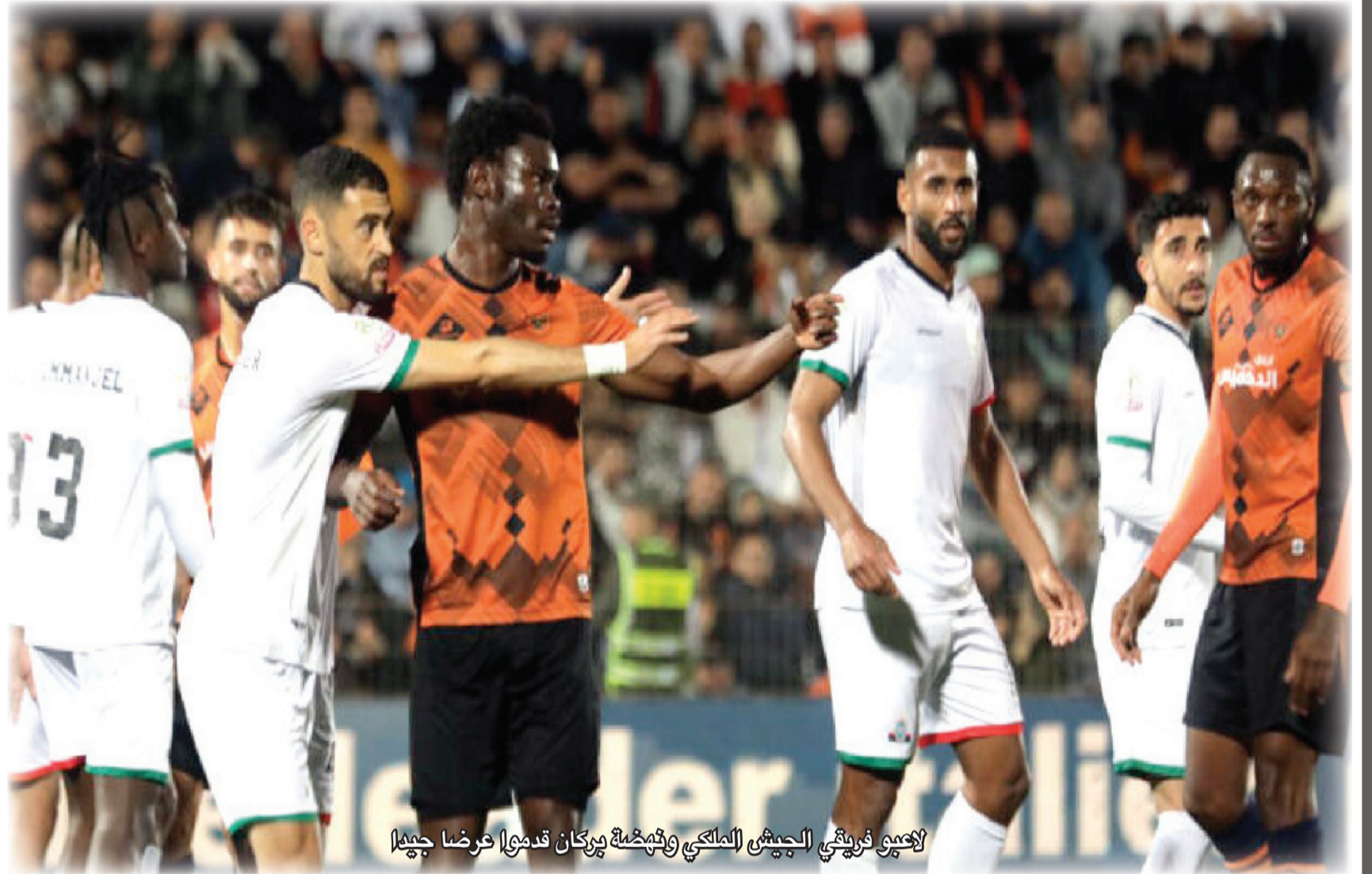
لاعبو فريق الجيش الملكي وهمضة بركان قدموا عرضا جيدا