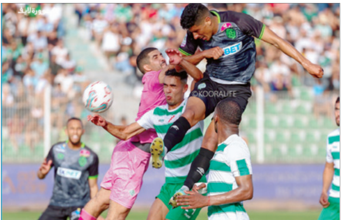
المولودية الوجدية ينحني لمصيره ويغادر البطولة الاحترافية الأولى