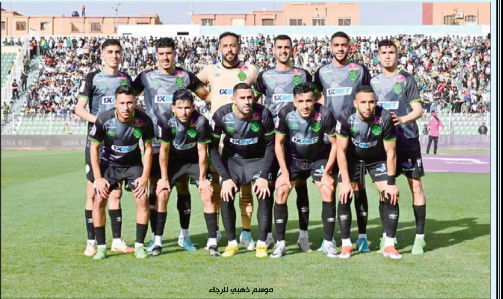
موسم ذهبي للرجاء

الرجاء يحرز اللقب والوداد لن يكون «إفريقيا» الموسم المقبل