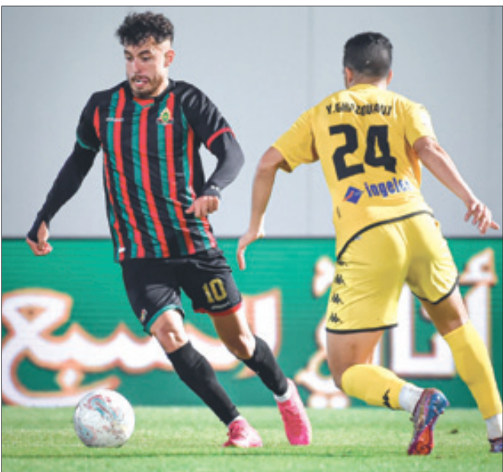
من لقاء الدوري بين الجيش الملكي والماص