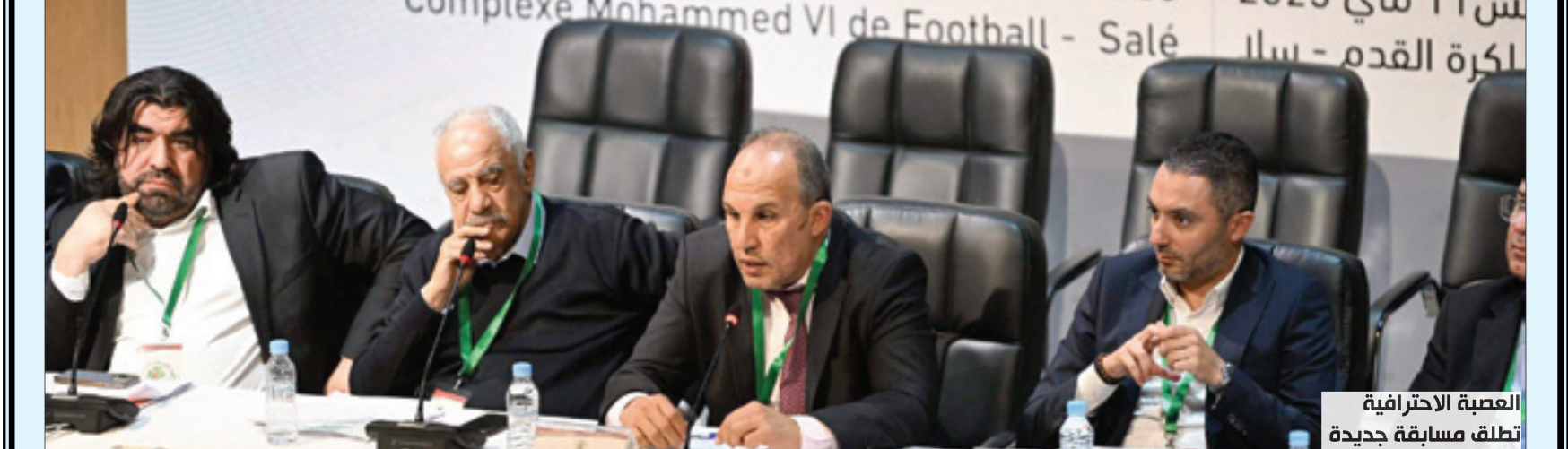
العصبة الاحترافية تطلق مسابقة جديدة