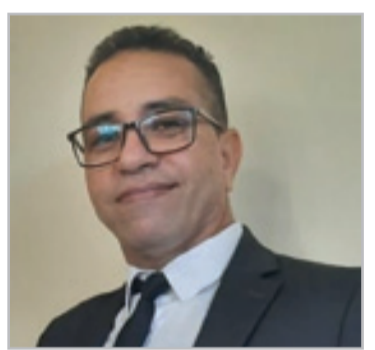
نص شعري ل غيوم بوا ترجمة: محمد العربي

بعد ذلك اختار الكاتب أن يوطئ للكاتب بمدخل عام ناقش فيه كيفية ظهور جنس أدبي إلى الوجود، قائلًا بأن الأنواع الأدبية لا تظهر بالصدفة، وإنما تنتج عن تحولات جنس أدبي آخر تنسج عنه، بسبب شروط تاريخية واجتماعية واقتصادية تلعب دورا محوريا في ولادته ونشأته باعتبار أن المحدد