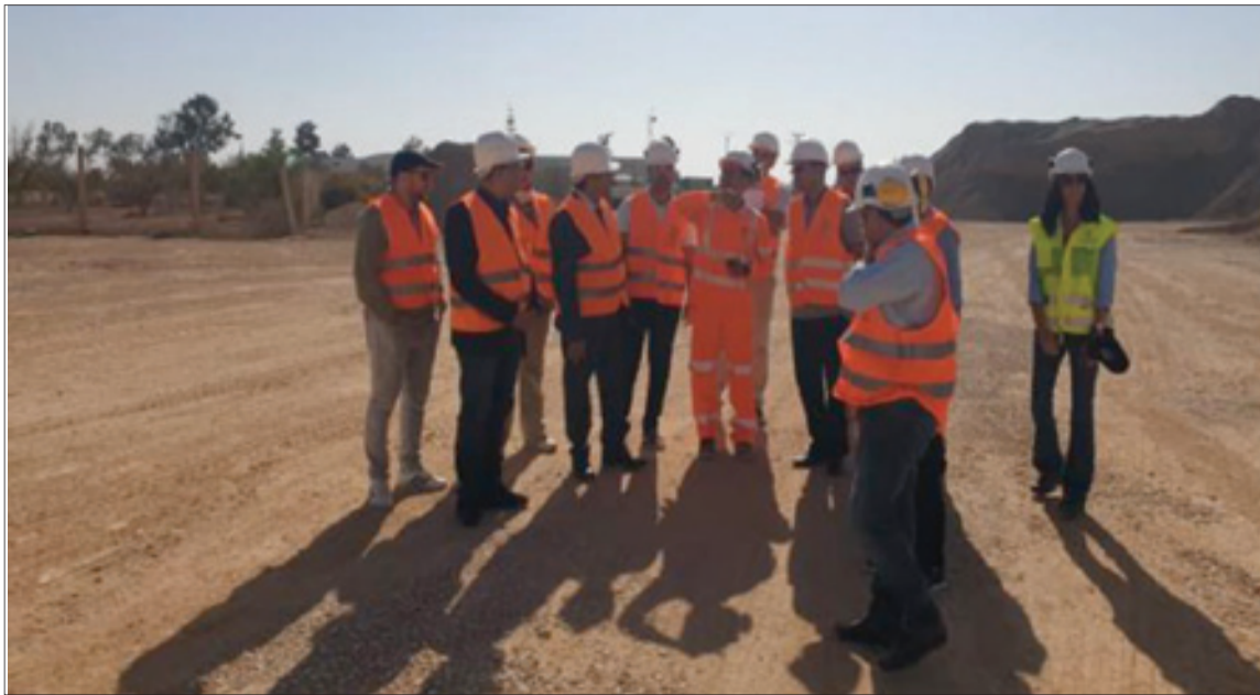
اللجنة الاستطلاعية التي ترأسها النائب الاتحادي سعيد يعزيرز أثناء زيارتها لأحد المقاعد

أمام بخصوص مقالع الرمال فقد أوضحت اللجنة البرلمانية أن هذا المغرب يُعد من أكبر منتجي ومصدري الرخام في العالم حيث يتوفر على مقالع ضخمة من الرخام بالوان وخصائص مختلفة، في مناطق الريف والأطلس المتوسط والأطلس الكبير. غير أن تطور هذا القطاع في المغرب تعزيره عدة معوقات على رأسها هيمنة القطاع غير المهيكل والذي يمثل 50 في المائة من الفاعلين وضعف استغلال الموارد الطبيعية للبلاد مع تهمين محلي ضعيف، لأن 89 في المائة من الفاعلين في القطاع عبارة عن مقاولات جد صغيرة لا يتجاوز رقم معاملاتهما 10 ملايين درهم مما يحد من تطوير هذا القطاع.