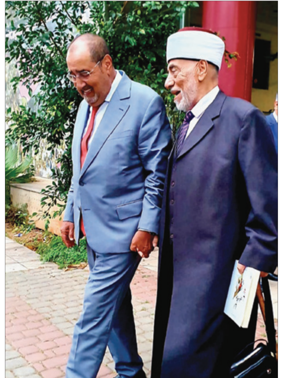
الكاتب الأول رفقة خطيب المسجد الأقصى المبارك