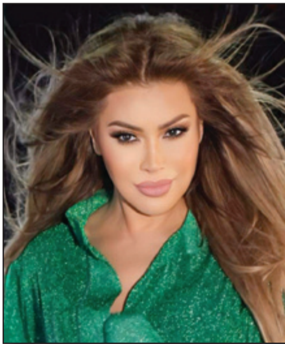
الفقرة الثانية من الحفل، عدداً من الأغاني التي اشتهرت بها وتفاعل معها الجمهور بالحفاضة ذاتها، حيث أدت "عينيك

وعلى غرار الدورات السابقة، تقدم الدورة 19 لمهرجان موازين-إيقاعات العالم (21-29 يونيو)، المنظم بمبادرة من جمعية مغرب الثقافات تحت الرعاية السامية لصاحب الجلالة الملك محمد السادس، برنامجاً غنياً يضم نجومًا