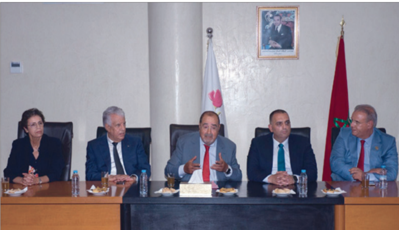
محمد سالم الشراقوي، وزير شؤون القدس، الأخ إدريس لشكر، السفير الفلسطيني والأخت فتيحة سداس

«شخصيا أشعر بثقل أي قرار تتخذه القيادة الفلسطينية، وما يرافقه من حوار وتفكير، الشيء الذي يجعلنا نحن كإسار نقدر الأشياء تقديرا مختلفا، أي على نحو أكثر واقعية»