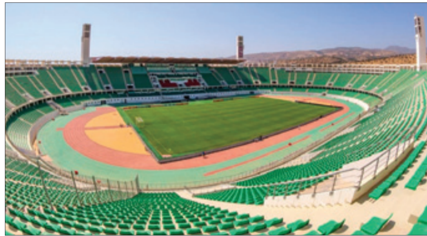
منظر عام لملعب أدرار

أوسع نطاق من طرف أبناء أكادير، الذين يعرفون جغرافية وتضاريس منطقتهم، فالملعب، الذي يعتبر من أحسن الملاعب الوطنية، والذي تم بناؤه بالمقاييس التي تبني بها المحطات النووية، باعتبار الطبيعة الزلزالية للمنطقة، وتم تشييده في منطقة