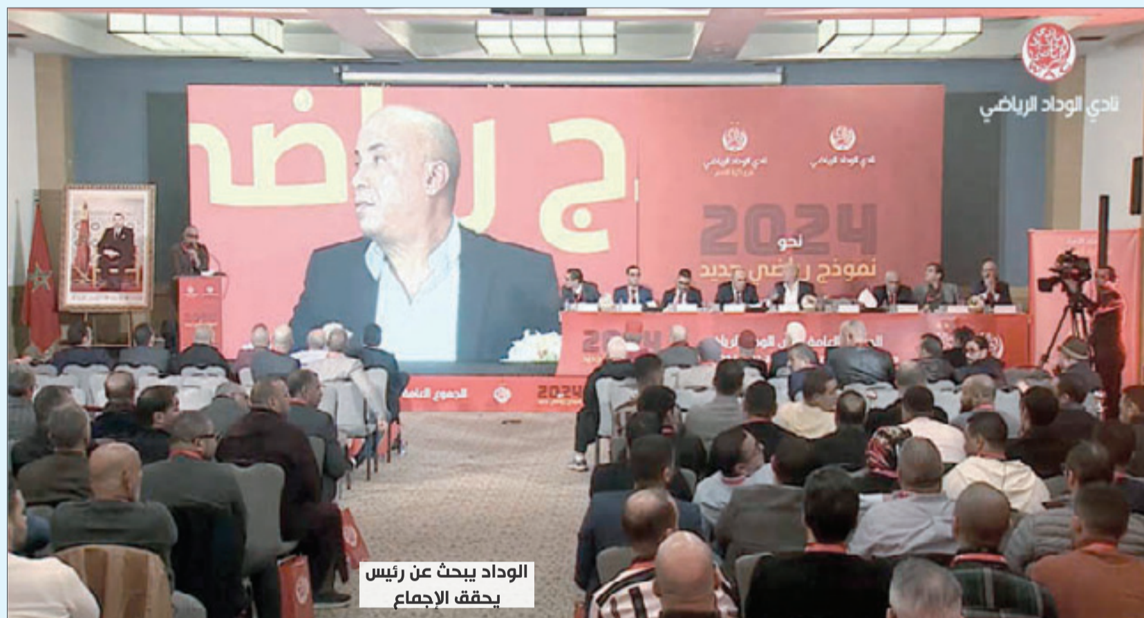
الوداد يبحث عن رئيس يحقق الإجماع