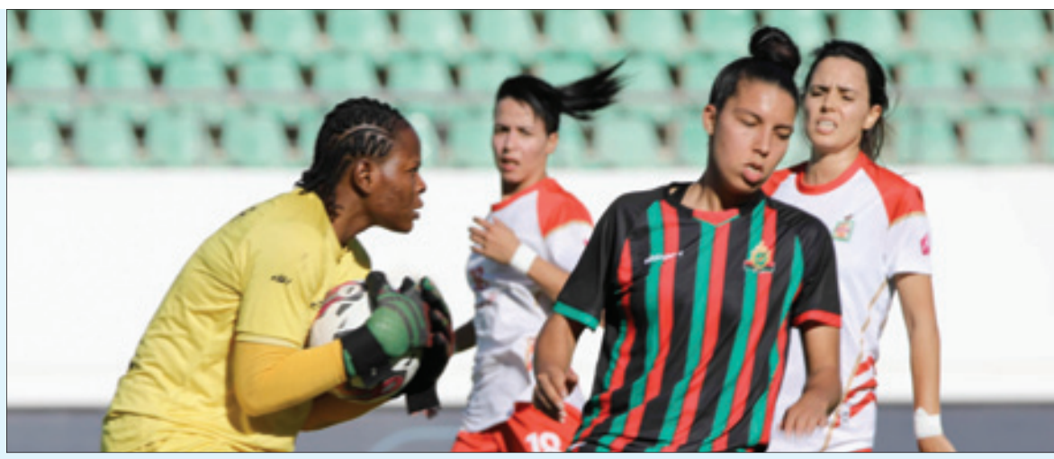
إناث الجيش الملكي يحققن الازدواجية

للمنتخب الوطني، تبقى الأندية النسوية الأخرى مطالبة بأن ترفع من فعاليتها وتنافسيتها، إن وجدت طبعاً الدعم الضروري الذي ليس متاحاً للكثير. وبهذا التتويج، يكون الجيش الملكي قد حقق لقبه الـ 11 على التوالي بعد موسم: (2012 - 2013)، (2013 - 2014)، (2014 - 2015)، (2015 - 2016)، (2016 - 2017)، (2017 - 2018)، (2018 - 2019)، (2019 - 2020)، (2020 - 2021)، (2021 - 2022). يذكر أن الجيش الملكي بلغ المباراة النهائية بفوزه على النهضة الرياضية البركانية (2 - 1)، فيما تاهل النادي البلدي النسوي العيون للنهائي بعد الفوز على الوداد الرياضي (2-0).