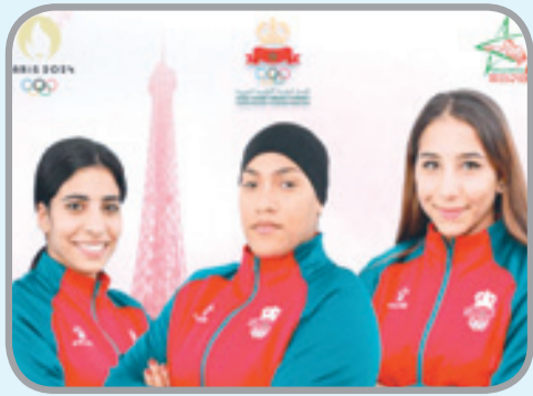
الملاكمات المغربيات جاهزات لتحدي بباريس

المنافسة قبل الدخول إلى القرية الأولمبية. في نفس السياق، عقد المكتب التنفيذي اجتماعا مع الملاكمات والجهاز التقني بتاريخ 26 يونيو 2024 بالرباط. وخلال هذا الاجتماع، أعرب رئيس الجامعة عن دعمه وتشجيعه لهن قبل مغادرتهم صوب مدينة باريس. وقد تم التأكيد عقب هذا اللقاء على التزام الجامعة بتوفير كل الموارد اللازمة لتعزيز فرص نجاح هؤلاء الملاكمات في الألعاب الأولمبية 2024.