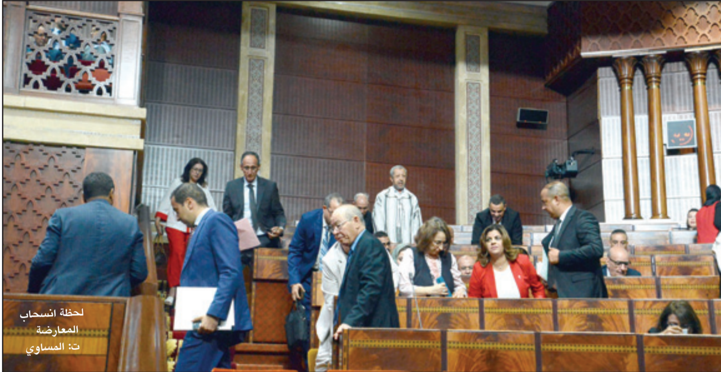
لحظة انسحاب المعارضة