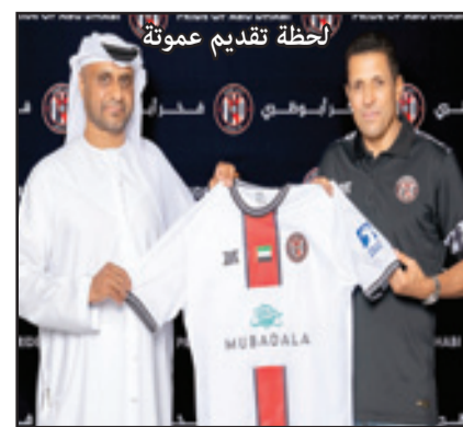
لحظة تقديم عموتة

تم في الموسم التالي إلى لقب دوري أبطال إفريقيا. كما سبق للجناح السابق أن قاد الفتح الرباطي إلى لقب كاس العرش وكأس الاتحاد الإفريقي في 2010، وأخرها قيادته الجيش الملكي إلى لقب الدوري الاحترافي في الموسم الماضي. كما قاد عموتة المنتخب المحلي إلى لقب كأس أمم إفريقيا للمحليين عام 2020.