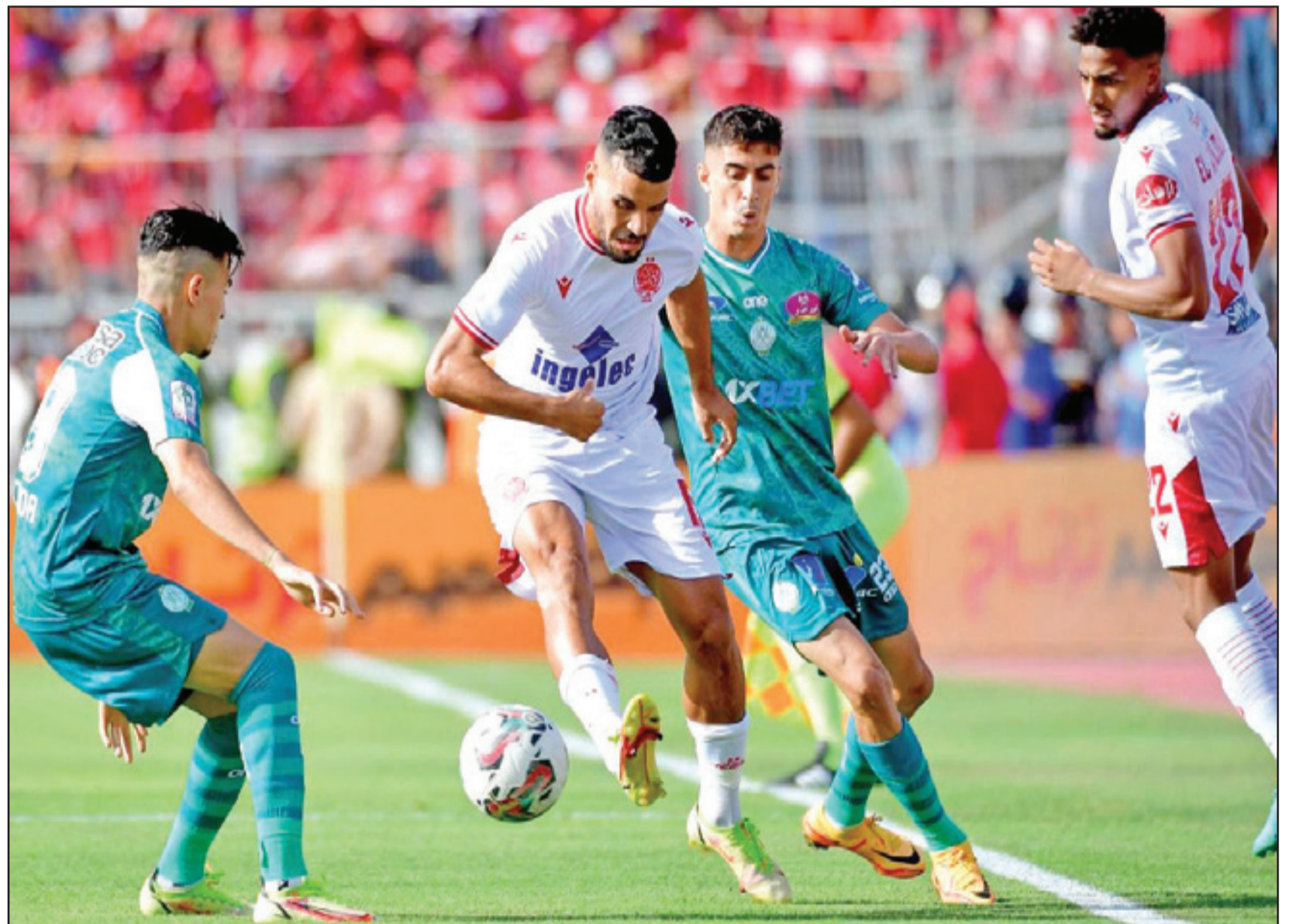
الحماية الاجتماعية حصر لاعبي كرة القدم الوطنية