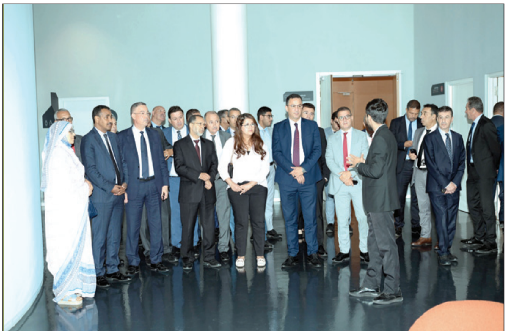
رئيس الجامعة يرافق المجموعة البرلمانية خلال زيارتها لمتحف كرة القدم

إفريقيا للامم، كما فاز المنتخب الوطني لكرة القدم داخل القاعة بكأس إفريقيا للامم ثلاث مرات متتالية، فضلا عن تاهل المنتخب الوطني النسوي لثمن نهاية كأس العالم، التي أقيمت منافسة ما بين استراليا ونيوزيلندا؛ ويبلغ منتخب "الفوتسال" ربع نهاية كأس العالم التي أقيمت بليتوانيا وتاهل المنتخب الوطني لأقل من 17 سنة لربع نهاية كأس العالم، التي أقيمت بإندونيسيا؛ كما تاهل المنتخب النسوي لأقل من 17 سنة لأول مرة لكأس العالم التي أقيمت بالهندوتاهل المنتخب الوطني لكأس العالم التي أقيمت بكولومبيا؛ كما بلغ المنتخب الأولمبي الألعاب الأولمبية التي ستجري بباريس؛ وفاز المنتخب الوطني لكرة القدم الشاطئية بذهبية الألعاب الإفريقية، التي أقيمت بمدينة الحمامات بتونس.