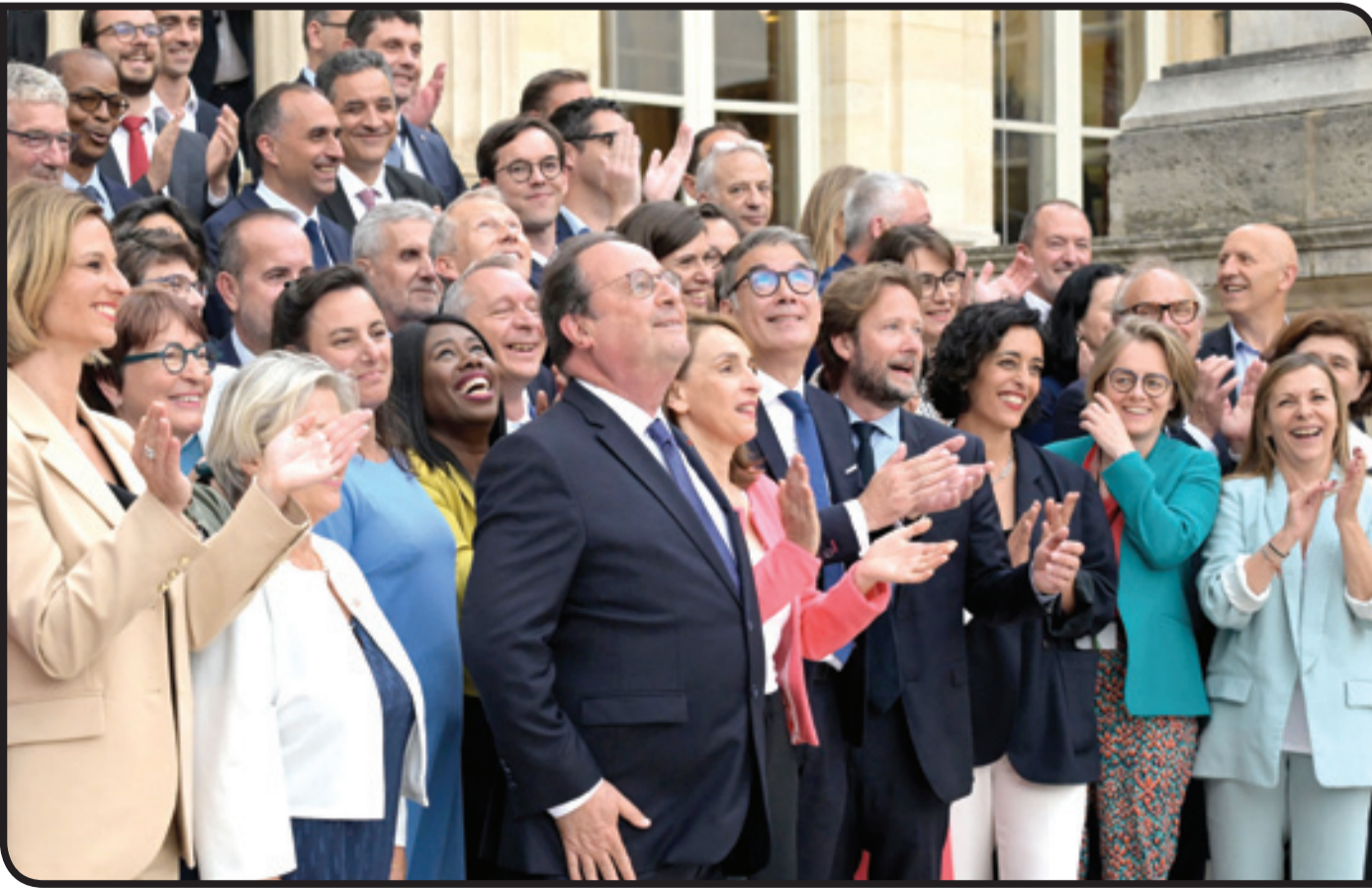
نواب الحزب الاشتراكي الفرنسي يتقدمهم الرئيس السابق فرانسوا هولاند

أما القوة اليسارية الرئيسية الأخرى، وهي حزب «فرنسا الأبية» فتقترح النائبة كليمانس غيتي البالغة 33 عاماً، ونحظى بشعبية كبيرة بين النشطاء. ومع حضورهم تبعاً للثلاثاء إلى الجمعية الوطنية، أوحى نواب اليسار باستبعاد توسيع قاعدتهم السياسية باتجاه اليمين الوسط، في حين أنهم لم يحصلوا سوى على 190 مقعداً نيابياً، بعيداً عن الغالبية المطلقة وهي 289 مقعداً. وقال العضو البيئي في مجلس الشيوخ يانك جادو في تصريح لشبكة تي إف 1 الخاصة «لا أعتقد أنه يمكن اليوم تشكيل ائتلاف أوسع مع الجبهة الشعبية الجديدة في الحكومة» معتبراً أن «التحالفات ستبني