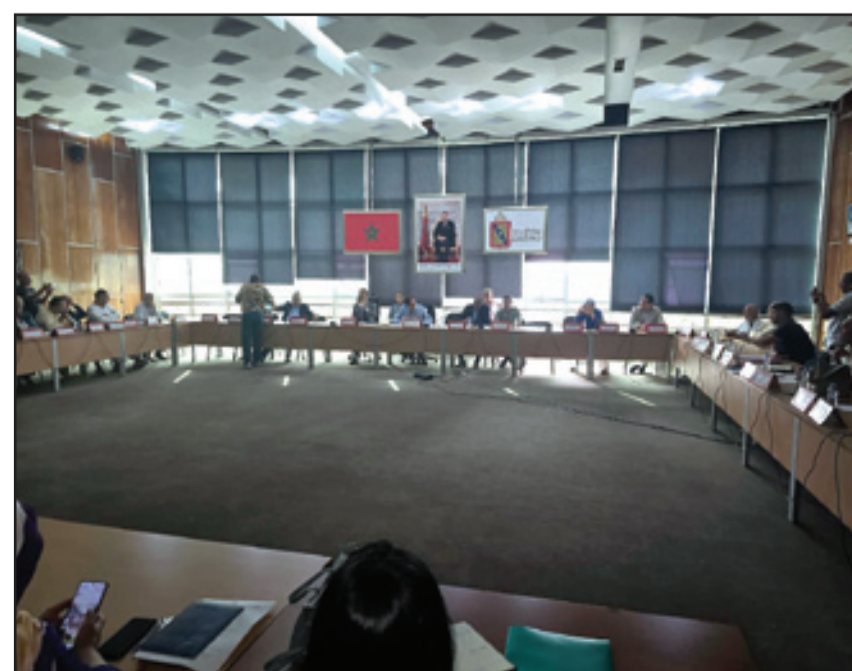
بلدية المحمدية تعيد الأمل للشباب

من جهة، أصدر المكتب المدير لنادي شباب المحمدية بلاغا عبر فيه عن امتنانه لمكونات المجلس الجماعي لمدينة المحمدية، مسجلا « بكل اعتزاز المبادرة المواطنة الكبيرة التي أقدم عليها... ». معتبرا « أن هذه الخطوة تؤكد انخراط كل الفاعلين الرسميين والمؤسساتيين والخواص في دعم فريق شباب المحمدية والالتفات حوله ليتمكن من تمثيل المدينة أحسن تمثيل... ».