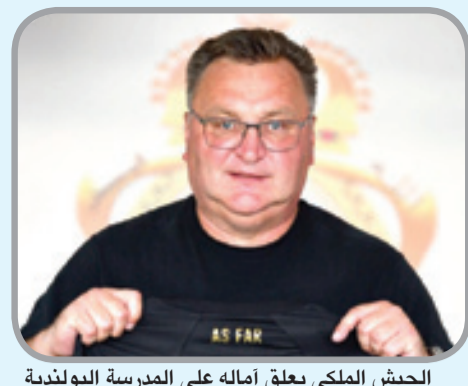
الجيش الملكي يعلق آماله على المدرسة البولندية