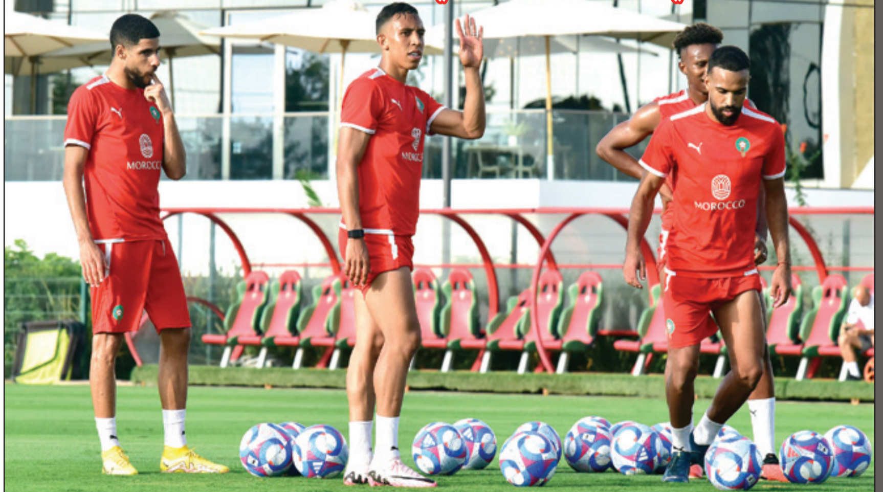
من تحضيرات العناصر الوطنية بمرکز محمد السادس

أولمبية. وأضاف لاعب اتحاد تواركة أن الأجواء جيدة داخل معسكر المنتخب الوطني، حيث تسير التحضيرات بطريقة احترافية وأن الفريق الوطني سيذهب إلى الأولمبياد برهان التتويج.