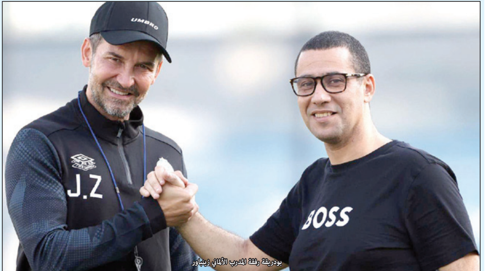
بودريقة رفقة المدرب الألماني زينباور