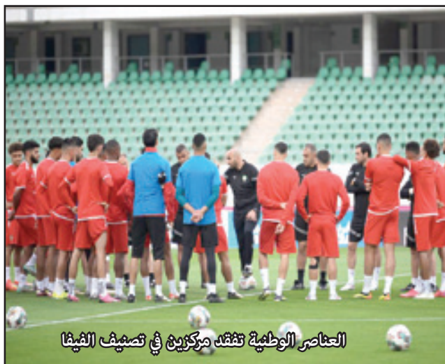
المنتخب الوطني يحتفل بمركزين في تصنيف الفيفا

منتخب كوريا الجنوبية بنتيجة هدف دون مقابل. وتصدر منتخب اليابان تصنيف قارة آسيا بحلوله في المرتبة 18 عالميا وساعده في ذلك فوزه الرباعي على المانيا ليده المنتخب الإيراني، الذي حل في المرتبة 20 وأستراليا في المركز 22 ثم كوريا الجنوبية في المركز 23 عالميا، وتقدمت قطر إلى المركز 34 والعراق في المركز 55 والسعودية في المركز 56 والأردن في المركز 68 والإمارات في المركز 69 ثم عمان في 76.