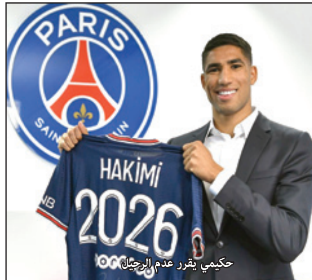
حكيمي يقرر عدم الرجوع إلى صفوف ريال مدريد

يذكر أن حكيمي شارك الموسم الماضي في 40 مباراة بقميص سان جيرمان في جميع المسابقات، وسجل 5 أهداف وقام بصناعة 7 أهداف طوال الموسم.