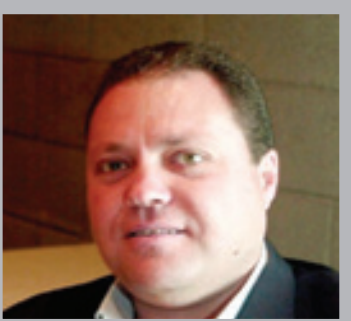
سري القدوة *

ما من شك أن مواقف دول الاتحاد الأوروبي الداعمة لحقوق الشعب الفلسطيني باتت تشكل قاعدة مهمة للعمل الدبلوماسي والعلاقات الثنائية الداعمة للنضال الوطني الفلسطيني، فهي مواقف إيجابية داعمة لنضال الشعب الفلسطيني من خلال اعتراف الدول الأوروبية بدولة فلسطين، والتأكيد على دعم الحقوق الوطنية العادلة للشعب الفلسطيني، ودعم مبدأ السلام القائم على حل الدولتين، ورفض جرائم الحرب المتواصلة التي تمارسها حكومة الاحتلال بحق الشعب الفلسطيني ومخططات الإبادة الأمريكية وسياسة الضم ومشاريع التصفية الإسرائيلية. اتخاذ الدول الأوروبية، وفي مقدمتها الحكومة الإسبانية، قرارا بالانضمام ضد حكومة الاحتلال في الدعوة المرفوعة من جنوب إفريقيا لمحكمة العدل الدولية، وتبني إجراءات مناهضة لضم حكومة الاحتلال لأراض فلسطينية محتلة في إشارة واضحة لإمكانية اتخاذ إجراءات عقابية ضد الاحتلال وقيادته، يأتي في سياق تصاعد الرد الدولي ضد مخططات الضم الإسرائيلية، ويدل على تشكل جبهة دولية عريضة رافضة لكل أشكال الاحتلال كما تجلى في الموقف الدولي الداعم للنضال الفلسطيني. في ظل تصاعد جرائم الاحتلال وحرب الإبادة التي تنفذها الحكومة الإسرائيلية بحق الشعب الفلسطيني تزداد الدعوات للاعتراف الدولي