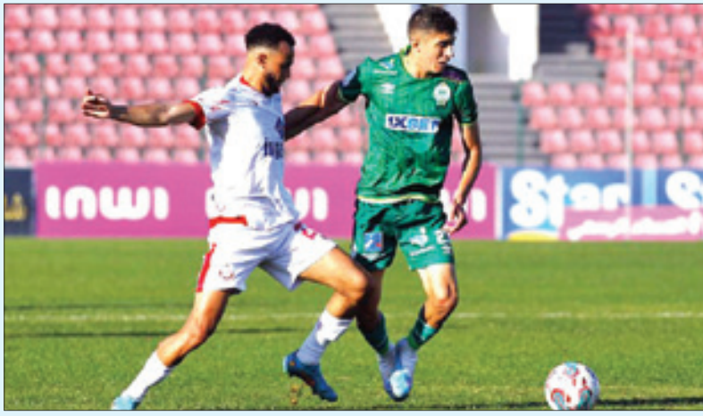
وأخيرا.. الوداد والرجاء يعودان إلى الدار البيضاء