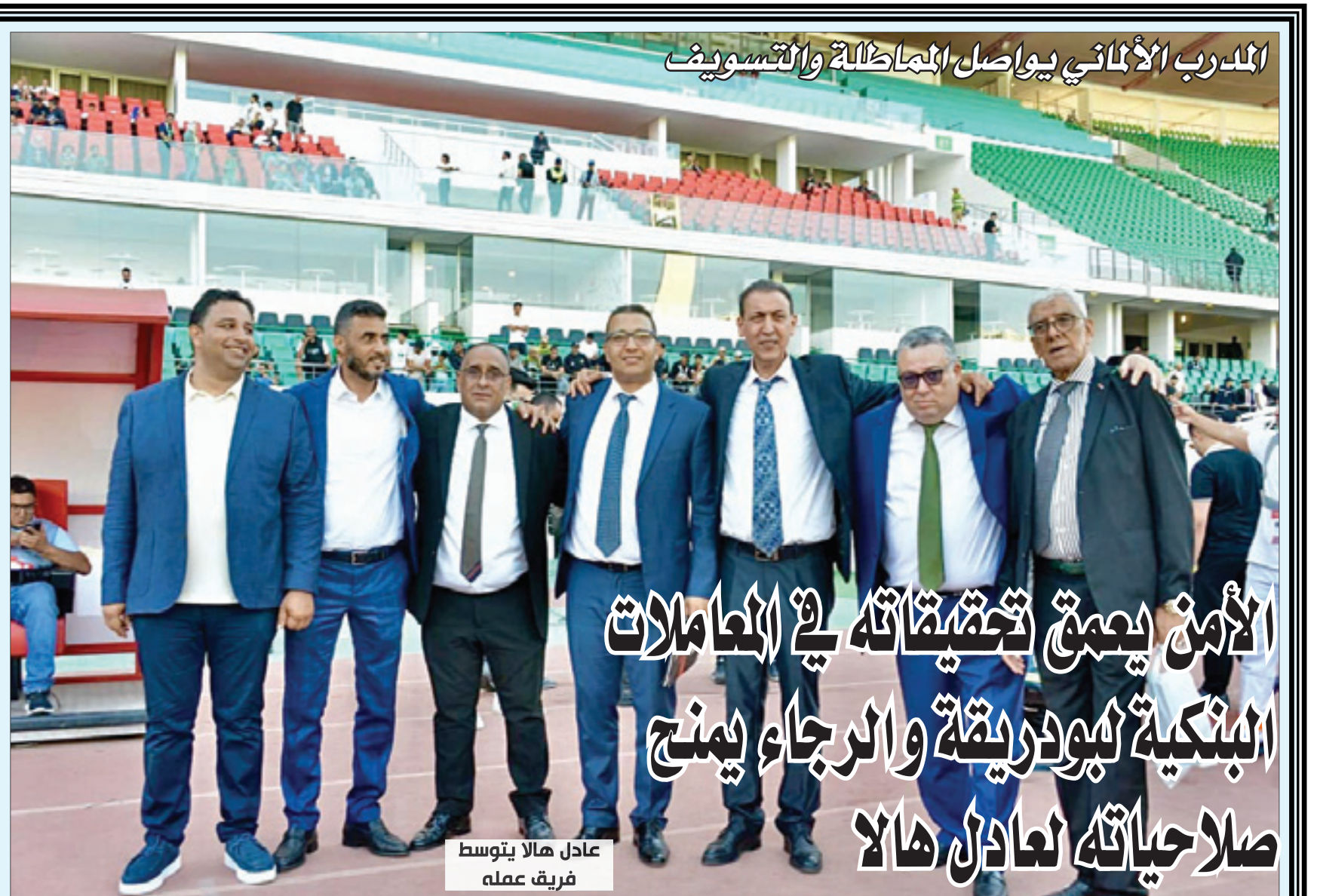
المدرّب الألماني يواصل المماطلة والتسويف