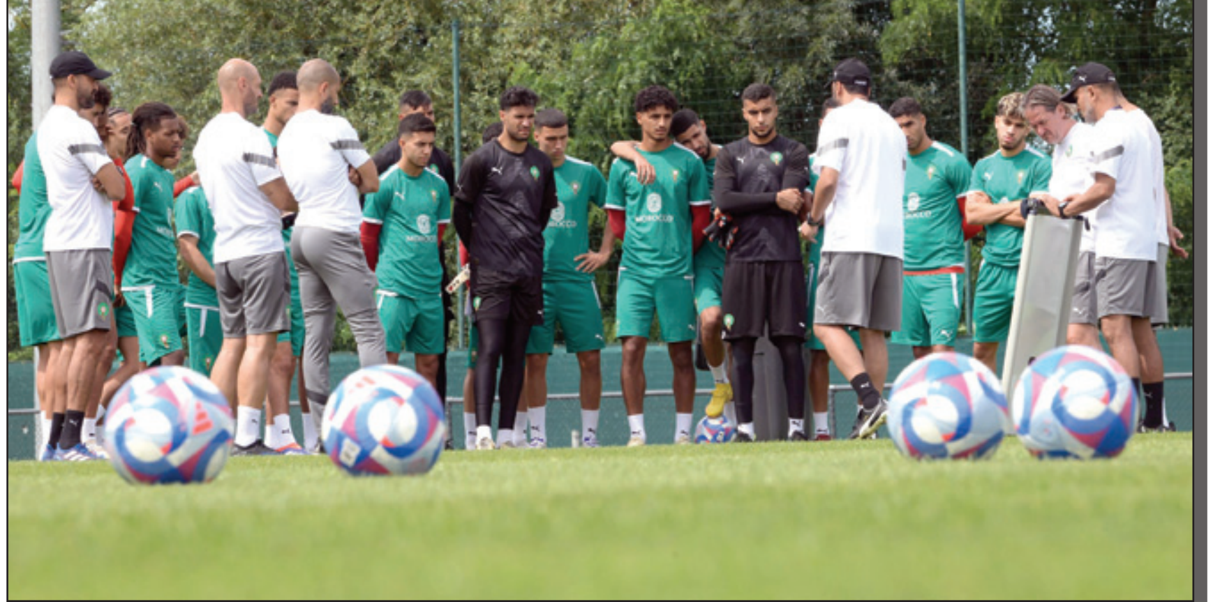
العناصر الوطنية جاهزة للتحدي الأولمبي

عاما)، تخر تشكيلة الأولمبي بلاعبين واعين وجدوا لأنفسهم مكانا في صفوف أسود الأطلس على غرار رابع، أو قاريا بتتويج منتخبه الأولمبي بلقب أمم إفريقيا للمرة الأولى في تاريخه. وشدد طارق السكتوي، خليفة مواطنه عصام الشريعي صانع إنجاز التتويج بلقب أمم إفريقيا للأولمبيين، على حرصه الكبير مع المسؤولين عن اللعبة في البلاد لتغيير هذه الصورة والذهاب إلى أبعاد دور ممكن في باريس على الرغم من صعوبة المهمة.