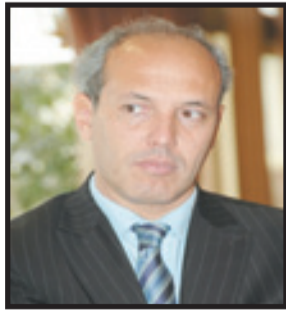
باريس: يوسلف لهلاللي

بشكل كبير، اليمين المتطرف الفرنسي يرعاة مارين لوين، وهي الانتخابات التي دعا لها الرئيس بعد حله للجمعية الوطنية، لم تخرج باريس من أزمة كبيرة السياسية، بل زادت الوضع السياسي عموضاً وتعقيداً، وذلك من خلال فرز ثلاث كتل لا تتوفر على أغلبية لحكم فرنسا، حيث فازت الجبهة الشعبية الجديدة، ائتلاف الأحزاب اليسارية، بأكبر عدد من المقاعد، يليها المعسكر الرئاسي من يمين الوسط، ثم التجمع الوطني اليميني المتطرف مع حلفائه. وتتمتكت يانيل برون بيفيه، وهي من أتباع الرئيس إيمانويل ماكرون من الحصول، مجدداً، على مقعد رئيسة المسؤولية حسب المتتبعين، لأن مارين لوين تريد بعد تحالف مع نواب من حزب الجمهوريين، وهو ما يؤشر على أن احتمالات وصول اليسار إلى السلطة التنافسية تتلاشى بل تتعدى في ظل الظروف السياسية الحالية بفرنسا. قادة اليسار انتقدوا، بقوة، هذا التحالف الذي اعتبروه سرقاً لانتصارهم وتقديمهم في الجمعية الوطنية، وكانت رئيسة كتلة نواب اليسار لحزب 2016، التي اتاحت لرئيس وأغلبية من خارج الأحزاب الكلاسيكية حكم فرنسا في حقبة دستور الجمهورية الخامسة. وعلى هذا التحالف بأنه «انقلاب مناهض للديمقراطية»، لكون معسكرها فاز بأكبر عدد من النواب في الانتخابات التشريعية المبكرة التي نظم بورها الثاني في 7 يوليوز الماضي. طبعاً، هذه التحالفات داخل الجمعية الوطنية زادت