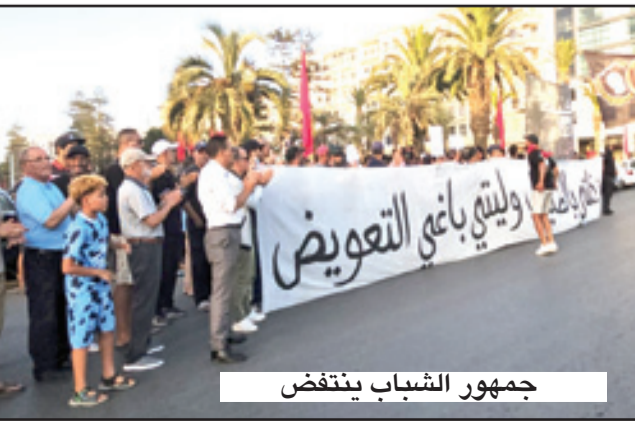
جمهور الشباب ينتفض