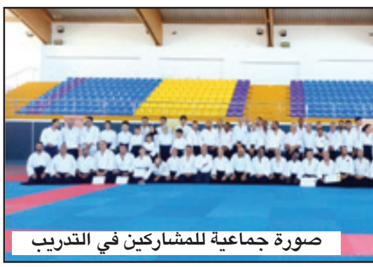
صورة جماعية للمشاركين في التدريب