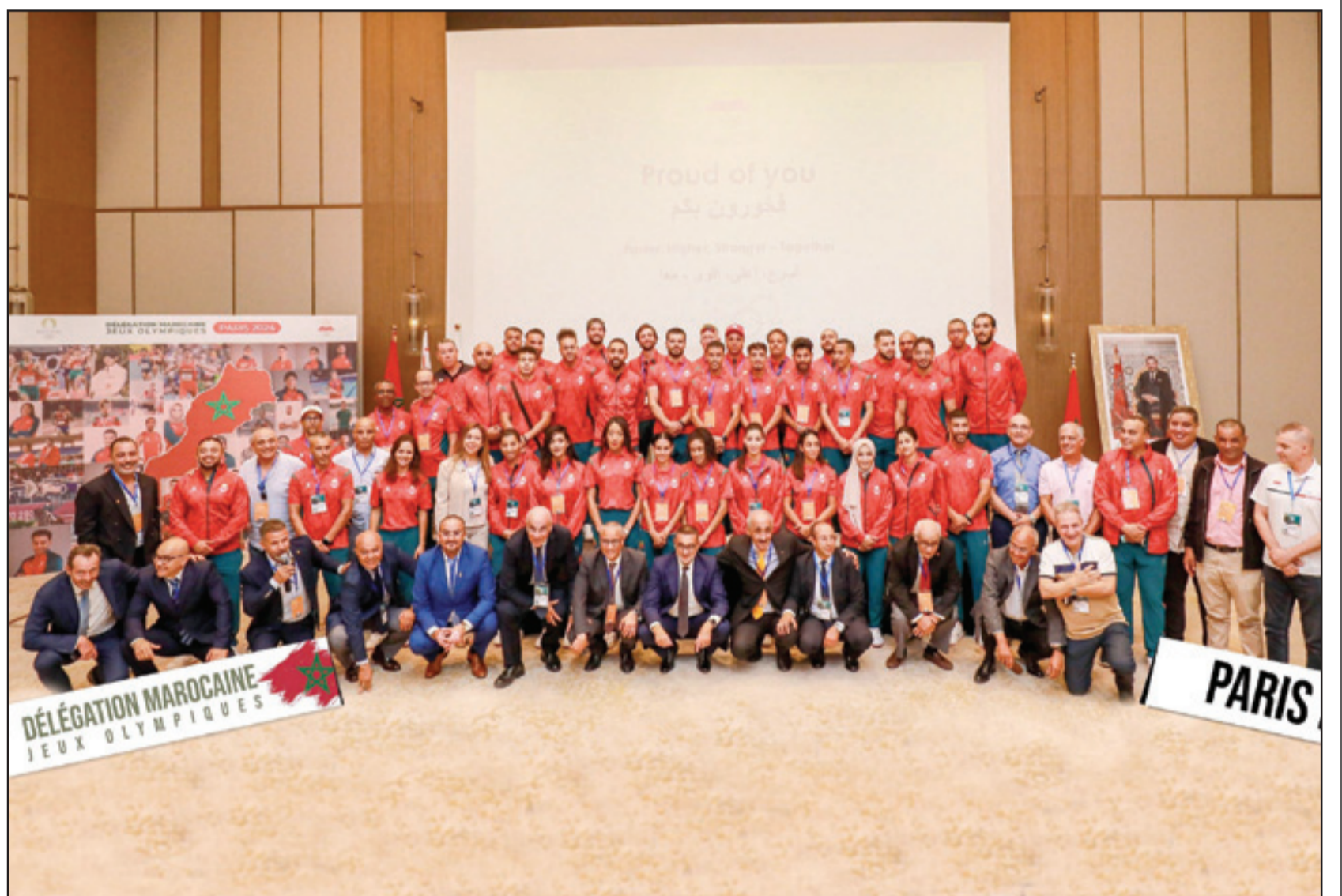
صورة جماعية لعناصر الوفد المغربي

ويتعلق الأمر باللاعب القوي (13 عداء نكورا وإنافا)، والتجديف (1)، والكرة الطائرة الشاطئية (2)، والملاكمة (3)، والبريك دانس (2)، وكالوني - كايك (2)، والدراجات (2)، والمسابقة (2)، وكرة القدم (18) والغولف (1) والجيدو (3)، والمصارعة (1)، والسباحة (2)، والسكيت بورد (1)، والفروسية (2)، وركوب الأمواج (1)، والتايكواندو (2)، والرماية الرياضية (1)، ثم الترياثلون (1). وأحرز المغرب 24 ميدالية خلال مشاركاته في دورات الألعاب الأولمبية منذ سنة 1960 بروما، منها 7 ذهبيات وخمس فضيات و12 برونزية. وكان للاعب القوي حصة الأسد من التتويج الأولمبي بإحرازها 20 ميدالية، سبع منها ذهبية وخمس فضيات وثمانى برونزيات. 2651022172