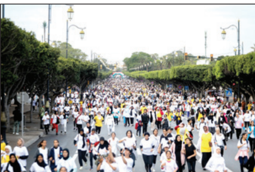
الرياضة للجميع تجوب جهات المغرب

ماسة) ومراكش (جهة مراكش أسفي) وجماعة بوعزير أرفالة بإقليم أزيلال (جهة بني ملال خنيفرة) ومقاطعة مولاي رشيد بالدار البيضاء (جهة الدار البيضاء سطات) والرشيدية (جهة درعة تافيلالت) وبران (جهة الشرق) ومكناس (جهة فاس مكناس) والقصر الصغير (جهة طنجة تطوان الحسيمة) وصولا إلى الرباط (جهة الرباط سلا القنيطرة) يوم 5 غشت المقبل.