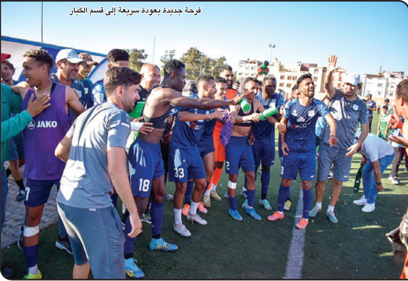
فرحة جديدة بعودة سريعة إلى قسم الكبار

ورايض بالقرب من الفريق ليل نهار، يدعم هذا ويحاول أن يأخذ بيد ذاك من أجل الحفاظ على لحمه الفريق.