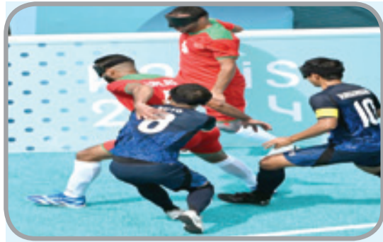
المنتخب الوطني يفقد ميداليته البارالمبية

منتخب اليابان والأرجنتين، بطل العالم، فضلا عن منتخب كولومبيا الذي خلق المفاجأة. وقال المتقي، في تصريح صحفي، «كان أملنا أن نذهب بعيدا في هذه المسابقة وتحقيق نتيجة أفضل من دورة طوكيو، لكن الفوز والخسارة يبقى أمر وارد في كرة القدم كما جميع الرياضات». يذكر أن المنتخب الوطني للمكفوفين كان قد فاز بالميدالية النحاسية في دورة طوكيو.