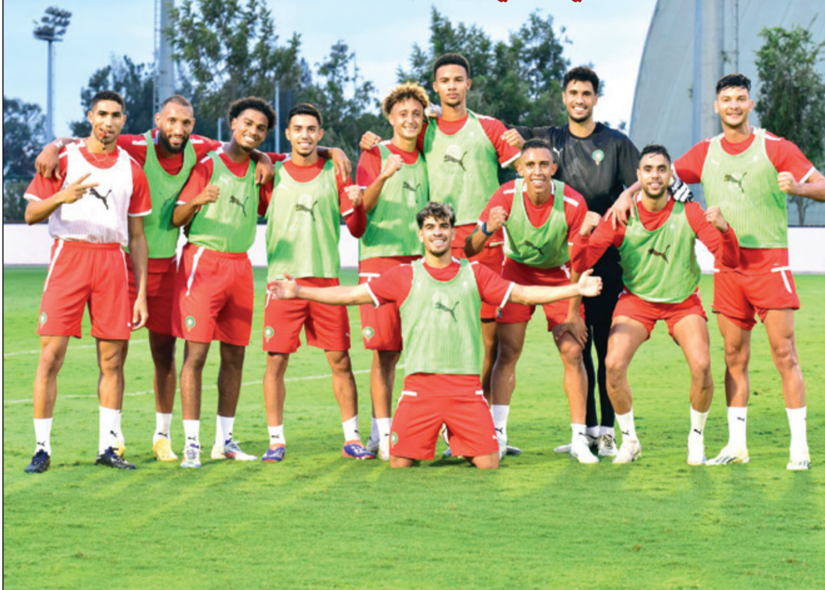
أجواء رائعة تسود معسكر أسود الأطلس

من المجموعات 12. ويراهن الناخب الوطني وليد الركراكي على مباريات هذه التصفيات القارية من أجل الوقوف بشكل دقيق على إمكانيات اللاعبين، حيث أكد خلال الندوة الصحافية التي كشف فيها عن لائحة الفريق الوطني لمواجهة الغابون وليسوتو على أنه سيعطي الفرصة لكل من يستحقها، خاصة وأن القاعدة الموسعة للمنتخب الوطني تضم 70 لاعبا، وبالتالي فإن هذه المباريات ستكون برهان تكوين منتخب قوي ومتناسك، يدخل النهائيات القارية، المقررة على أرض المغرب، بعزيمة وإصرار كبيرين من أجل تحقيق اللقب، الذي يبقى من أكبر الأهداف التي تعاهد عليها مع الجامعة.