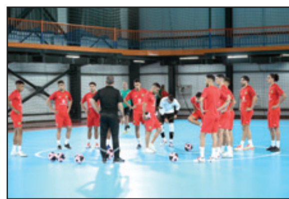
منتخب القاعة يرفع إيقاع تحضيراته للمونديال