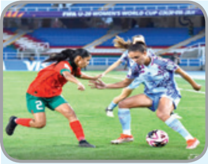
اللاعبات المغربيات يكتفين بتسجيل الحضور

في كأس العالم للسيدات أقل من 20 سنة. وضمن المجموعة الأولى، أسفرت مرحلة المجموعات عن تاهل كل من البلد المضيف، كولومبيا، والمكسيك إلى دور ثمن النهائي ابتداء من 11 سبتمبر. أما عن المجموعة الثانية، فقد تاهلت كل من البرازيل وفرنسا إلى دور الثمن، فيما ضمنت المانيا ونيجيريا بطاقة التاهل للدور ذاته عن المجموعة الرابعة. وسيتم الحسم في مصير الفرق التي احتلت المركز الثالث في كل مجموعة، من خلال فارق الأهداف.