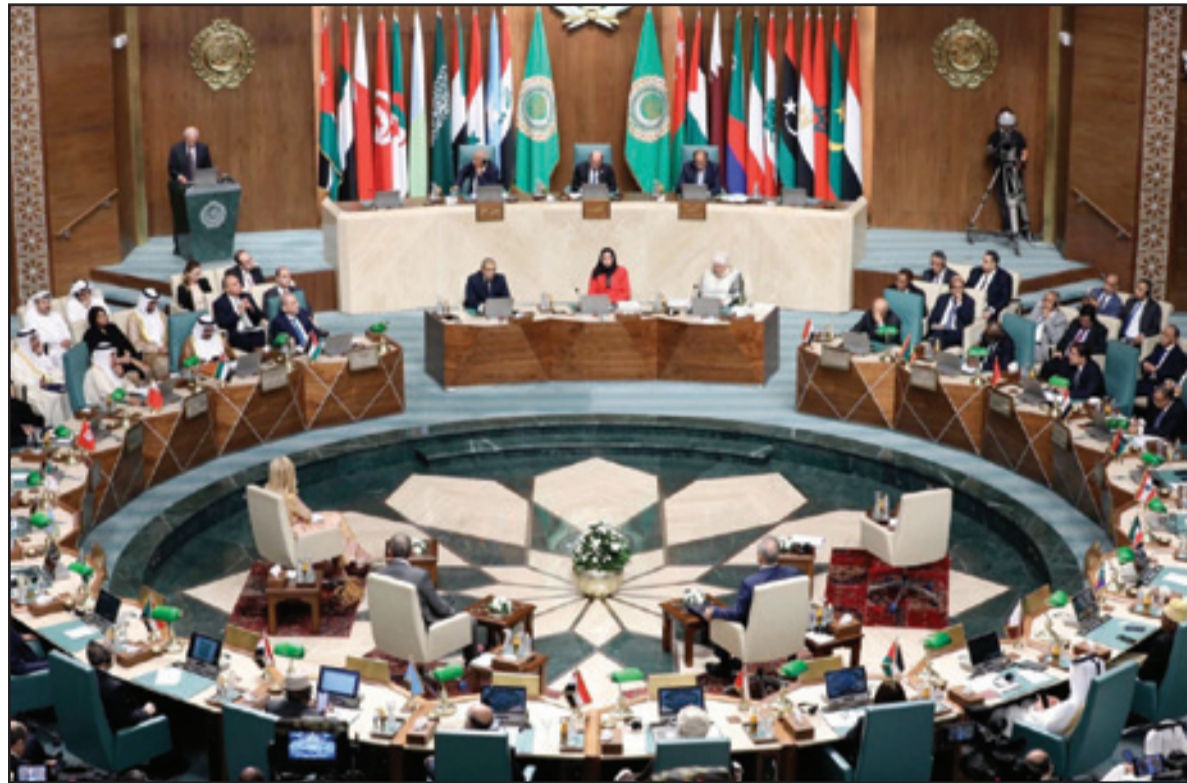
من اجتماعات القاهرة

إعلان الرباط يؤكد على ضرورة وقف العدوان الفلسطيني كمدخل لتسوية نهائية المغرب يستعرض بالقاهرة المحددات الخمس لموقفه من قضية الشرق الأوسط تنويه إسلامي وعربي لدور المغرب في دعم الصمود الفلسطيني والحفاظ على هوية القدس