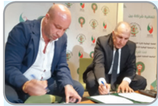
من مراسيم توقيع الاتفاقية

الوصية والمعنية. من جهتها، تلتزم العصبة الوطنية لكرة القدم الاحترافية بتفويض عدة صلاحيات للجمعية الوطنية للإعلام والناشرين، تهم تنظيم العمل الصحافي الخاص بالصحافيين المعتمدين لحضور المباريات وتغطيتها إعلاميا، والسهر على حسن سير النوبة الصحافية التي تنظم مباشرة بعد نهاية المباراة، وتنظيم الولوج لقرعة الميدان واختيار الأماكن الخاصة بالمصورين الصحافيين.