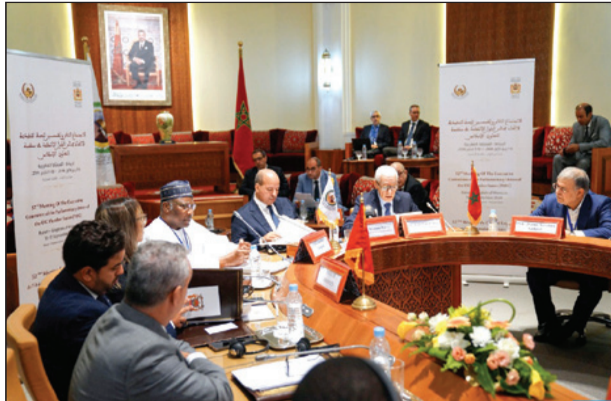
من اجتماعات الرباط

احتضن مقر مجلس النواب بالرباط، الثلاثاء، أشغال الاجتماع الـ 52 للجنة التنفيذية لاتحاد مجالس الدول الأعضاء في منظمة التعاون الإسلامي.