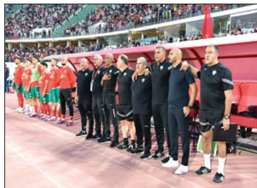
الطاقم التقني للفريق الوطني مطالب بالنزول إلى الأرض

انتقاده أو لفت انتباهه إلى أخطائه، ودعوته إلى تصحيحها، وأنها مجبرون على تقبل سوء اختياراته، وتاكد كانت بادية للعبان، وأن نصق له ونهتف باسمه المبجل، وأن