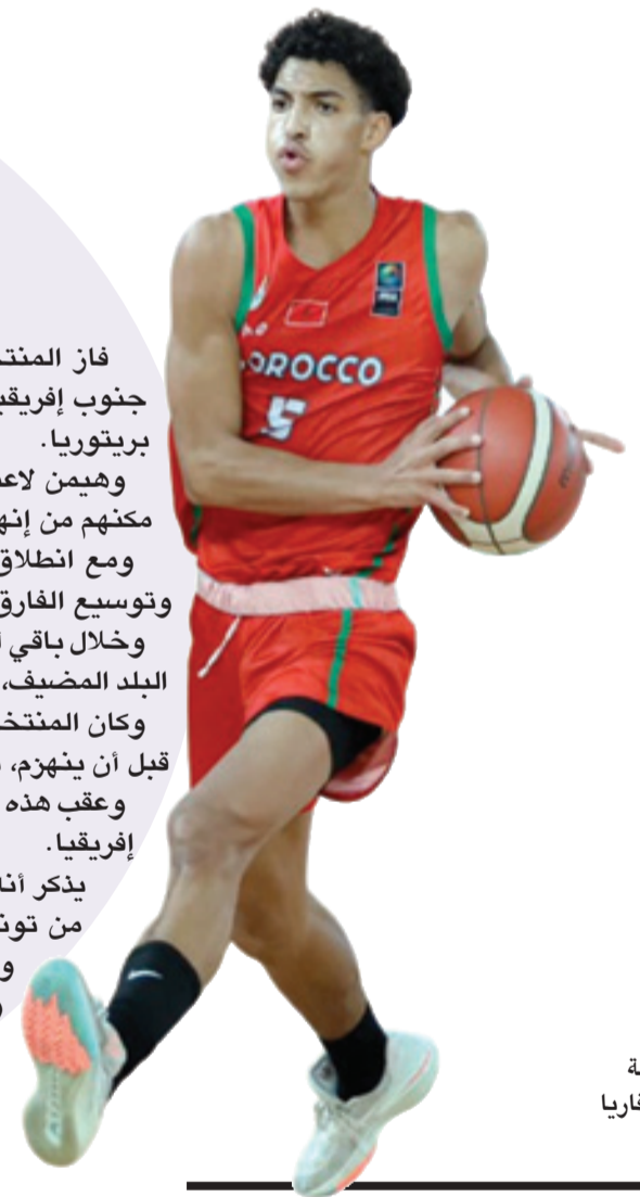
فتيان كرة السلة الوطنية يتألقون قاريا

يذكر أنه يتنافس في هذه البطولة 12 منتخبا موزعا على ثلاث مجموعات تضم أولاها كلا من تونس والكاميرون ورواندا وجنوب إفريقيا؛ فيما تضم المجموعة الثانية أنغولا ومالي والمغرب وزامبيا، والمجموعة الثالثة منتخبات أوغندا ومصر ونيجييريا وزيمبابوي.