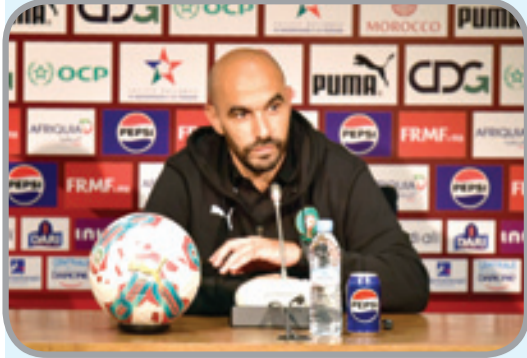
الركري يقدم تبريرات غير منطقية

الدروس الخاصة بهذا النوع من المواجهات. ووضعت قرعة إقصائيات كأس أمم إفريقيا (المغرب - 2025) المنتخب المغربي، المتاهل تلقائيا لكونه البلد المستضيف. في المجموعة الثانية إلى جانب الغابون وإفريقيا الوسطى وليسوتو، على أن تقام النهائيات في الفترة الممتدة من 21 بجنبر 2025 إلى 18 يناير 2026.