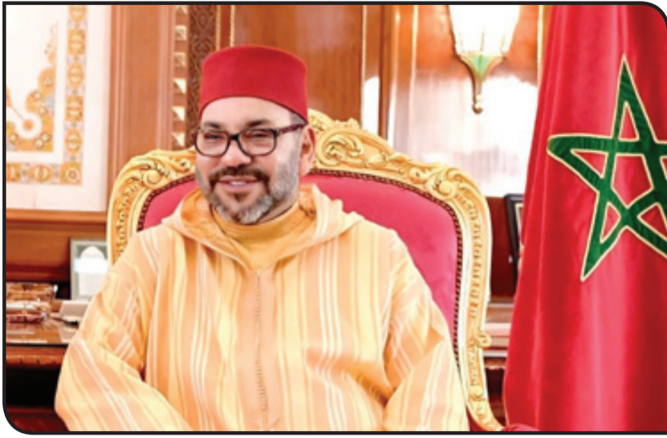
جلالة الملك يشيد بإنجازات الأبطال المغربية