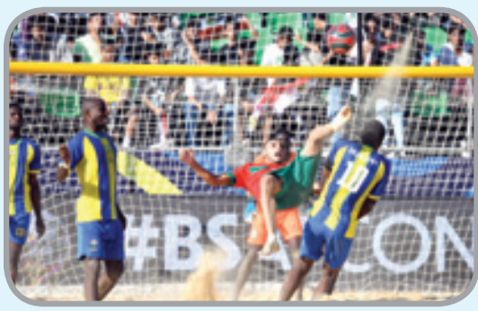
العناصر الوطنية تغلب على تنزانيا

الاثنين مباراته الثانية في هذه المجموعة ضد منتخب غانا، في حين يخوض مباراته الثالثة ضد المنتخب المصري يوم غد الثلاثاء. وتعد كأس الأمم الإفريقية لكرة القدم الشاطئية المسابقة المؤهلة لكأس العالم لكرة القدم الشاطئية 2025، التي من المقرر أن تستضيفها السيشل العام المقبل.