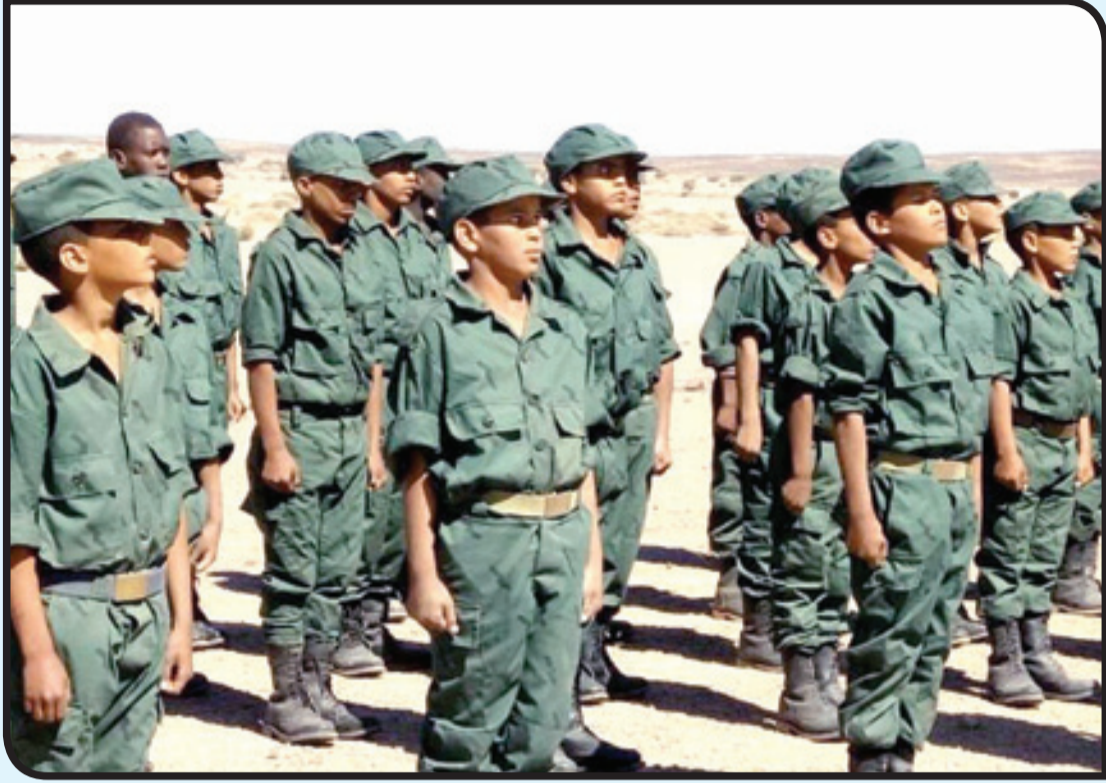
تجنيد الأطفال في مخيمات تندوف جريمة ضد الإنسانية

إدانة غياب الوصول إلى المخيمات بحرية، وتخلي الجزائر، بحكم الواقع، عن سيادتها ومسؤولياتها القانونية والإنسانية تجاه السكان المحتجزين في المخيمات لصالح ميليشيا مسلحة.