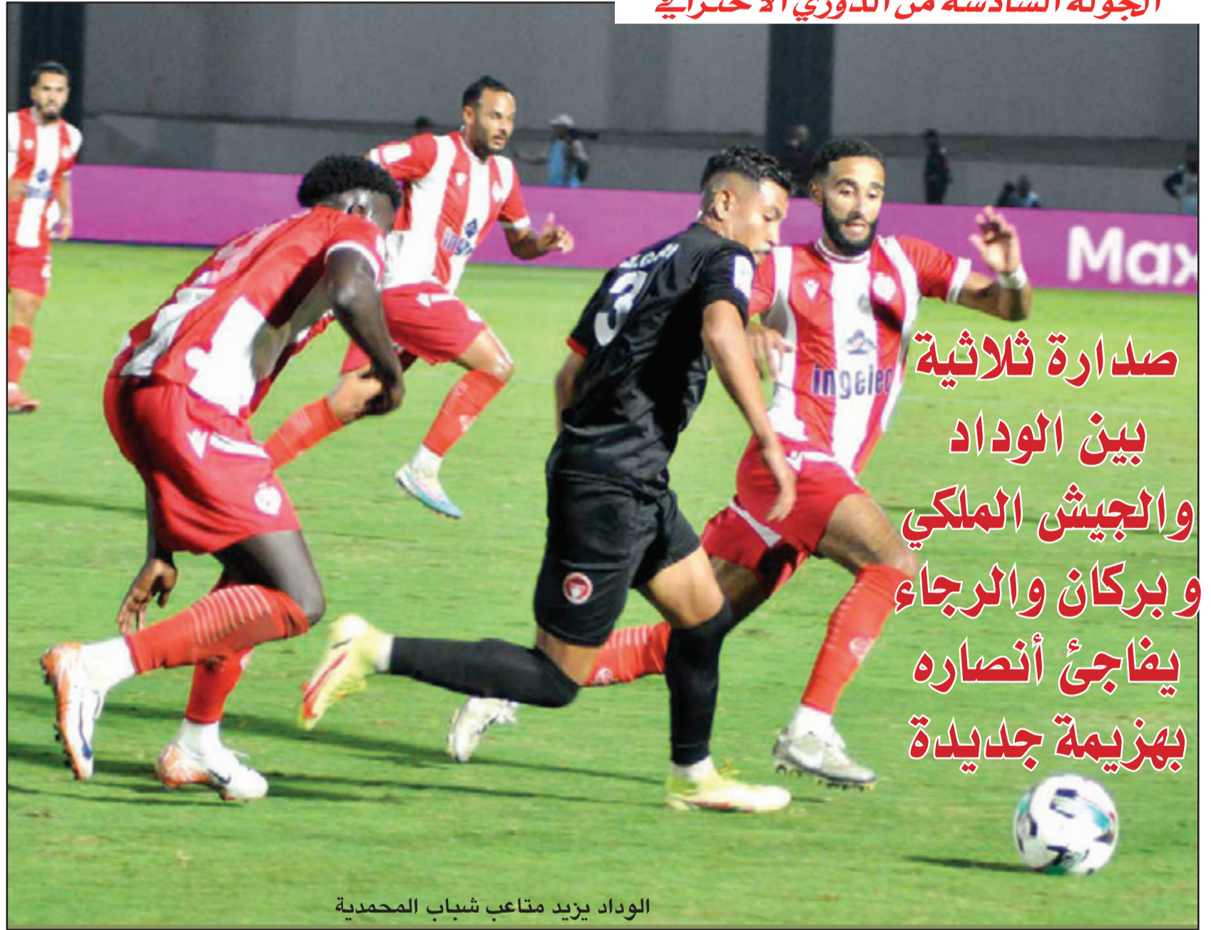
الوداد يزيد متاعب شباب المحمدية