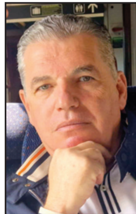
البروفيسور نabil برادة الملكي

■ ماذا بعد إعادة التأهيل؟ تشكل المرحلة الثالثة من إعادة التأهيل القلبي بداية حياة جديدة. تعتمد على المحافظة على العادات الصحية المكتسبة خلال البرنامج. يُشجع بشدة على ممارسة النشاط البدني بانتظام، بموافقة الطبيب، التسجيل في ناد رياضي مناسب يساعد في البقاء متحمسا لمواصلة الحفاظ على صحة جيدة. في الختام، تُعد إعادة التأهيل القلبي خطوة لا غنى عنها للمرضى الذين تعرضوا لحادث قلبي وعائي. فهي تساعد على إدارة مرضهم بشكل أفضل، تبني عادات صحية جديدة، واستعادة الثقة بالنفس لعيش حياة أكثر نشاطا وسعادة.