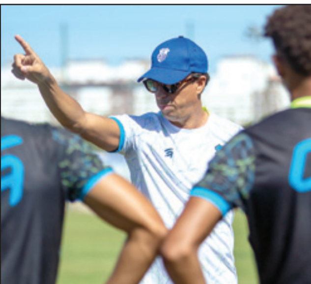
هلال الطير يغير وجه اتحاد طنجة

وبهذا الفوز قفز اتحاد طنجة لصدارة جدول الترتيب برصيد 12 نقطة، ليستعيد ذاكرة الانتصارات بعد 3 تعادلات متتالية، وحافظ أيضا على سجله خاليا من الهزائم، مزيحا بذلك الثلاثي الوداد والجيش الملكي ونهضة بركان، الذي تصدر الترتيب لـ 24 ساعة فقط.