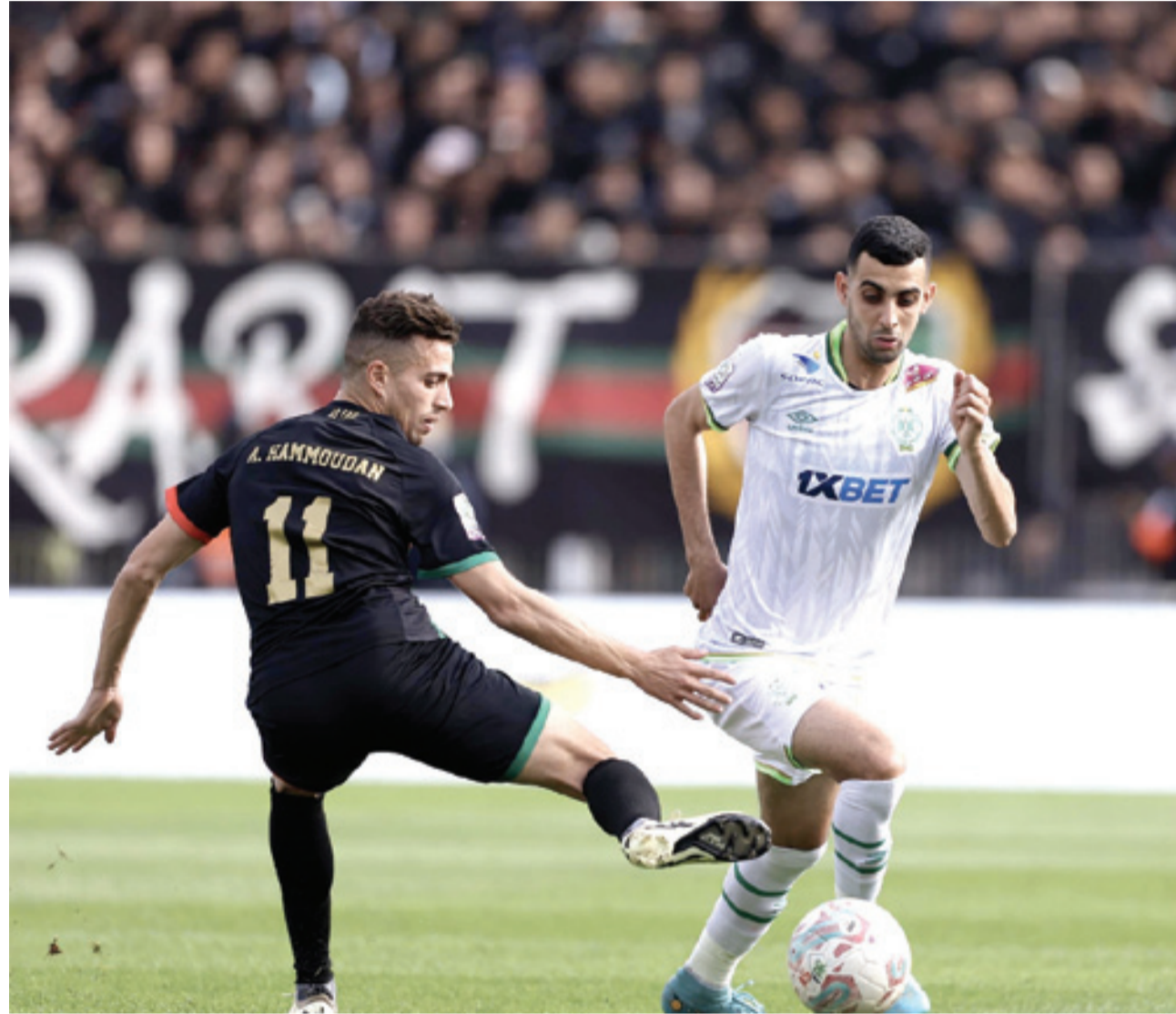
الرجاء يامل تعويض سقوطه الأخير رغم صعوبة المهمة أمام الجيش الملكي