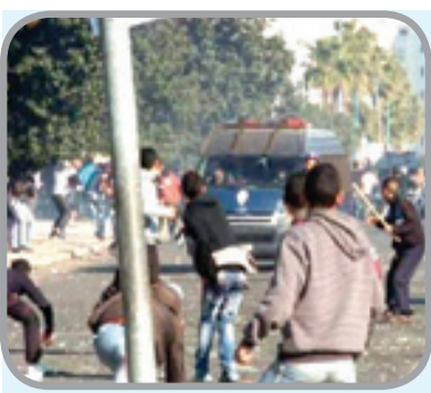
من مظاهر الشغب التي رافقت مباراة تواركة والكوديم

يوم السبت برهان إضافة فوز جديد لرصيدهما، يبقى الإتحاد في الصدارة ويمنح الفريق الإسمايلي شحنة ويدفعه نحو رتبة مطمئنة، إلا أن الطرفين لم يتمكنوا من ذلك، حيث انتهى اللقاء بالتعادل السلبي. يذكر أن النادي المكناسي كان مؤازرا بأعداد غفيرة من جماهيره، ظلوا يشجعون طيلة اللقاء، كما احتجوا في نفس على المنع وكل ما يتعرضون له رافعين لافتات كتب على إحداها «interdire nous interdire»