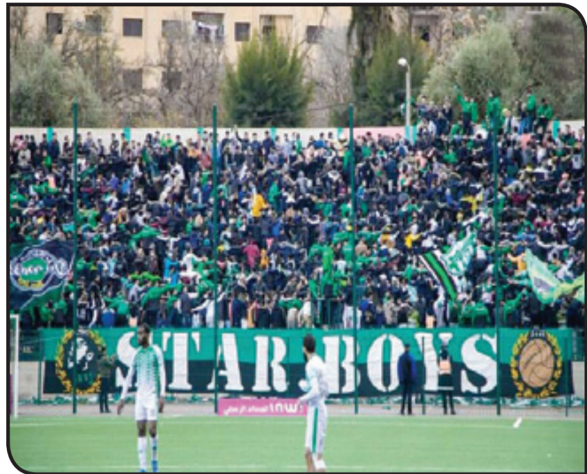
جماهير بني ملال تراهن على الصعود فقط