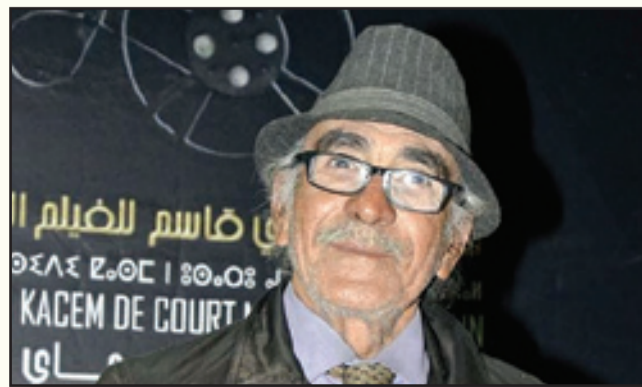
الملك القدير مصطفى منير، الذي ألقا حضوره في مختلف المهرجانات السينمائية المنظمة ببلادنا، وعلى رأسها المهرجان الوطني للفيلم بطنجة، وتعدونا على تدخلاته في مناقشات الأفلام والندوات وغير ذلك من الأنشطة السينمائية والفنية عموما، أعطى الشيء الكثير لفن التشخيص المسرحي والسينمائي ببلادنا.. هو الآن في وضعية صحية واجتماعية لا تشرف الفن والفنانين بالمغرب.

تتمنى أن تجد هذه التساؤلات أذانا صاغية قبل فوات الأوان.