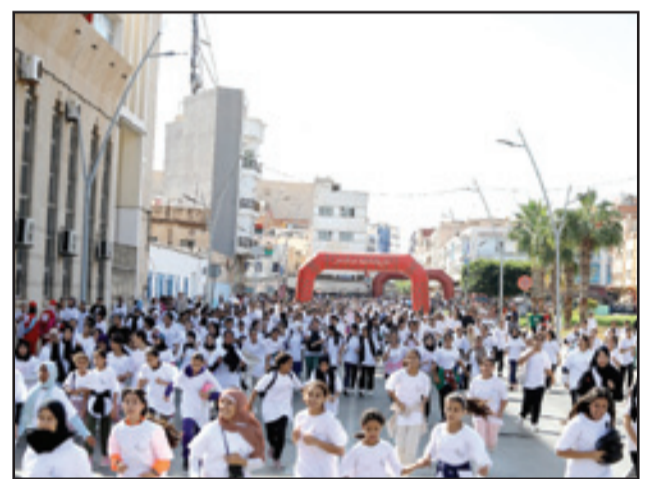
حضور مكثف لنساء الناظور في خطوات النصر

وتميزت المحطة الأولى من النسخته الثانية لهذا الحدث الرياضي، التي نظمت تحت شعار «نجري علامش قديت»، بمشاركة متميزة للشغوفات برياضة الجري، حيث أتاح للمشاركة من الفتيات والنساء، تجربة سباق (3 كلم)، واكتشاف بعض المانر التاريخية للمدينة. وفي تصريح لوكالة المغرب العربي للأبناء، أبرزت رئيسة الجامعة الملكية المغربية للرياضة للجمع، نزهة بدوان، الأجواء المتميزة التي مرت فيها هذه التظاهرة الرياضية التي شكلت مناسبة للاحتفاء بالمرأة المغربية في عيدها الوطني (10 أكتوبر).