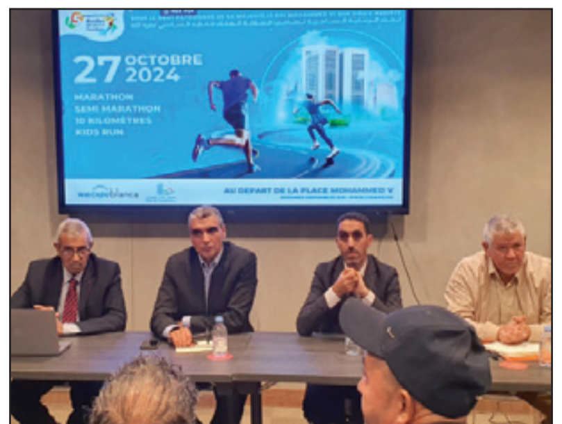
من الندوة الصحافية: تصوير هيثم رغب

وتأتي هذه الدورة، التي تنظمها شركة التنمية المحلية «الدار البيضاء للتنشيط والتظاهرات»، تحت إشراف