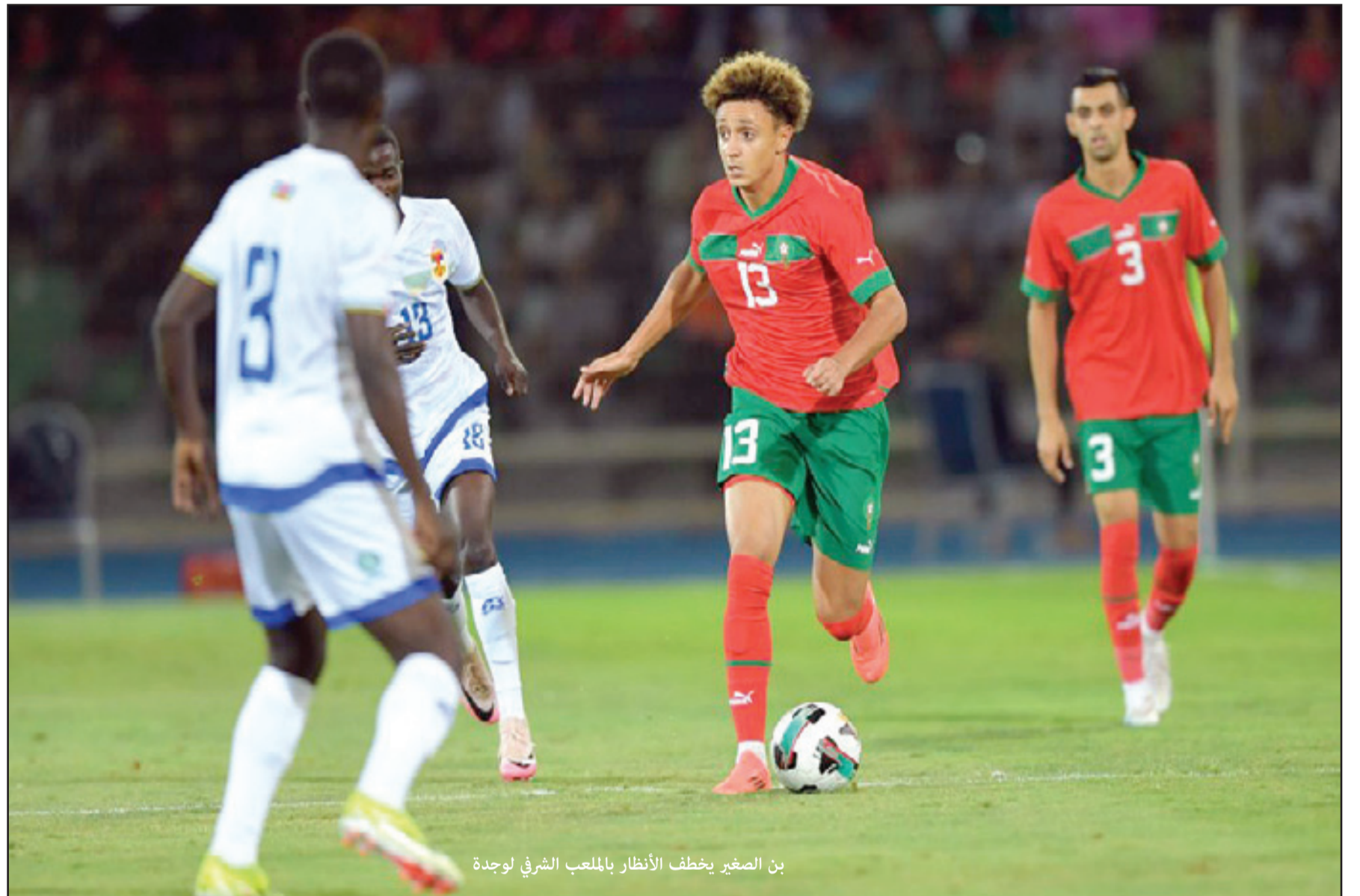
بن الصغير يخطف الأنظار بالملعب الشرفي لوجدة