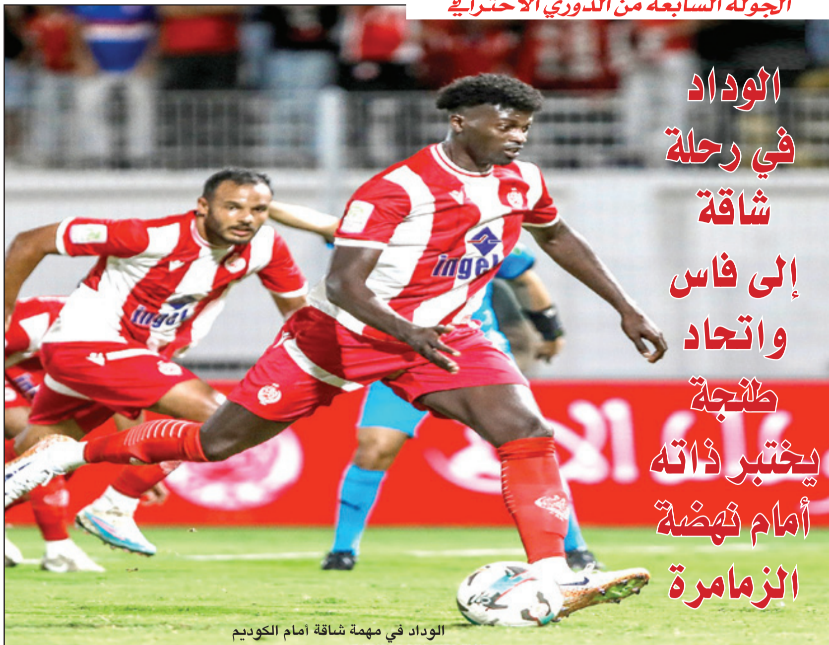
الوداد في مهمة شاقة أمام الكوديم