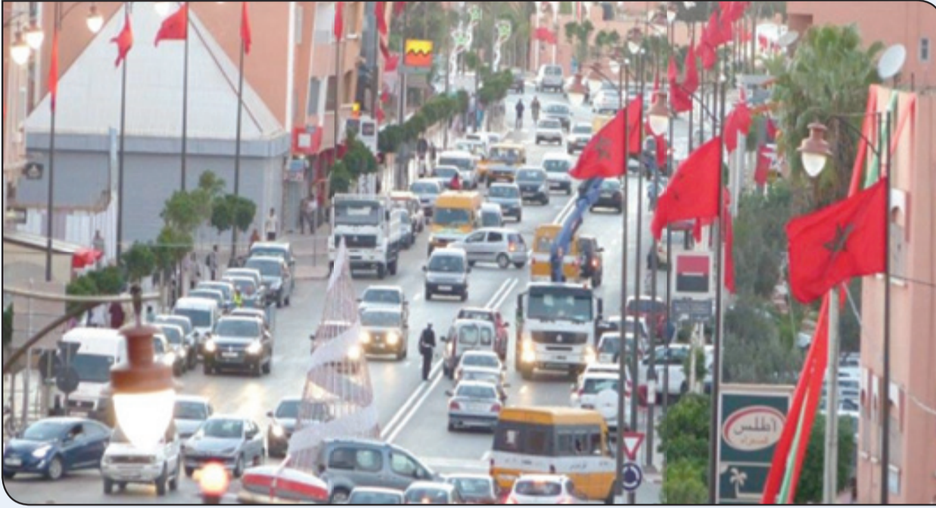
العيون حاضرة الصحراء المغربية

تتعارض مع الموقف المبني للمملكة المغربية وموقف كل المغاربة بكون الصحراء مغربية وبأن كل الصحراء