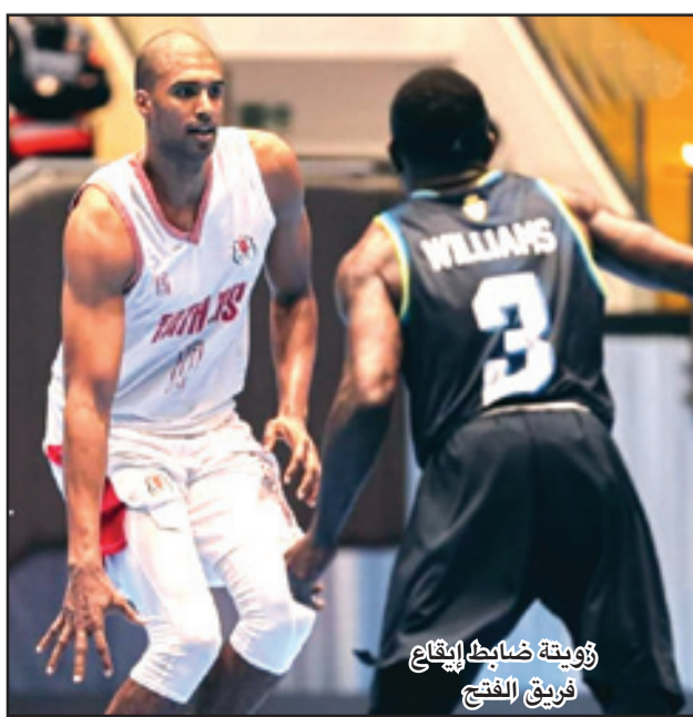
زويطة ضابط الفتح فريق الفتح

تدارك ما فات خلال القادم من مباريات... ويقاعة الزياتن بطنجة، وبسبب عطب تقني في جهاز اللوحة الإلكترونية، تم تأجيل المباراة التي كانت ستجمع الجارين مجد طنجة وليكسوس العرائش. ويتعين على الفريقين انتظار قرار الجامعة في هذه النازلة. وجرى أمس الثلاثاء بالقاعة المغلقة بميدلت، آخر مباريات هذه الجولة، وجمعت بين فريق تفاحة ميدلت والكوكب المراكشي.