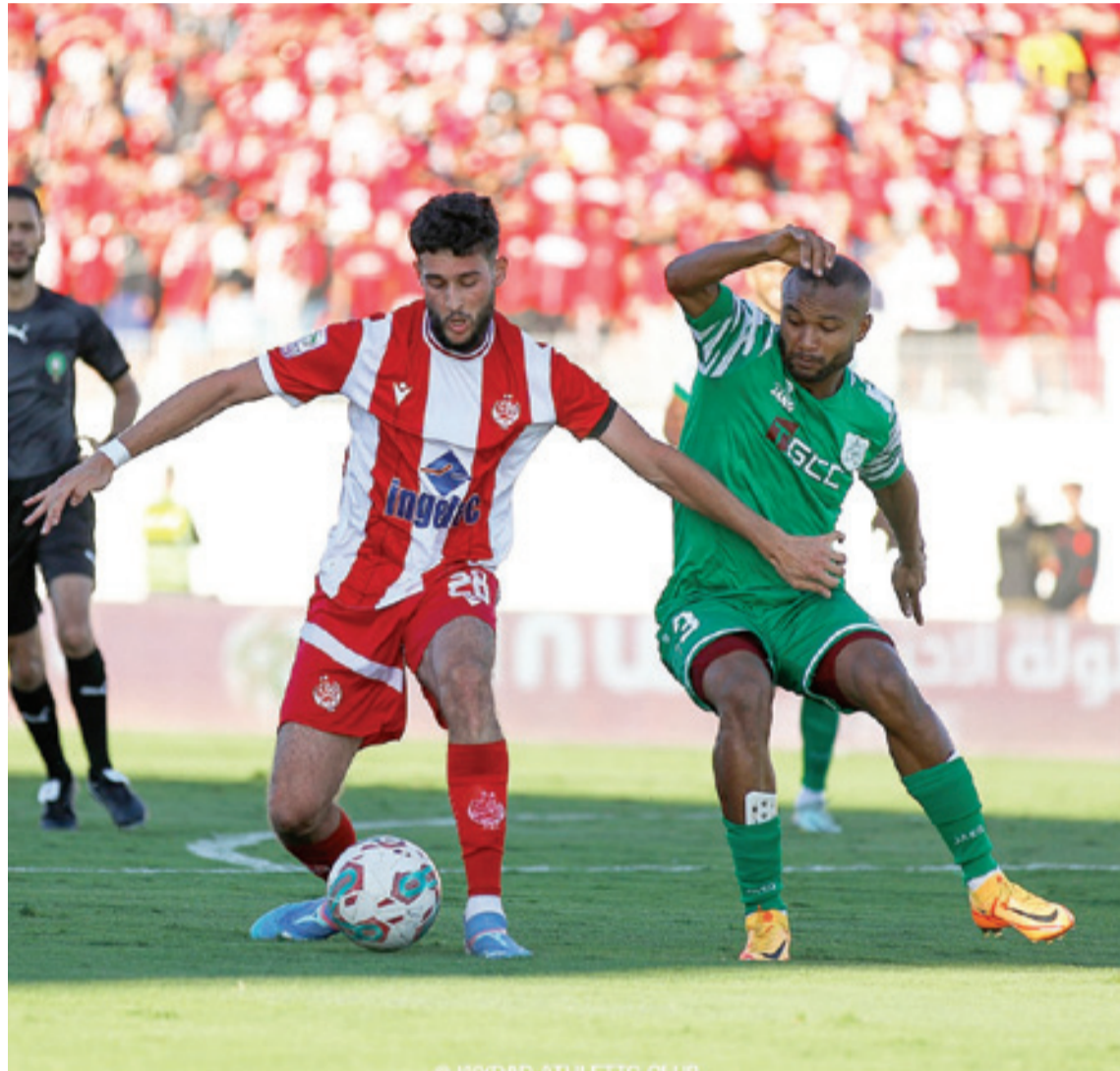
الدفاع الجديد والوداد يراهنان على الفوز

«المقندين» من سوء النتائج. صحيح أن خيار تغيير المدرب له أهداه، وبين هاتين الفرضيتين، ظل تأثير مباشر على النادي واللاعبين، لكن ثنائيه «الأداء» و«النتيجة» على أرض الأمر المؤكد أن هذا التغيير قد يشكل في الملعب هي المعيار الأساسي لتقييم مدى بعض الأحيان فرصة لضخ دماء جديدة في صحة هذا القرار من عدمه.