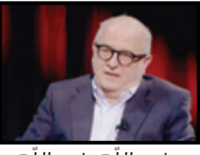
خير الله خير الله