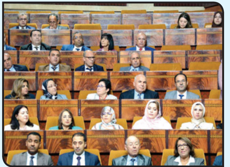
الفريق الاشتراكي- المعارضة الاتحادية

على أن يبرمج كل قطاع حكومي، مرة واحدة، في الشهر على الأقل. يحدد مكتب المجلس جدول أعمال الأسئلة الأسبوعية، والذي يتضمن كليا أو جزئيا: الأسئلة الشفهية، الأسئلة التي تليها مناقشة، الأسئلة الأنية. يقوم مكتب المجلس بتسجيل الأسئلة الشفهية الجاهزة في جدول الأعمال، على أساس البرمجة الشهرية المشار إليها أعلاه، وتنظيمها وتجميعها بشكل يمكن كل القطاعات الحكومية المبرمجة من الإجابة عن سؤال واحد على الأقل خلال الجلسة. ترتب القطاعات تنازليا حسب عدد الأسئلة الواردة بشأن كل قطاع. ترتب الأسئلة داخل كل قطاع بحسب وحدة موضوعها وتاريخ إيداعها. توزع قائمة الأسئلة المبرمجة قبل تاريخ الجلسة باثنتين وسبعين ساعة. المادة 287: "يحدد مكتب المجلس الغلاف الزمني المخصص للجلسة الأسبوعية للأسئلة الشفهية في مدة لا تزيد عن ثلاث ساعات ونصف الساعة توزع بالتمثيل النسبي بين الفرق والمجموعات النيابية والأعضاء غير المنتسبين، ويجب ألا تقل النسبة المخصصة للمعارضة عن نسبة تمثيليتها".