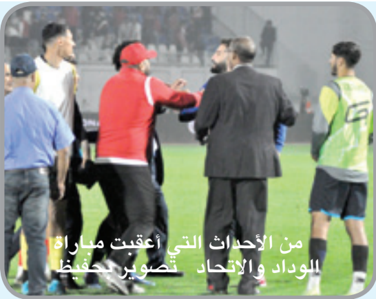
من الأحداث التي أعقبت مباراة الوداد والاتحاد تصوير لحظة

أصدر فريق الوداد الرياضي بلاغا بشأن الأحداث التي شهدتها نهاية مباراته أمام اتحاد طنجة، التي انتهت مساء السبت الماضي على وقع أحداث لرياضية. واستنكر الفريق الأحمر في بلاغه، الذي عممه على صفحته الرسمية بمواقع التواصل الاجتماعي، ما أسماه "محاولة