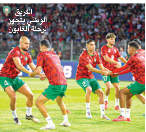
الفريق الوطني يتجهز لرحلة الغابون

سيكون مجبرا على تعويض إلياس أخوماش، التي أصيب بقطع في الرباط الصليبي، وسيجري عملية جراحية، حيث يتوقع أن يبتعد عن الملاعب حتى نهاية الموسم، وانتظار تقرير طبيب المنتخب الوطني بشأن الحالة الصحية لعز الدين أوناحي، بعد الإصابة التي تعرض لها مساء الأحد رفقة بناتيكوس في الدوري اليوناني. وغادر أوناحي مباراة فريقه أمام ليميا في الدقيقة 88، بعد احتكاك مع أحد لاعبي الفريق الخصم، الذي حاول الاستحواذ على الكرة بانذفاع قوي. وفي المقابل، استعداد صخرة الدفاع نايف أكرد مكانته ضمن فريقه ريال سوسيداد، وكان أحد الأسماء الأساسية في مواجهة برشلونه، مساء الأحد، إذ حقق رفقة زملائه فوزا ثمينًا، مع تقديمه أداء رفيعا، بعدما كان قد تعرض للإصابة في مواجهة بلينز التشيكي في منافسات أوروبا ليغ.