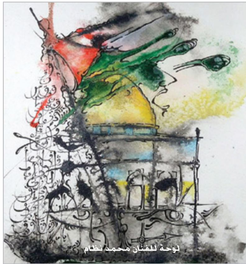
لوحة للمصان محمد نظام

مبتؤة هنا وهناك سواء على الفيسبوك أو على بعض المواقع الإلكترونية المهمة بالشعر. ولكن ما أوقن به أن تجارب الشعر الفلسطيني الجديدة لم تبلغ ذلك الأفق العربي وظلت بعيدة عن دائرة الاهتمام النقدي، ومحسوسة ضمن إطار ضيق من المحلية. تشغلني حالياً تجارب حسين البرغوثي وغسان زقطان، وليد الشخ، زكريا محمد، وزيد خدش وسهيل كنوان وغيرهم من المبدعين الراسخين في التجربة الإبداعية الفلسطينية، في السنة الماضية قرأت سيرة الناقد اللامع والكاتب الموسوعي الفلسطيني الكبير الدكتور إحسان عباس "عربة الراعي" قرأتها بتمعن وتامل كبيرين، لأن أعمال هذا الناقد الفذ تهمني وتفتح لي نوافذ كثيرة على ثقافات وأبعاد وإشارات وأساطير، بعدها قرأت شعراً للشاعر الفلسطيني الجميل حسين مهنأ، الذي اعتبره صوتاً استثنائياً وصاحب عبارة منجوتة بديعة وإتقان في ساحتنا الأدبية المحلية. وأيضاً أعجبتني كتاب نصوص قرأته مؤخراً بعنوان "خطا الناقل" للناقد الفلسطيني الجميل والمبدع زياد خدش.