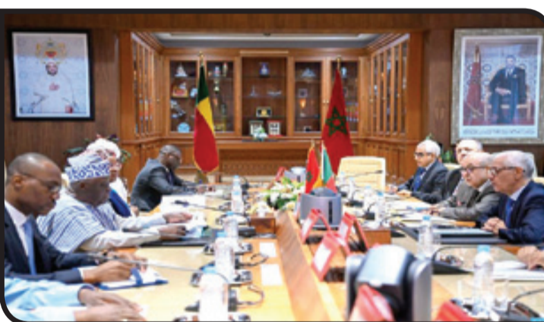
في الدفع بالتشاور والتنسيق بين المؤسستين التشريعتين على الصعيدين الثنائي والمتعدد الأطراف.

وشكل هذا اللقاء فرصة، كذلك، أطلع خلالها رئيس مجلس النواب نظيره البيني على المبادرة الأطلسية التي أطلقها جلالة الملك محمد السادس لتعزيز ولوج دول الساحل للمحيط الأطلسي، وكذا على التقدم الذي حققه المغرب في عدد من المجالات كالتطورات المتجددة وتحلية مياه البحر واستقطاب الاستثمارات الأجنبية.