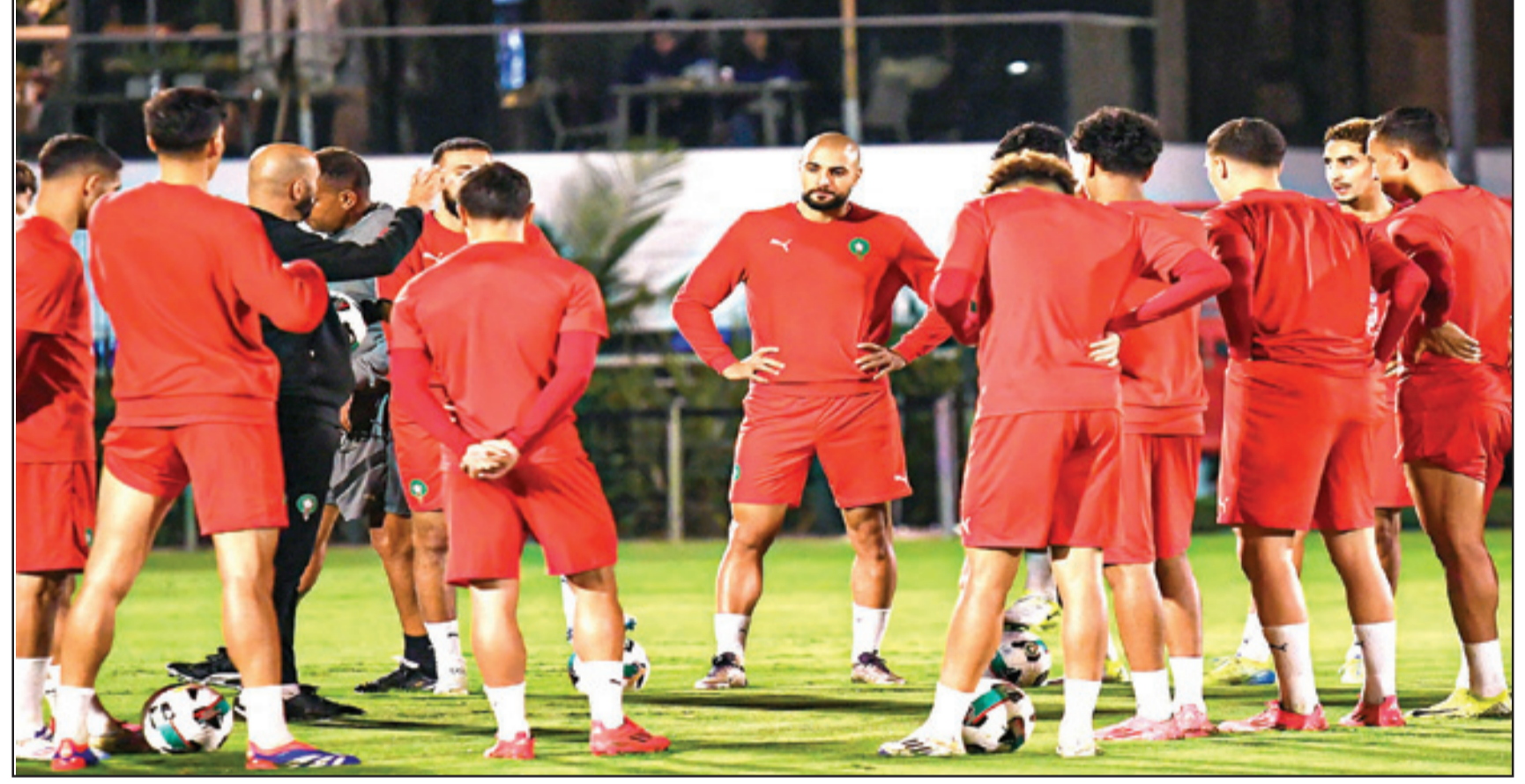
من تحضيرات الفريق الوطني ليوم الثلاثاء

ديبورتيفو الأفيس، حيث قال: "قبل الحديث عن المباراة المقبلة، أبعث برقية حب وتعاطف ودعم لهذا اللاعب رغم أنني تواصلت معه وأعلنت له وقوفي بجانبه". وأضاف: "عليه التحلي بالصبر ورباطة الجأش كي يعود قويا مثلما عاد زكرياء بوخالل من نفس الوضع وهو حاضر معنا. أخوماش لاعب جيد ورائق من عودته ليبلحق بنا".