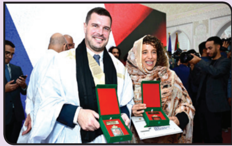
السفير الفرنسي ورئيسة الغرفة التجارية الفرنسية

له زيارات ميدانية لعدد من المشاريع حيث عاينوا عن كثب الجهود المتواصلة المبذولة من أجل التنمية الشاملة والمندمجة لجهة العيون الساقية الحمراء. وكانت الغرفة الفرنسية للتجارة والصناعة بالمغرب التي يبلغ عدد أعضائها 3000 عضو وتضم أكثر من 20 ألف منخرط قد افتتحت مقرات جهوية بالعيون في ماي 2017، والداخلية في مارس 2019، ومؤخرا بكميم في فبراير الماضي.