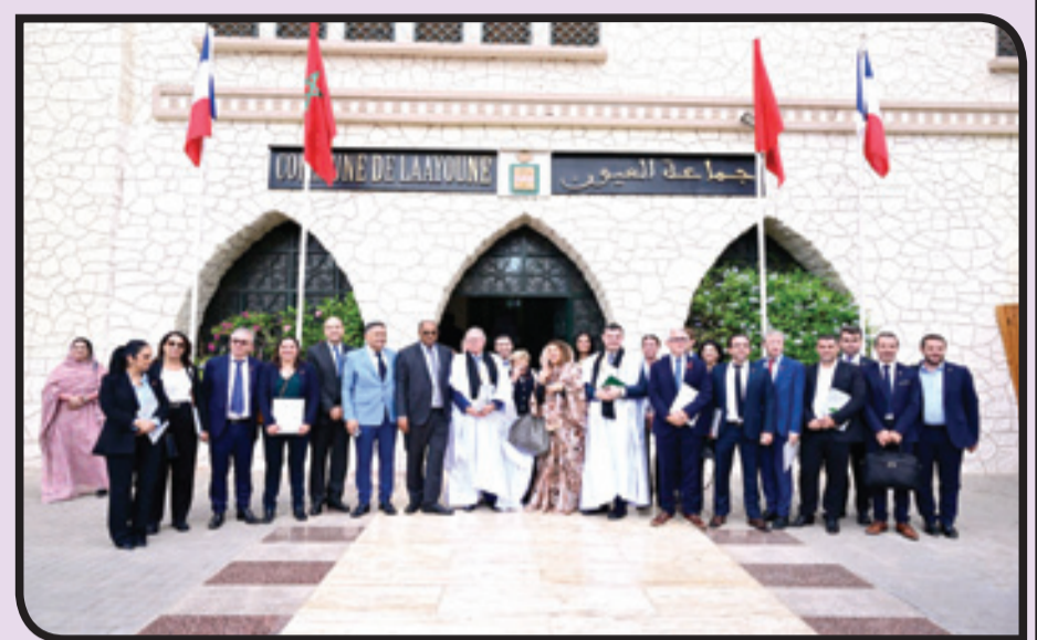
من زيارة الوفد الفرنسي

وقالت إن خطط التنمية الإقليمية والجماعية «طموحة للغاية»، داعية الشركات الفرنسية للانضمام إلى هذه الدينامية الواعدة. من جانبه، أكد السيد جيفر أن هذه الزيارة تندرج في إطار تفعيل الاتفاقيات الموقعة خلال الزيارة الرسمية التي قام بها الرئيس الفرنسي إيمانويل ماكرون للمغرب مؤخرًا، مشيرًا إلى أن الطرفين يخرطان ضمن آفاق خلق الثروة وفرص الشغل على مستوى الجهة، لفائدة الساكنة المحلية. وبالمناسبة ذاتها، زار أعضاء الوفد المعهد الإفريقي