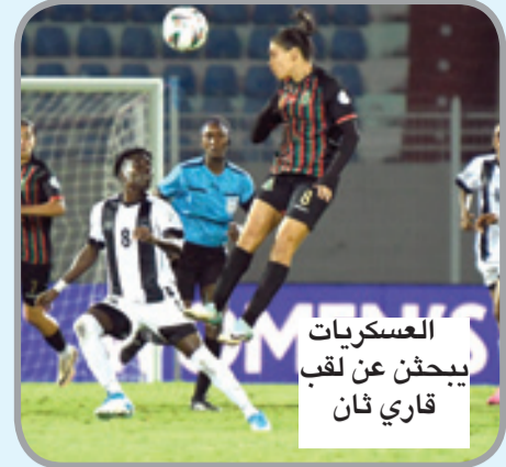
العسكريات يحتشن عن لقب قاري ثان