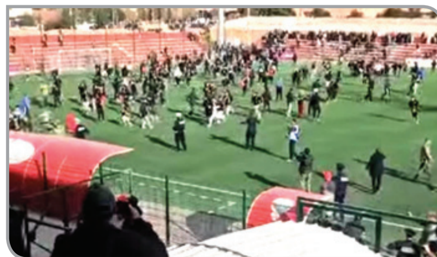
لحظة اجتياح الجماهير لأرضية الملعب

متطابقة ما يفيد بنقل خمسة مصابين إلى المستشفى الإقليمي لتلقي العلاج، فيما أوقفت السلطات الأمنية أربعة أفراد بتهم تتعلق بأعمال الشغب، كما لحقت أضرار مادية بعدد من السيارات كانت مركونة قرب الملعب، بالإضافة إلى تخريب أجزاء من منشآته ومقاعد، قبل تنظيفه من الحجارة المتناثرة من