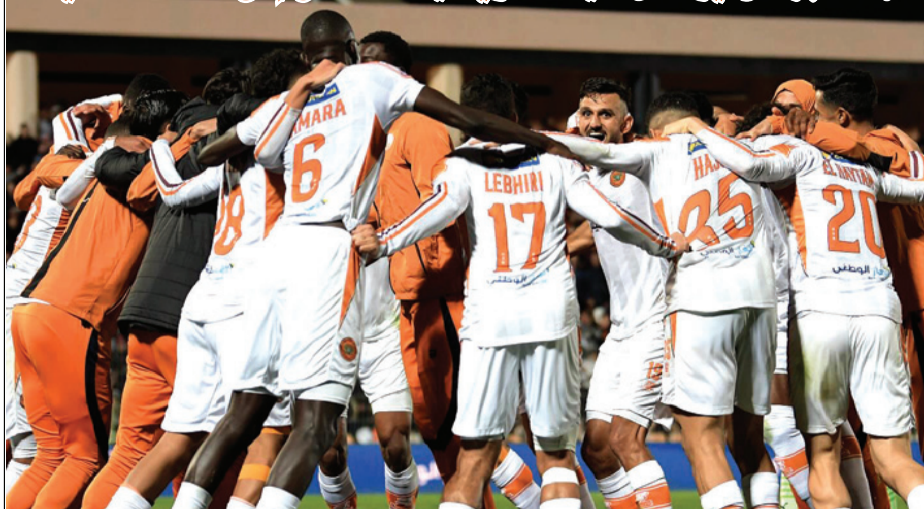
فرحة بركانية بأفضل انطلاقا