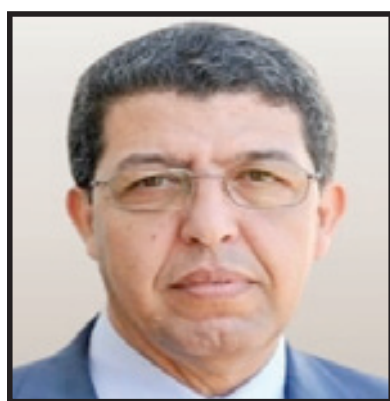
البروفيسور عمر بطاس

لقد أصبح بناء مستشفيات خاصة بالصحة النفسية والعقلية أمرا متجاوزا وغير مرغوب فيه لعدة أسباب، منها ما يتعلق بالوصم والتمييز إلى جانب كلفتها الباهظة بشريا وماديا، وعليه فنحن نحتاج اليوم إلى وحدات في جميع المستشفيات، منها المختصة في الطب النفسي عند الصغار، وأخرى خاصة بالكبار، إضافة إلى وحدات للمسنين، مع ضرورة التفكير في وحدات خاصة بالمسنين، بالنظر لأننا في فترة انتقالية تعرف ارتفاعا في أمد الحياة،