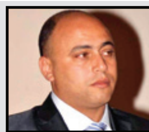
بالصدي وحيد مبارك